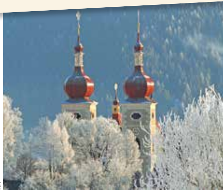
Die Türme der Stiftskirche leuchten künftig im Lichte der Barmherzigkeit.