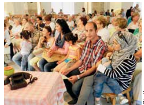
Die ersten Flüchtlinge im Sommer 2015 in St. Lambrecht.

Durch die Möglichkeit, tageweise bei Domenico im Stiftsgarten und bei der Marktgemeinde am Bauhof mitzuarbeiten, konnten die männlichen Asylwerber nicht nur das Gefühl bekommen, gebraucht zu werden, sondern durch ihren Einsatz auch ein wenig Dankbarkeit dafür zum Ausdruck bringen, dass Sie bei uns in St. Lambrecht einen sicheren Aufenthaltsort gefunden haben und leben dürfen. PGer ■