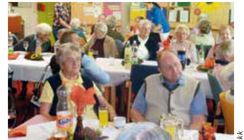
Eine nette Feier im Seniorenheim.

„Herbstmesse“ war ein Erfolg Durchgeführt vom Gemischten Chor findet jährlich der Fetzenmarkt im Veranstaltungszentrum statt. Säuberlich sortiert und übersichtlich angeordnet werden die Sachen zum Kauf angeboten. Der Besucheransturm übertraf wieder alle Erwartungen, weil die „Lambrechter Herbstmesse“ eben einen hohen Bekanntheitsgrad hat. HPIö ■