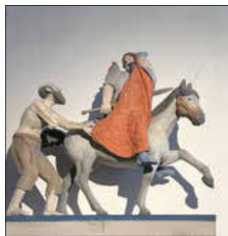
Skulptur: Sankt Martin teilt seinen Mantel mit einem Bettler

Montag, den 11.11.2024 findet der traditionelle Sankt Martinsumzug in Rückweiler statt.