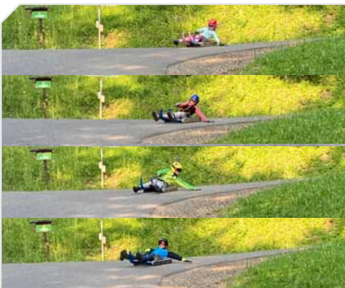
Trainingsläufe in der Südsteiermark.

Höhepunkt der diesjährigen Rollenrodelsaison wird die Weltmeisterschaft in Tyrnau/Nechnitz (Steiermark) von 27. bis 29. August 2021. Für diese aufregenden Wettbewerbe wünschen wir unseren SportlerInnen viel Erfolg und unfallfreie Rennen!