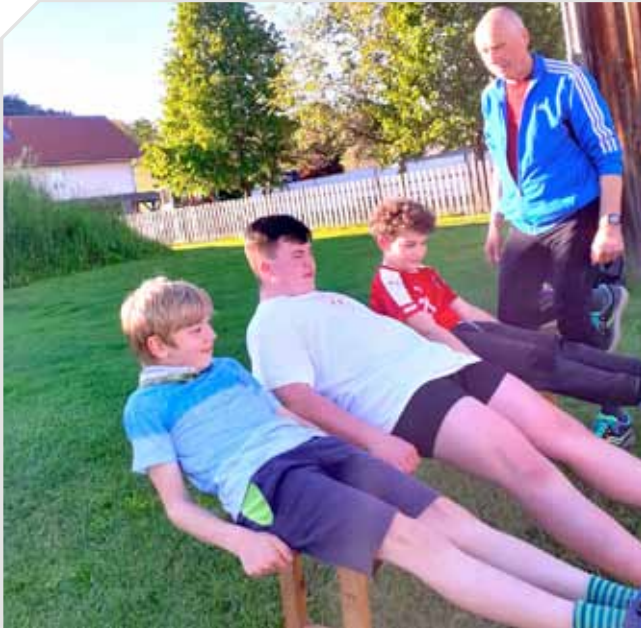
Bauchmuskel-Training - das Um und Auf für Rodler.