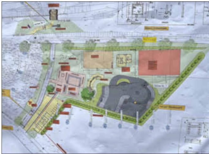
Planung für den Stadtpark

„Was lange währt, wird endlich gut.“, mit diesem oft zitierte Satz von Ovid eröffnete Bürgermeister Marx seinen Rückblick auf den Weggedang dieses Projektes. Seinen Ursprung hat es in einer Zukunftswerkstatt, die Stadt- und Kreisjugendamt im Jahr 2018 im Rahmen des Jugend-Beteiligungsprojektes ‚Jump-IO!‘ durchführten. Zu den zahlreichen Ideen, die die Schüler damals ersannen, gehörte auch ein Stadtpark, gedacht als Treffpunkt für Jugendliche mit Sportmöglichkeiten, Grillstelle und weiteren Freizeiteinrichtungen. Rückenwind bekam das Konzept Anfang 2019, als es im Rahmen des Jugend-Engagement-Wettbewerbs als eines von insgesamt 36 Projekten aus ganz Rheinland-Pfalz ausgezeichnet wurde.