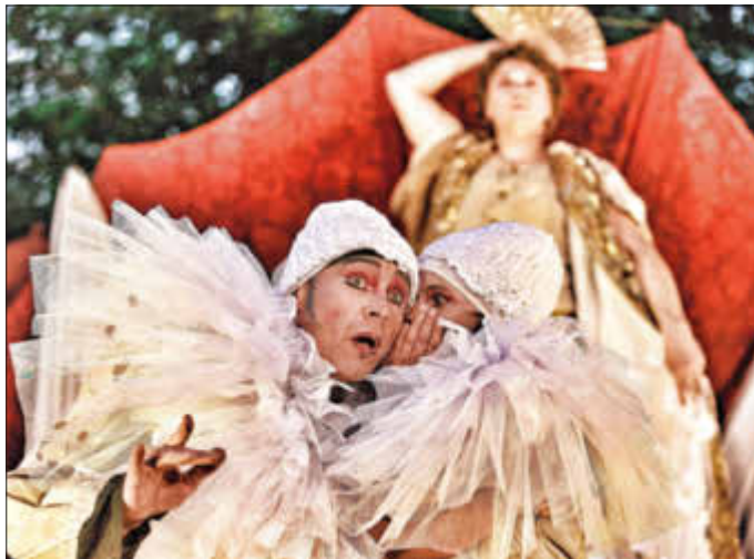
Mit „Molière“ präsentiert NN beim THEATERSOMMER erneut ein pralles Stück Volkstheater.

Der THEATERSOMMER Idar-Oberstein wartet in diesem Jahr mit viel Musik auf. Aber auch das Schauspiel kommt nicht zu kurz: Am Freitag, 25. August 2023, um 20 Uhr zeigt das NN Theater Köln an der Historischen Weiherschleife das Stück „Molière – Drama, Dreck und Don Juan“. Der THEATERSOMMER ist eine Veranstaltung der Stadt Idar-Oberstein. Das Festival wird unterstützt von der Kreissparkasse Birkenfeld, der OIE AG, der Firma Effgen Schleiftechnik, der Bürkle Stiftung und dem Land Rheinland-Pfalz.