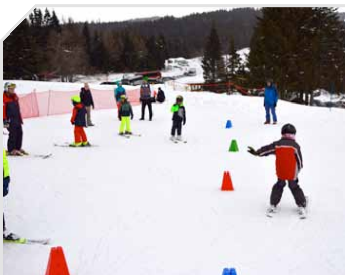
Schikurs mit den Volksschülern bei den Klug-Liften

Endlich war es wieder soweit und wir konnten gemeinsam mit dem Elternverein der Volksschule nach zweijähriger Pause wieder den Schikurs mit den Kindern abhalten, an dem zahlreiche Schüler aber auch Kindergartenkinder mit Begeisterung teilnahmen. Unter anderem hatten wir in diesem Jahr 10 Kinder, die als Anfänger starteten und bis zum Ende des Schikurses gut auf den Schiern unterwegs waren. Aber auch bei unseren drei fortgeschrittenen Gruppen konnten wir täglich Entwicklungen beobachten. Dafür möchten wir uns natürlich recht herzlich bei unseren Schilehrern bedanken, die alle samt ehrenamtlich dabei waren, ihr Bestes für die Kinder gaben und wirklich hervorragend zusammengearbeitet haben. Natürlich geht auch ein großes Danke an den Elternverein, der uns durch diese Zusammenarbeit diesen Kurs möglich gemacht hat. Wir sind sehr dankbar für alle Kinder, die eine so große Begeisterung und Freude am Schifahren haben. Wir freuen uns bereits auf 2024 mit euch und auf viele weitere Kinder, die diese Chance gerne nutzen möchten.