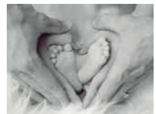
Emil Hasenauer St. Nikolai i. S.

Die nächste Ausgabe des St. Nikolaier GemeindeKuriers erscheint im Sommer 2023. Redaktionsschluss: 16.06.2023