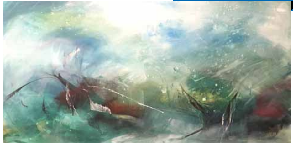
„eintauchen“ Acryl auf Leinwand 60x120