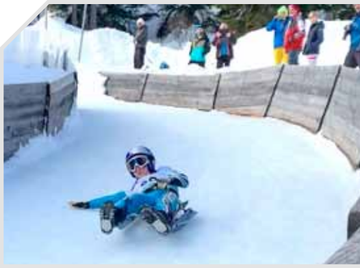
Rasante Zieleinfahrt auf der Winterleiten