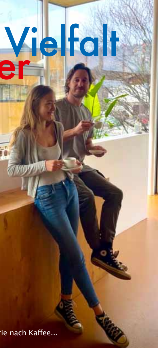
...ie nach Kaffee...