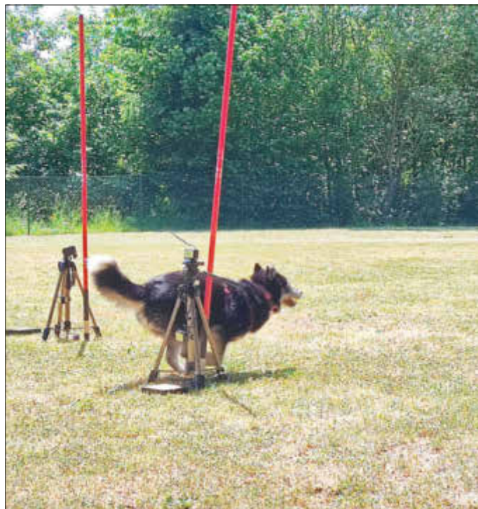
Übrigens, beim Hunderennen rennen nur die Hunde

Der Verein freut sich auf eine schöne Veranstaltung