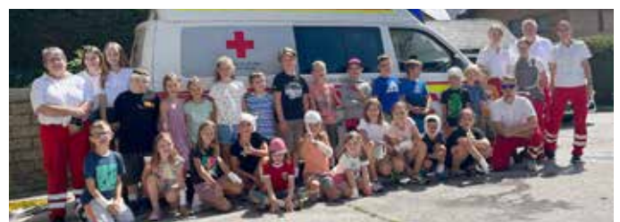
... auch das Rote Kreuz Bad Mitterndorf war bei der Sommergaudi Programm.