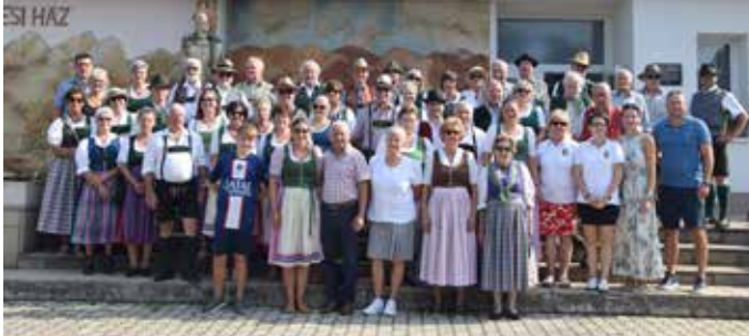
46 Bad Mitterndorfer vorm Parlament in Budapest beim heurigen Partnerschafts-Besuch im August sind definitiv ein Foto wert.

Anlässlich des Ungarischen Nationalfeiertages am 20. 8. 2024 und der bereits 32-jährigen Partnerschaft besuchte eine 46 Personen starke Abordnung aus der Marktgemeinde Bad Mitterndorf/Tauplitz die Gemeinde Iklad in Ungarn.