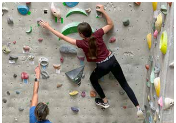
An der Kletterwand des Alpenvereins bewiesen die Jugendlichen Mut und Geschicklichkeit.