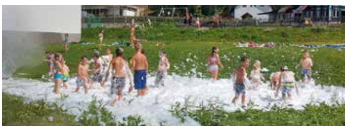
Fazit: ein Sommer ohne Sommergaudi ist fad!