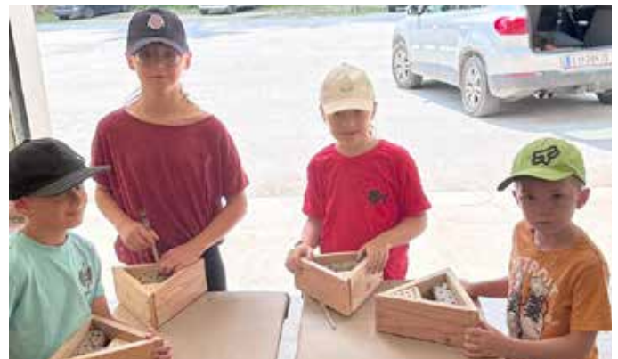
Wenn Kleine Großes tun – der Nisthilfen-Bau im Rahmen der Sommergaudi war ein nachhaltiger Erfolg.

landesprogramm für energieeffiziente gemeinden