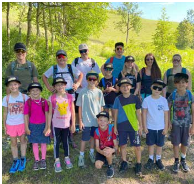
Das Jugendlager der TK Tauplitz war erneut gut besucht und hat sichtlich Spaß und Freude gebracht!

Die Trachtenkapelle Tauplitz bedankt sich auch auf diesem Wege bei all ihren Gönnern und Förderern und wünscht allen einen schönen Herbst!