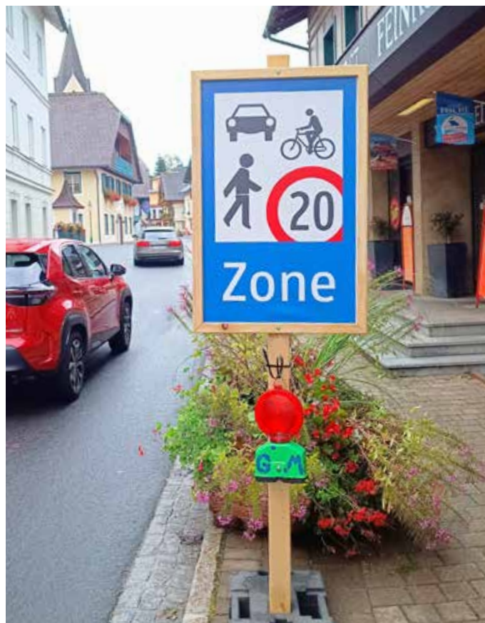
Die temporäre Begegnungszone wurde zum einen durch diese Verkehrstafeln am Anfang und Ende markiert...

schriftlich auf der Gemeinde zu deponieren).