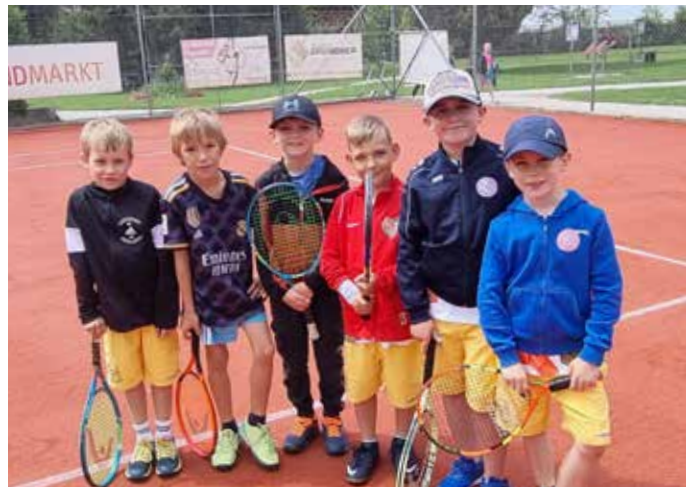
Bereits mit 6 Jahren beginnt das erste Tennistraining!