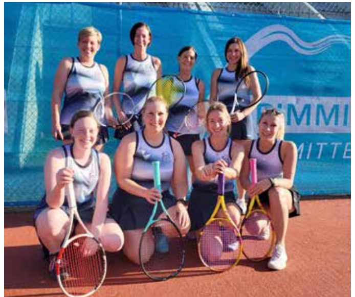
Unsere Damenmannschaft schrammten knapp am Aufstieg vorbei! Hoffentlich gelingt es im nächsten Jahr!