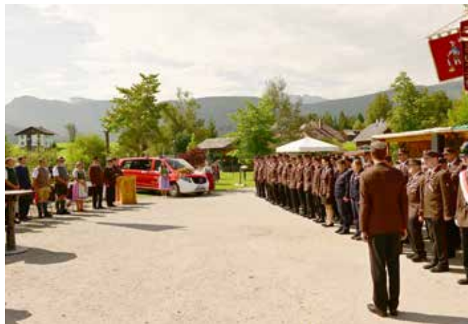
Beim 35. Neuhofner Dorffest wurde die Fahrzeugweihe des neuen MTFs der FF Neuhofen feierlich durchgeführt.

Den krönenden Abschluss des Festwochenendes bildete am Abend eine große Tombola. Unter den vielen anwesenden Teilnehmer:innen hatte eine Frau aus Admont das große Glück, den Hauptpreis zu gewinnen: Eine Traum-Urlaubswoche für zwei Personen im Aldiana Club Fuerteventura.