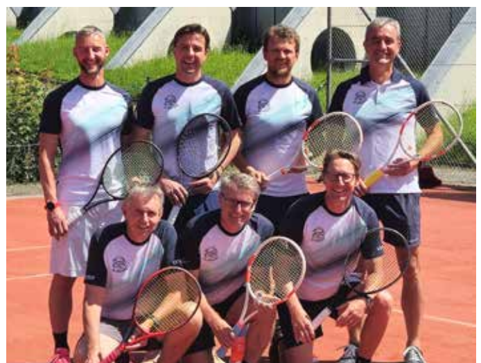
Team Herren +45er wurde Vizelandesmeister und strebt für die nächste Saison wieder den Aufstieg an.