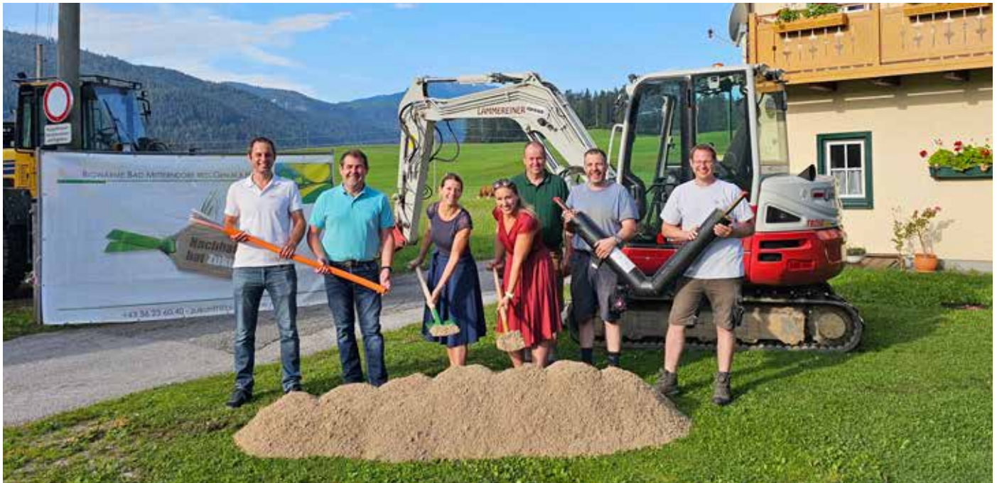
Beim Spatenstich vereint: Biowärme und Glasfaser – Effizienz durch gezielte Zusammenarbeit.

Gemeinsam für den Klimaschutz – das ist unser Motto!