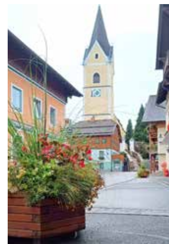
... und zum anderen haben Blumenkisten und Co. für eine Minderung der Geschwindigkeit des Verkehrs gesorgt.