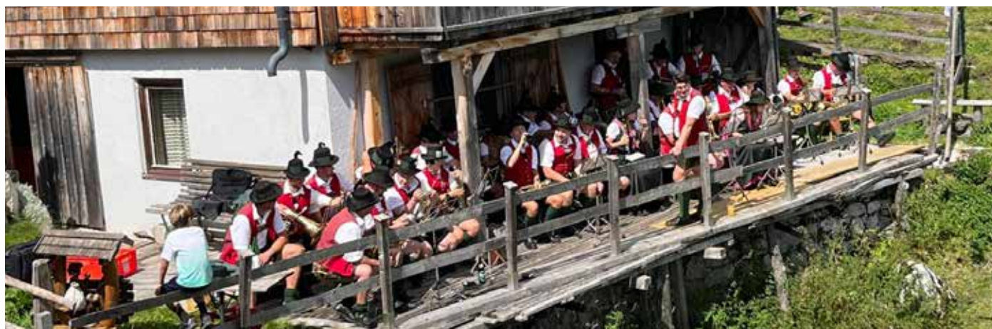
Am 15. August erreichte die TK Tauplitz neue Höhen: Ein Konzert am Steirersee auf der Tauplitzalm bot ein unvergessliches Erlebnis für Musiker und Gäste.