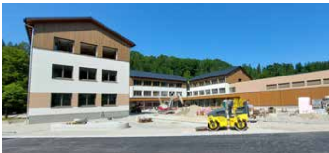
Ein Jahr hielten die intensiven Umbau- und Renovierungsarbeiten an der Mittelschule in Bad Aussee an.

Im August fand bereits eine kleine Feier zum erfolgreichen Abschluss der Bauarbeiten statt. Zu diesem Anlass wurden die beteiligten Firmen und Handwerker zu einer gemütlichen Jause eingeladen.