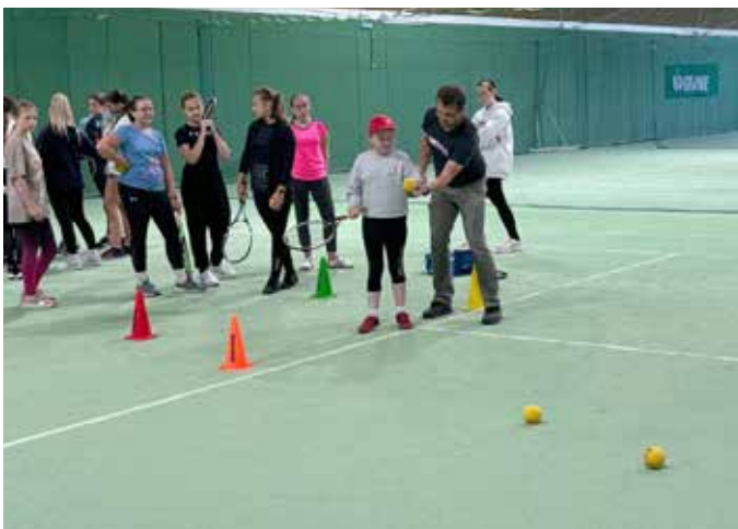
Bei der Tennis-Station hatten die Schüler die Gelegenheit, unter Anleitung von erfahrenen Trainern ihre Schlagtechnik zu verbessern.

Reisinger, Bäckerei Schlömmer und Spar/Landmarkt statt und die Jahrgangs- und Tagesbesten wurden gekürt. Ein Dankeschön an alle Teilnehmer:innen, Vereine, Sponsoren und das Team der MS Bad Mitterndorf! Auf einen sportlichen Herbst!