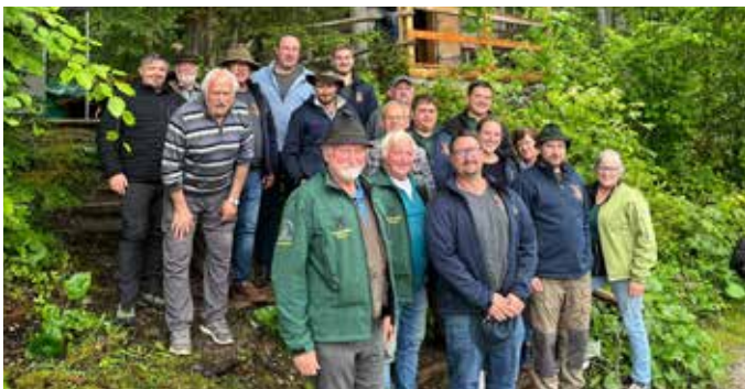
Auch der Fischerverein aus unserer Partnerstadt Röttingen besuchte den Fischerverein Ödensee im Sommer 2024 zum Meinungsaustausch und zum Kennen lernen. 2025 kommt es zum Gegenbesuch in Röttingen - Petri Heil