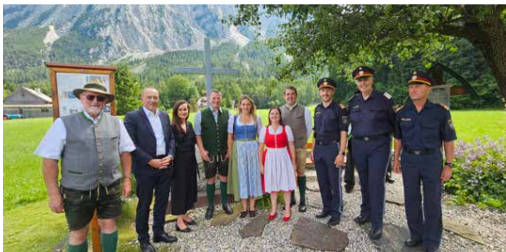
„Nie wieder“ – vor 90 Jahren kam es zum tragischen Putschversuch am Fuße des Grimmings. Zum Jahrestag fand in Girtstatt eine Gedenkveranstaltung statt.

Die Feierlichkeiten wurden von Vertretern der Polizei, des Kameradschaftsbundes, der Politik und der Bevölkerung begleitet. Die Redner betonten, dass die Geschehnisse von 1934 uns mahnen sollten, die Grundrechte und die Gemeinschaft zu schützen. „Nie wieder“ darf nicht nur eine Floskel sein, sondern muss als Verpflichtung für die Zukunft verstanden werden. Nur im Dialog und