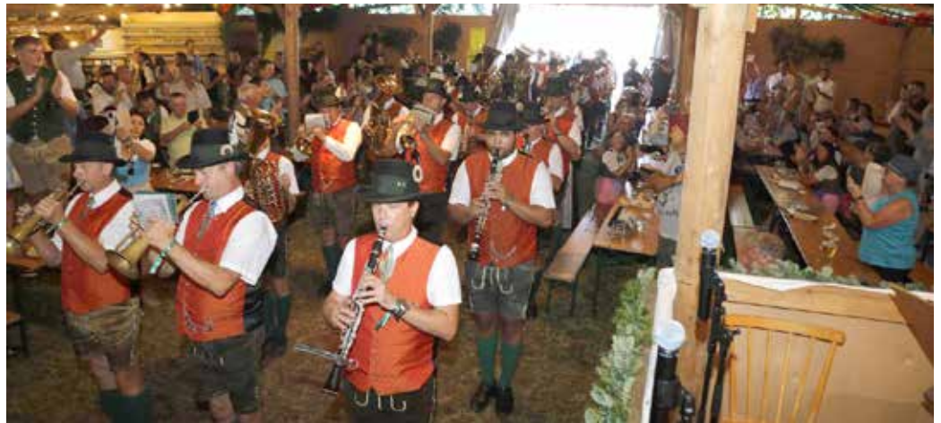
Der Einzug und das anschließende Gastkonzert beim diesjährigen Altausseer Bierzelt werden den Musikanten noch lange in Erinnerung bleiben.

Ein besonderer Höhepunkt war der 25. Mai, als die Mit-