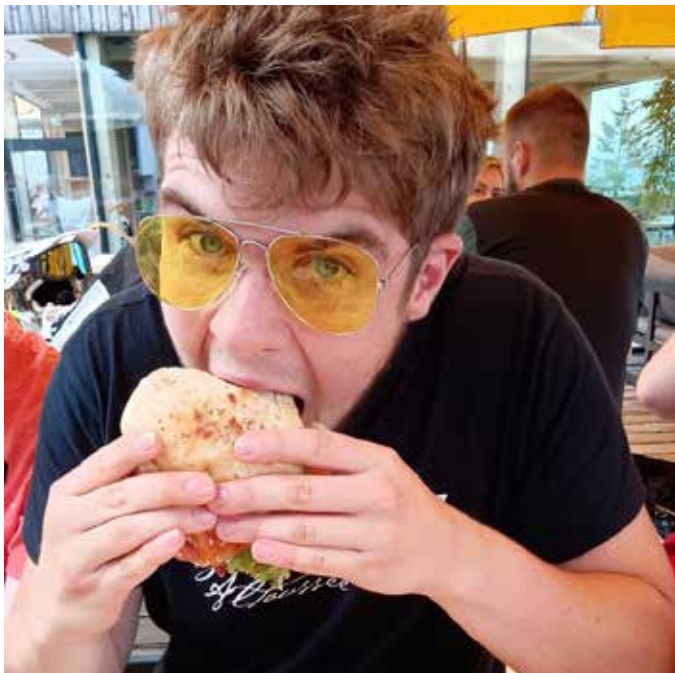
Der Ennstaler Almtraum hat offensichtlich gemundet.

Es hat sich wieder gezeigt, dass der verpflichtende Praxisteil und das Arbeiten in Teams die Diplomarbeiten an berufsbildenden Schulen wesentlich bereichern.