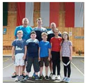
... die Hundeschule sowie der Eisstock Verein ...