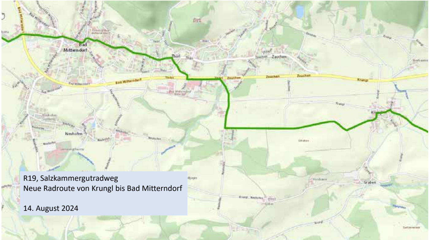
R19, Salzkammergutradweg Neue Radroute von Krungl bis Bad Mitterndorf