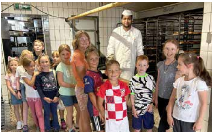
Ein Blick hinter die Kulissen: Die Kinder zu Besuch in der Dorfbäckerei Schlömer.