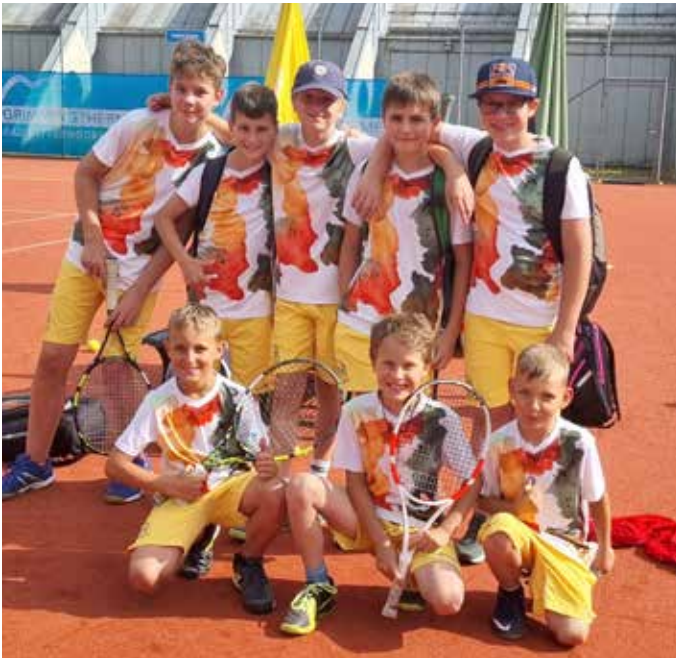
Ein Teil der erfolgreichen Jugend-Teams des TC GimmingTherme Bad Mitterndorf