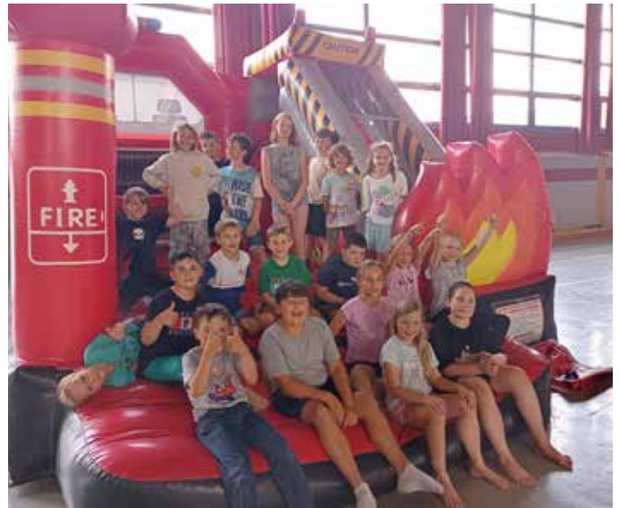
Die Hüpfburg sorgte für viel Spaß beim heurigen Abschlussfest der Nachmittagsbetreuung Bad Mitterndorf.

In der letzten Schulwoche konnten wir, ebenfalls dank unserer Sponsoren, weitere Highlights anbieten: besonders das Eisessen in KOGLERS KUCHL war ein Hit bei den Kindern. Als krönenden Abschluss erhielten alle Kinder einen Gutschein für ein Eis von der Bäckerei Reisinger, um die Sommerferien richtig genießen zu können. Ein herzliches Dankeschön an unsere Sponsoren: Fa. Aqua San, Fa. Maierhofer, Aldiana Salzkammergut, Fa. Hübl, Spar Landmarkt, Fa. Wach und die Gemeinde Bad Mitterndorf