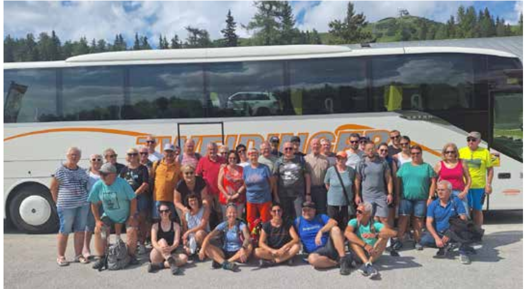
Der TSV Röttingen war sichtlich begeistert vom heurigen Besuch ihrer Partnergemeinde. Wir freuen uns schon auf nächstes Jahr, wenn wir euch zu eurem 130-jährigen Bestandsjubiläum besuchen kommen dürfen!

Am Abend durften die Gäste auch noch an der 150. Jahrfeyer der FF Bad Mitterndorf teilnehmen. Anschließend besuchten alle das Zeltfest der FF Bad Mitterndorf, wo noch ausgiebig gefeiert wurde. Mit vielen positiven Eindrücken traten unsere Gäste am Sonntag die Heimreise an.