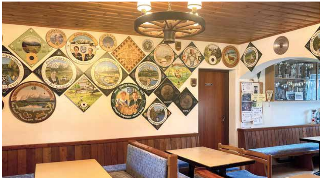
Nostalgie – 70 Jahre Erfolgsgeschichte des Schützenvereins Kainisch befestigt an der Wand im Vereinsheim