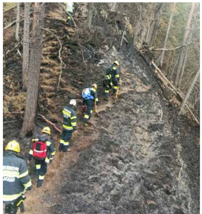
Die FF Zauchen spürte beim Waldbrand in Wildalpen im April mittels Drohneneinsatzes Glutnester auf – ihr unermüdlicher Einsatz war maßgebend, dass der Waldbrand in Schach gehalten wurde.