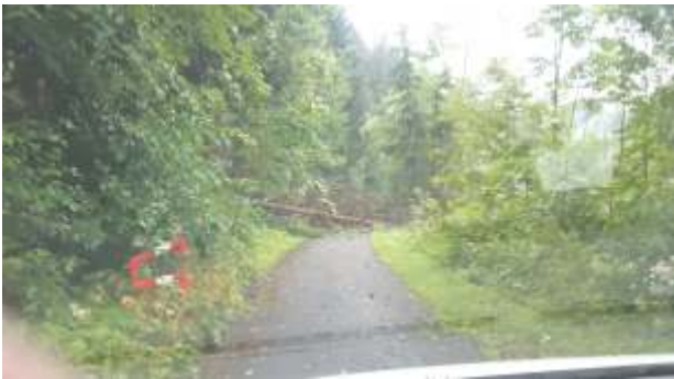
Unwetterschäden Radweg R2

Für jede Schadensart ist ein eigener Privatschadensausweis zu stellen.