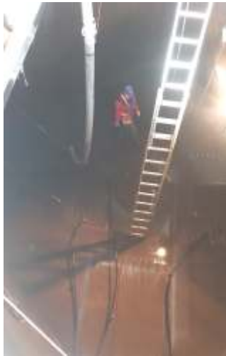
Arbeiten bei der Kläranlage St. Ruprecht