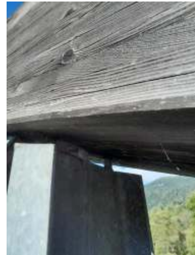
BV San. Wandritschbrücke