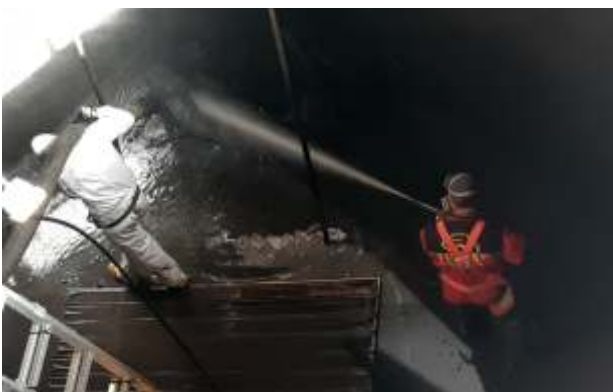
Arbeiten bei der Kläranlage St. Ruprecht