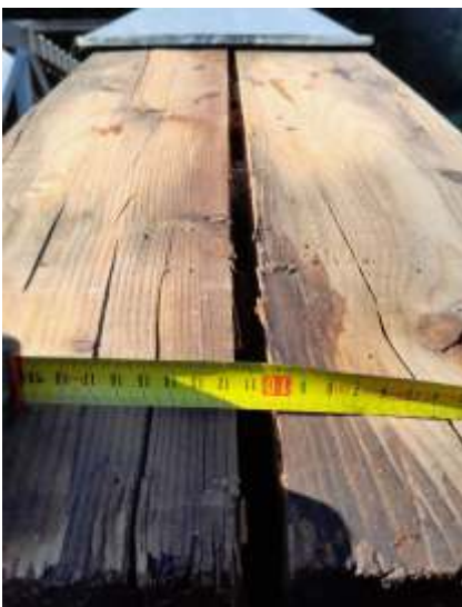
BV San. Wandritschbrücke