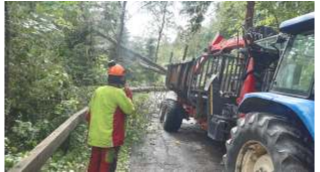
Unwetterschäden Radweg R2