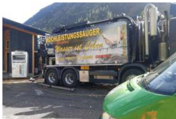
Die Profis sind vor Ort