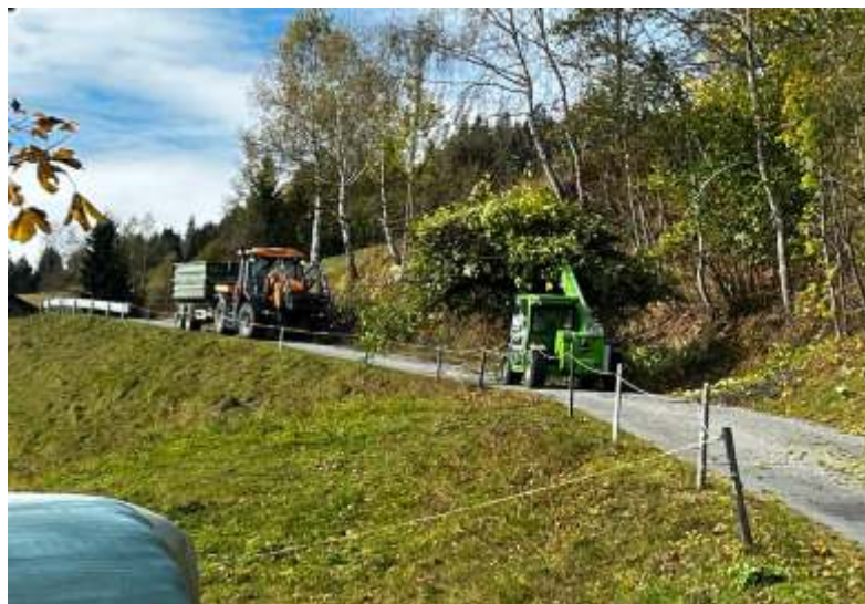
Staudenschnitt im Gemeindegebiet