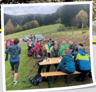
Gemeindefwandertag 2023 Seite 6