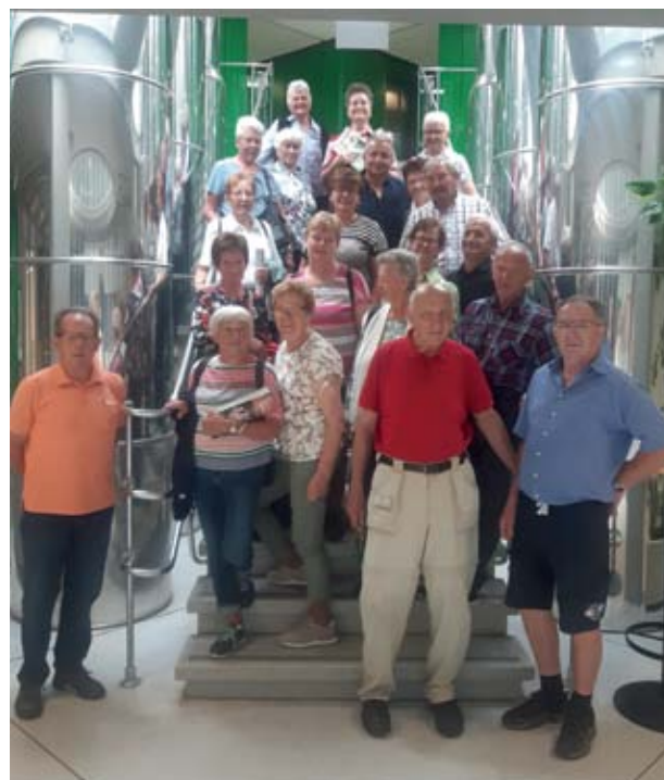
Der Seniorenbund Scheifling/St. Lorenzen im ORF Landesstudio Steiermark.