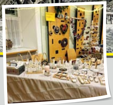
2. Scheifflinger Adventmarkt Seite 23