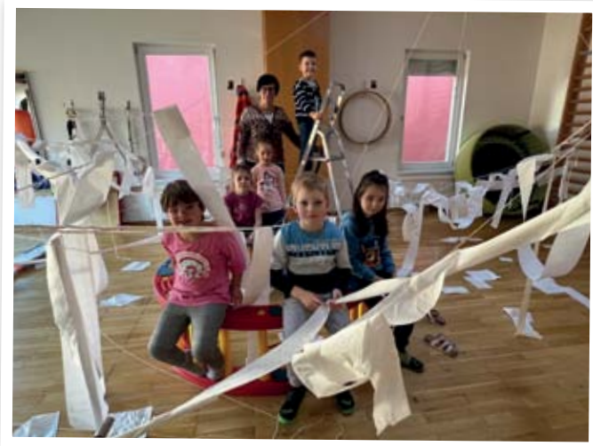
Geister spuken hier im Haus

tenz mit ein. Im täglichen gemeinsamen Miteinander fördern und stärken wir die sozial – emotionalen Kompetenzen der Kinder. Sei es bei einem Streit, wenn man traurig oder wütend ist, oder glücklich, weil man etwas geschafft hat und sich mit anderen freuen kann. Diese sozial-emotionalen Kompetenzen braucht ein Kind, um sich in der Gesellschaft zu Recht zu finden. Unser kleines WIR vermittelt uns dies sehr eindrucksvoll. Es wächst und wird groß, wenn Kinder teilen, miteinander achtsam umgehen, nett zueinander sind u.v.m. Es schrumpft, ist traurig, zornig und ärgert sich bei Streit. Angst und Liebe sind die stärksten Gefühle. Gegensätzlicher könnte es nicht sein. Nehmen Sie die Gefühle Ihrer Kinder ernst. Sprechen Sie darüber. Wieso hast du Angst? Wovor fürchtest du dich? Wie fühlt sich das an? Was macht dich traurig? Warum bist du glücklich? Wenn sich ein Kind nach Liebe sehnt, Schmerzen hat oder traurig ist, können eine Umarmung und ein Kuss wahre