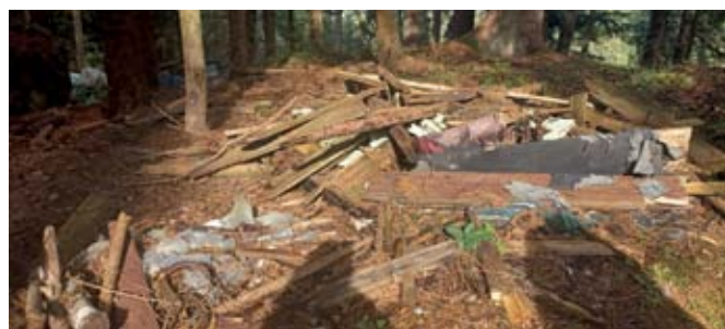
Müllablagerung im Wald