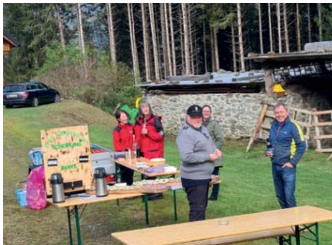
Labestation beim Gemeindegandertag am 26. Oktober