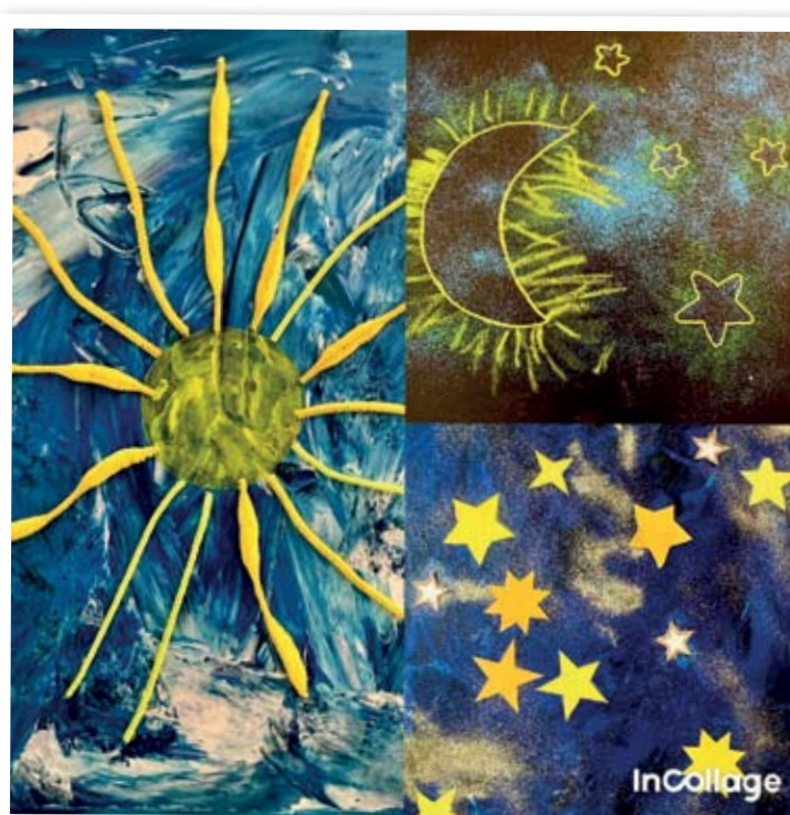
Sonne, Mond und Sterne

Wunder wirken und rasche Heilung bringen. Weihnachten ist das Fest der Familie, der Freude und Hoffnung und der Liebe mitten in der kalten Winternacht. Gottes Liebe wurde als Mensch geboren. Jesus - ein Licht für dich, ein Licht für mich, ein Licht für die Welt! Fühlt und spürt die frohe Botschaft! Wir wünschen euch ALLEN eine Adventzeit zum Wohlfühlen sowie zauberhafte, glückselige Weihnachten und alles Gute für das neue Jahr!