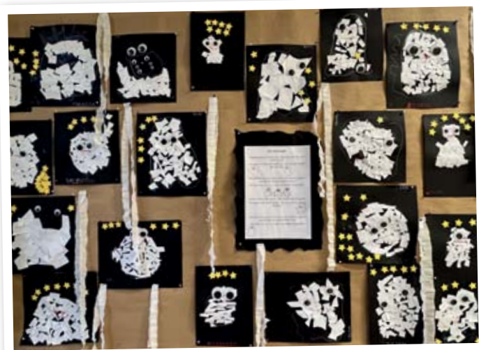
So stell ich mir einen Geist vor - kreative Kinderarbeiten