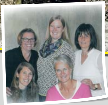
Gemeindekindergarten St. Lorenzen Seite 12