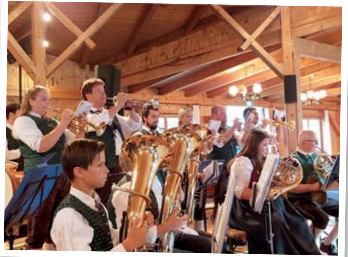
Parkfest in Teufenbach

Viel Freude haben uns auch die zahlreichen Zuhörer/innen bei unserem