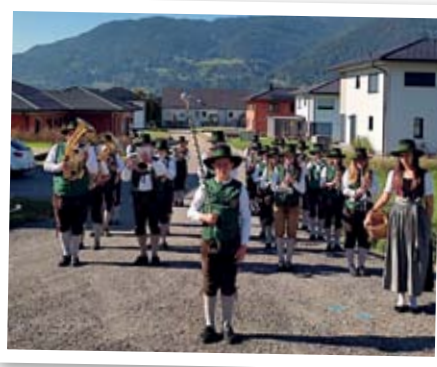
Tag der Blasmusik am 9. September