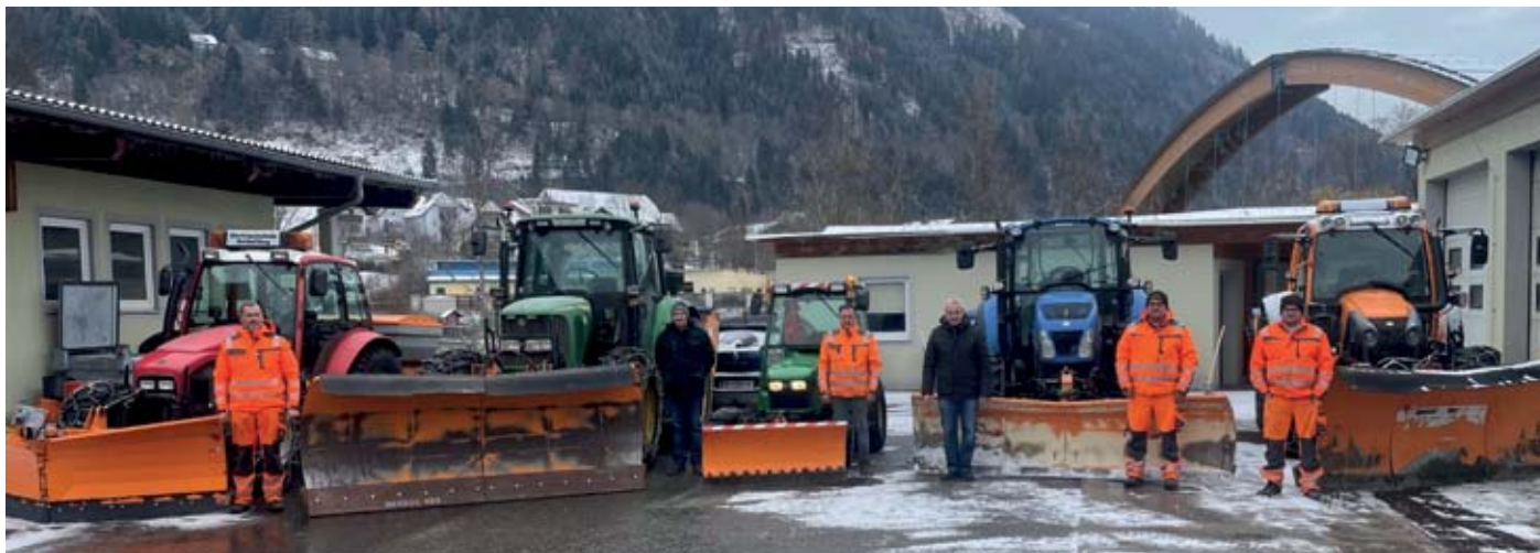
Die Mitarbeiter und Fahrzeuge des Winterdienstes sind für die kommenden Monate gerüstet.

busstrecken haben selbstverständlich Vorrang. Ein großer Dank an unsere Mitarbeiter des Bauhofes, die sehr oft in der Nacht und bei entsprechenden Schneefall unzählige Stunden im Einsatz sind. Trotz der Einsätze unserer Mitarbeiter ist jeder Kraftfahrzeugbesitzer verantwortlich, dass sein Fahrzeug eine entsprechende Winterausrüstung besitzt und natürlich die Geschwindigkeit auf die Straßenverhältnisse anpasst.