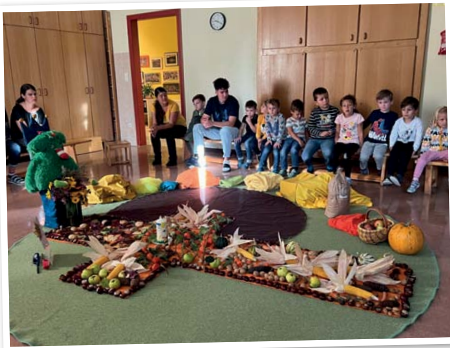
WIR feierten unser ERNTEDANKFEST!

Licht könnten die meisten Lebewesen der Erde nicht existieren. Wir brauchen das Licht zum Leben, wie die Luft zum Atmen.