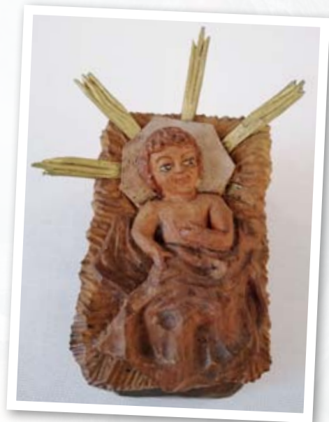
Jesukind Pfarrkirche Scheifling - St. Thomas

Wenn nur die Menschheit schaut aufs Kripperl hin, vü mehr Fried in der Wölt wär drin. Wos sogt uns nur dos Kripperl in da heitign Zeit? Mochts auf eire Herzn und seids bereit. Schaunts aun dos kloane Kinderl drin, es warat für die große Wölt a wirklicha Gwinn. Grod jetzt in dera Zeit vulla Krieg, Hoss und Graus, wölche Botschoft strohlt uns dos Kinderl aus? Schaunts hin, wos sogt uns wui da kloane Mund? Wia sogt ma wos, a liabes Wort zu jeda Stund. Monche Worte mochn den Mitmenschn wund, aundere Worte mochn den Mitmenschn wieder gxund. Die kloan Fiaßla, ah wenn sie no nit gean weit, dem Mitmenschn zugehen, dem mochts ah Freid. Die kloan Augn, wos die uns wui sogn? Menschheit schauts net weg, schauts hin – tuats es wogn! Wos sogn uns die Ohrn wui vom Kindl? Loasts hin auf die Mitmenschn zur jedn Stindl. Wos sogn uns wui die ausgebratetn Händ? Gebts eich die Haund und es gibt dadurch a Wend. Mit die offenen Orme umschließt dos Kindl die gaunze Erdn: Gloria in excelsis Deo - unsere Wölt sui friedvulla werd'n. Die frohe Botschoft domols und heit: Ehre sei Gott in der Höh und Fried den Menschn usera Zeit!