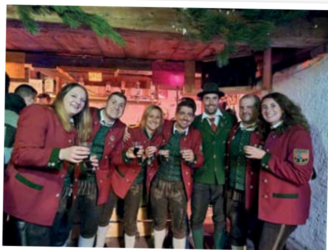
Waldfest auf der Tratte

In diesem Sinne möchten wir uns herzlichst bei euch, liebe Bevölkerung, bedanken. Danke für die großzügige Unterstützung jeglicher Art.