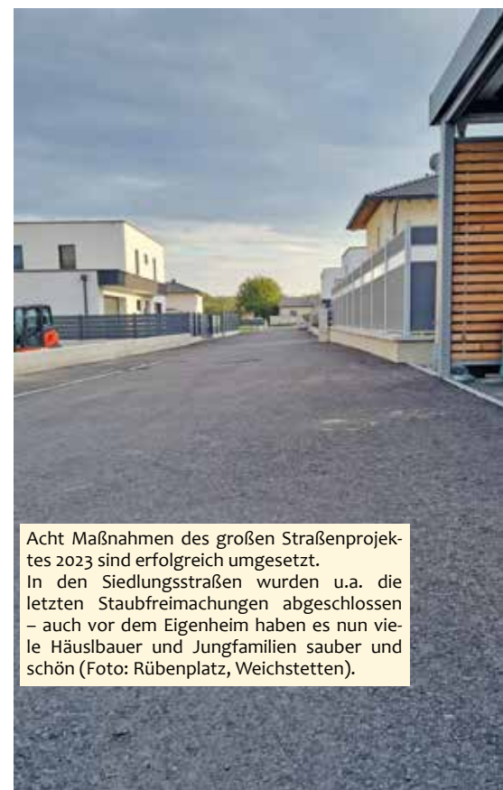
Acht Maßnahmen des großen Straßenprojektes 2023 sind erfolgreich umgesetzt. In den Siedlungsstraßen wurden u.a. die letzten Staubfreimachungen abgeschlossen – auch vor dem Eigenheim haben es nun viele Häusbauer und Jungfamilien sauber und schön (Foto: Rübenplatz, Weichstetten).

Es freut mich, dass für dieses große Verkehrsinfrastrukturprojekt sowohl der Zeit-, als auch Kostenrahmen eingehalten werden konnten. Dies spricht für die professionelle Arbeit aller Beteiligten und ich bedanke mich dafür besonders bei unseren Projektpartnern, dem technischen Büro DI Lassnig (Bauaufsicht) und der Fa. Lang und Menhofer (ausführendes Bauunternehmen).