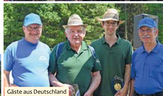
Gäste aus Deutschland