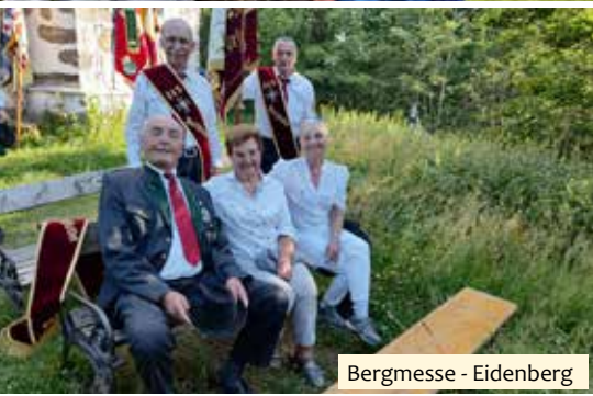
Bergmesse - Eidenberg