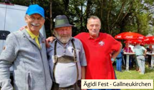
Ägidi Fest - Gallneukirchen