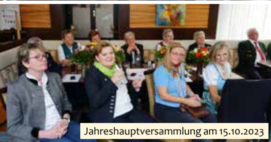
Jahreshauptversammlung am 15.10.2023