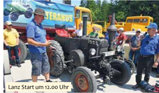
Lanz Start um 12.00 Uhr