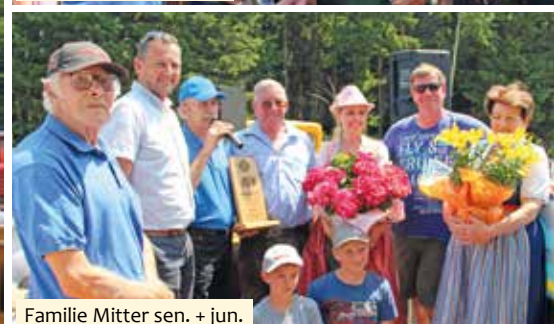
Familie Mitter sen. + jun.