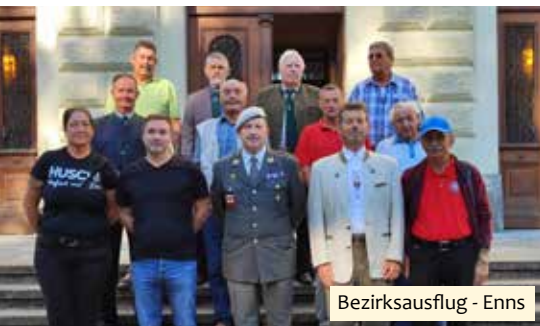
Bezirksausflug - Enns