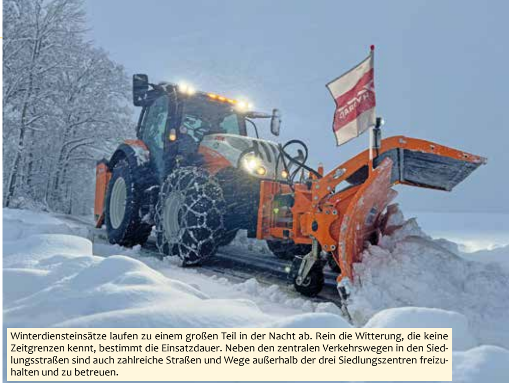
Winterdienstseinsätze laufen zu einem großen Teil in der Nacht ab. Rein die Witterung, die keine Zeitgrenzen kennt, bestimmt die Einsatzdauer. Neben den zentralen Verkehrswegen in den Siedlungsstraßen sind auch zahlreiche Straßen und Wege außerhalb der drei Siedlungszentren freizuhalten und zu betreuen.

Darüber hinaus spüre ich, dass ein gewisses Maß an Bewusstseinsbildung notwendig ist, der ich hiermit nachkommen möchte: Wenn die Schneemassen wie am 1. Adventwochenende vom Himmel kommen, ist für uns alle die Herausforderung im Winterdienst sichtbar und klar. Nicht immer ist aber bekannt, wie die Tage danach ablaufen. Kurz gesagt: Der Dauereinsatz geht weiter – in diesem Fall war dieser vor allem geprägt vom Kampf gegen