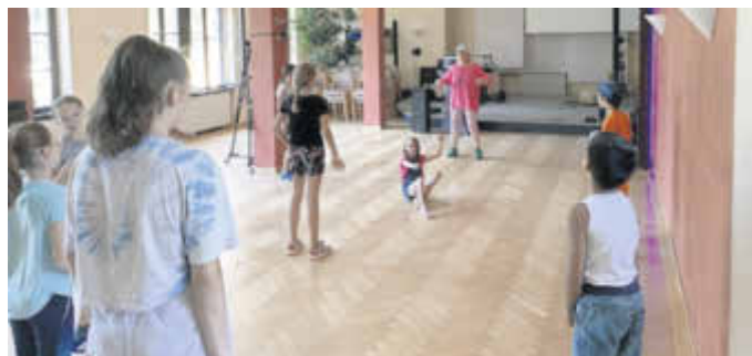
Tanzen bei „We share“

Zum Abschluss der Woche bot „We Share e.V.“ im Jugendtreff in der Gewerbehalle einen Tanz-Kurs an, bei denen die jungen Tänzer zu Friedens-Liedern kreative Choreographien erarbeiten konnten und somit ein in diesen Zeiten wichtiges Zeichen für Frieden und Toleranz setzten.