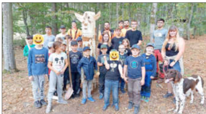
Totempfahl 2. Woche