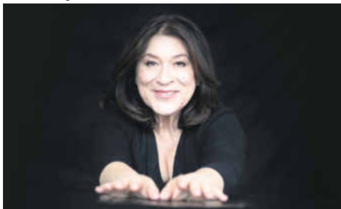
Eva Mattes liest Gedichte von Marlene Dietrich