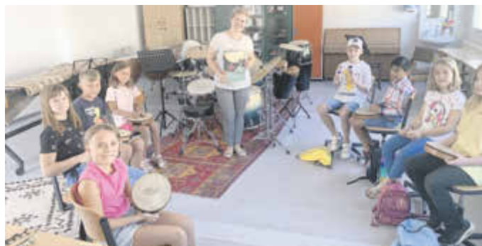
Die Kreismusikschule begeisterte die Kinder mit einem Grusical