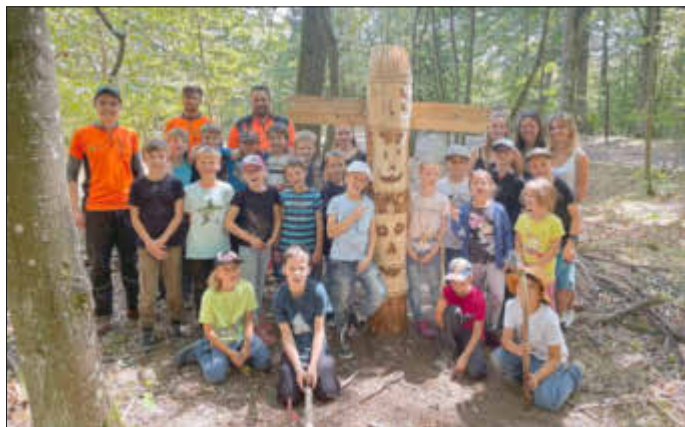
Totempfahl 1. Woche

Ein großes Dankeschön gilt ebenso dem DRK OV Baumholder, den evangelischen Kirchengemeinde Baumholder und Berschweiler sowie der Firma Westrich Reisen für das Bereitstellen der Kleinbusse zum Transport der Kinder ans Waldhaus.