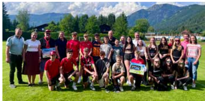
Die Schüler:innen der MS Bad Mitterndorf feierten die Übergabe des gemeinsamen Vorzeigeprojekts.

Klimabündnis Steiermark organisiert, vom Land Steiermark finanziert und durch die Marktgemeinde Bad Mitterndorf unterstützt. Die Installation und Anbindung der Anlage in den Solarkreislauf erfolgten dankenswerterweise durch Biowärme Bad Mitterndorf, Stuchly Installationen, ASV Ebner Transporte und Steinberger Erdnung. Das Ziel des Solarcamps war es, die Schüler:innen und Pädagog:innen für Themen wie den globalen Klimawandel, erneuerbare Energien und nachhaltige Energiewirtschaft auf erlebnisorientierte Weise zu sensibilisieren. Die Solaranlage