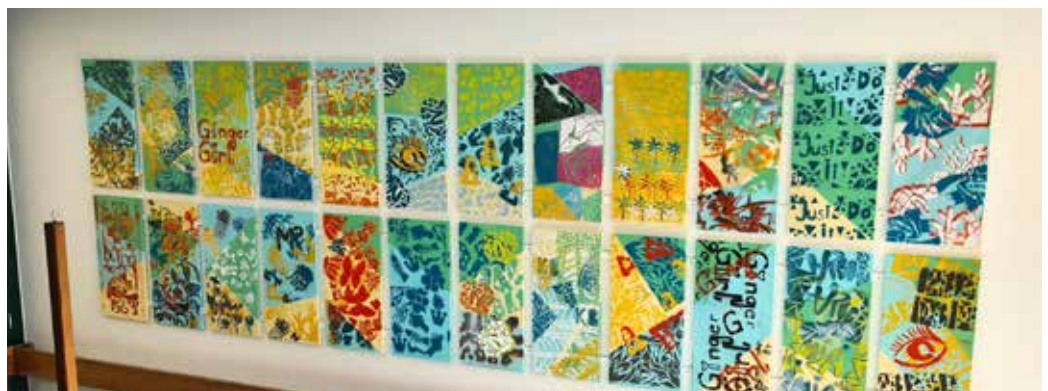
Mit der Graffiti-Technik „Stencil Art“ gestalteten die Schüler:innen eindrucksvolle Bilder, die nun das Stiegenhaus der Schule schmücken.