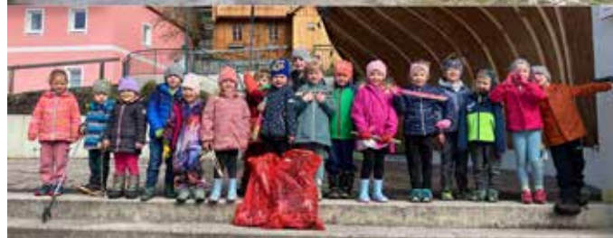
Kleine Helfer mit großer Wirkung! Die Kindergartenkinder von Bad Mitterndorf (Foto oben) und Tauplitz (Foto unten) packten kräftig mit an.