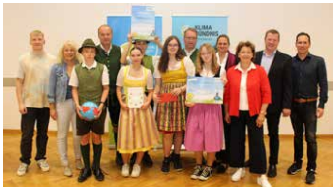
Die stolzen Gewinner wurden im Zuge der Auszeichnungsveranstaltung in Graz am 7. Juni 2024 prämiert.

In der MS Bad Mitterndorf wurden mehrere tolle Projekte mit den Schüler:innen umgesetzt, darunter das Solarcamp mit dem Klimabündnis (Bau eines Solarkollektors für das Fußballvereinshaus), sowie eine 5-wöchige Fahrradaktion, die möglichst viele Schüler:innen und Lehrer:innen zum Fahrradfahren mo-