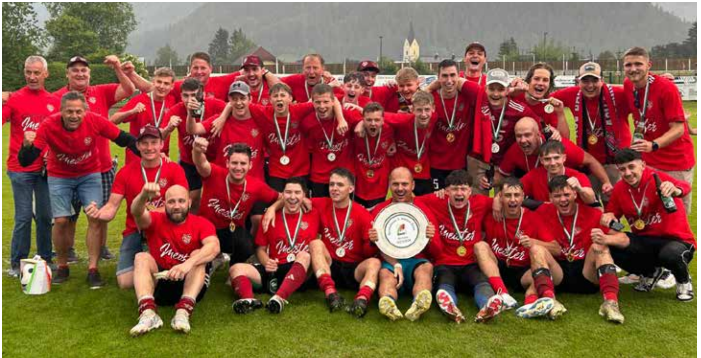
ASV Kampfmannschaft II bei der Meisterfeier

Der ASV Bad Mitterndorf blickt wieder auf eine sehr erfolgreiche Fußballsaison zurück. Die Kampfmannschaft I reiht sich auf Platz 4 mit 45 Punkten in der Tabelle der Oberliga Nord ein.