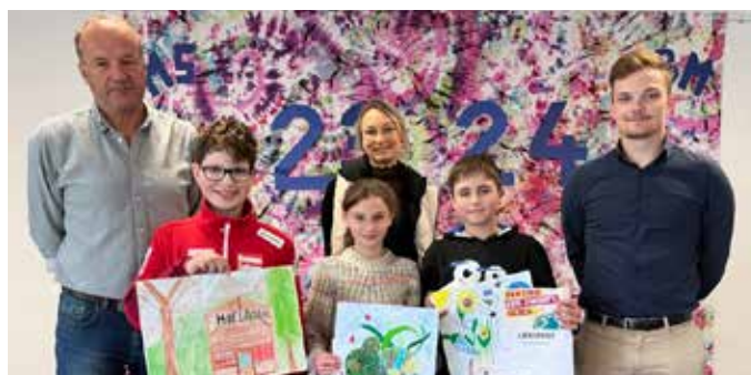
Die Sieger der 2.a-Klasse

allen Zeichnungen einer Klasse die Plätze 1 bis 3 zu vergeben. Die besten drei Zeichnungen pro Jahrgangsstufe erhielten im Rahmen der Siegerehrung wieder tolle Preise. Einige der Sieger-Kunstwerke können in der Auslage der Raiffeisenbank bestaunt werden.