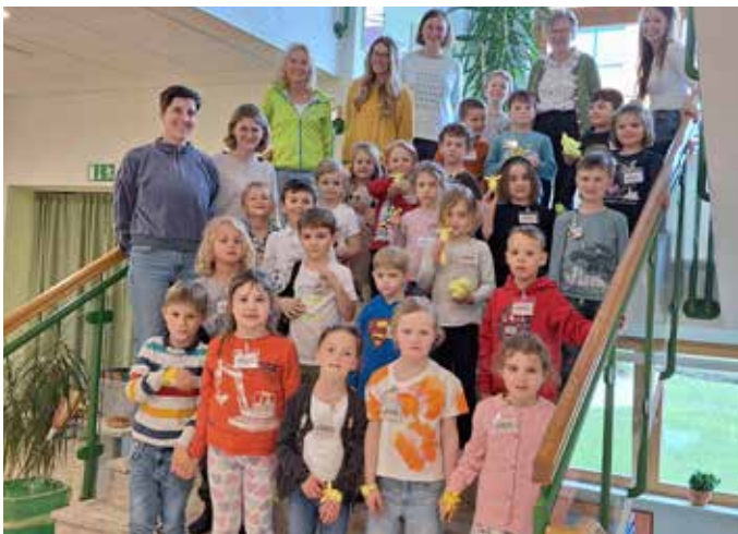
Im Jänner fand die Schülereinschreibung für das kommende Schuljahr statt, gefolgt von Schulanfängernachmittagen an den Volksschulen Bad Mitterndorf und Knoppen. Hierbei konnten die zukünftigen Schüler:innen und Lehrer:innen sich bei verschiedenen Aktivitäten kennenlernen.