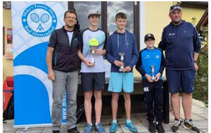
Sieger der Jugendklassen beim STTV-Turnier in Bad Mitterndorf: U13