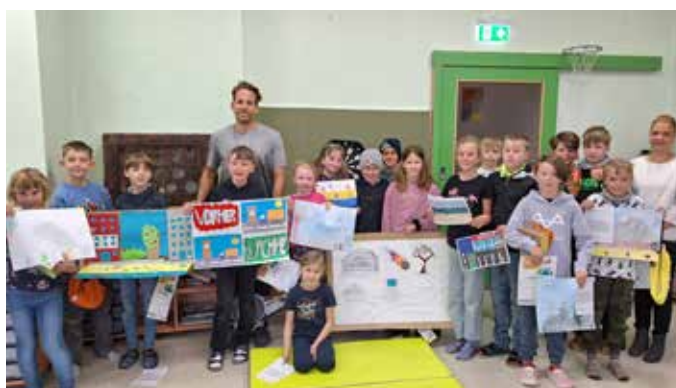
... der Volksschulen