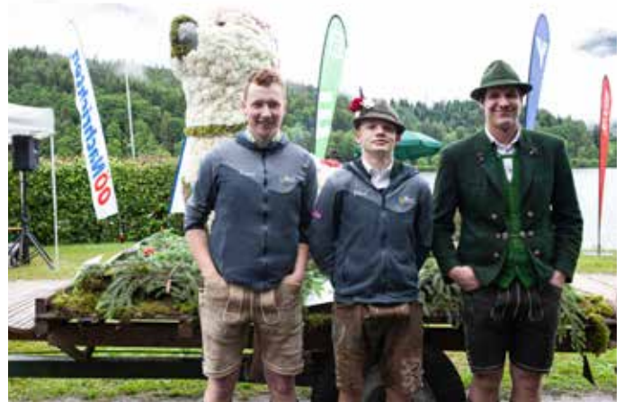
Die Landjugend Bad Mitterndorf erreichte mit ihrer Figur "Seehund" den 3. Platz in derselben Kategorie.