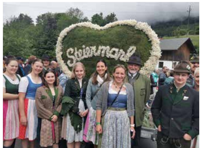
Die Landjugend Knoppen präsentierte das "Steiermark Herz" in der Kategorie Werbefigur.