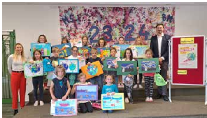
Die Sieger ...