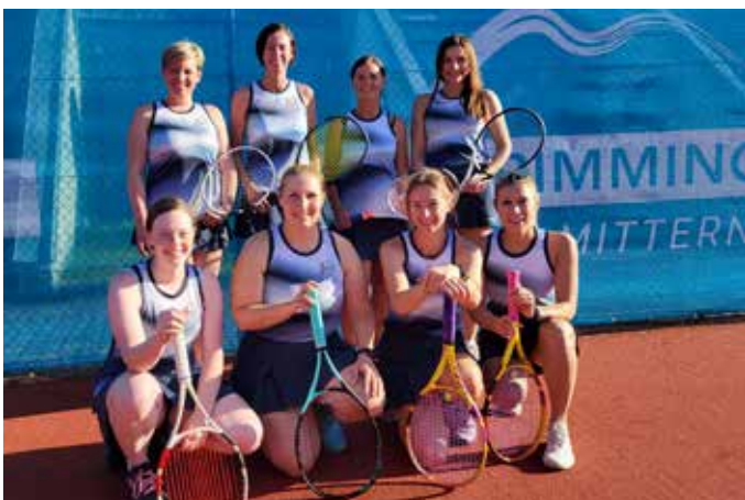
Die Damenmannschaft des TC Bad Mitterndorf zeigt sich bereit für eine erfolgreiche Tennissaison.