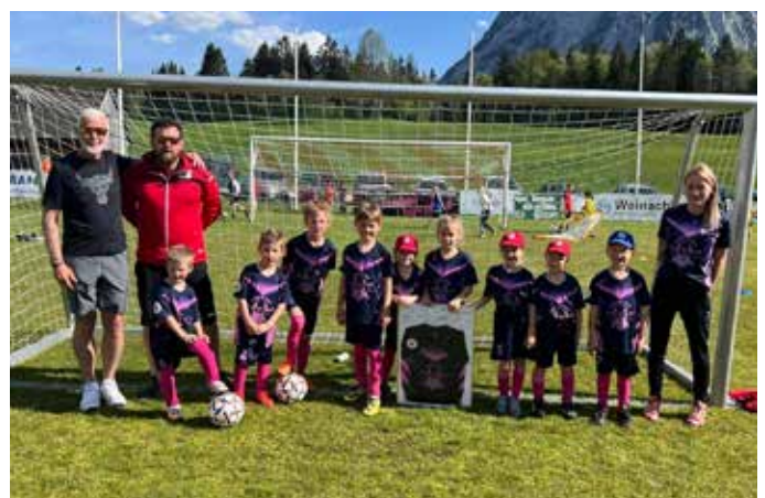
U7 – Barbershop Liezen