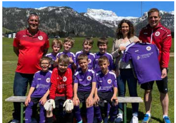
U9 – PBL Petritsch-Berger-Lasser Rechtsanwälte OG