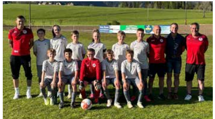
U13 – Sponsor Jürgen Stocker / Fa. Strabag