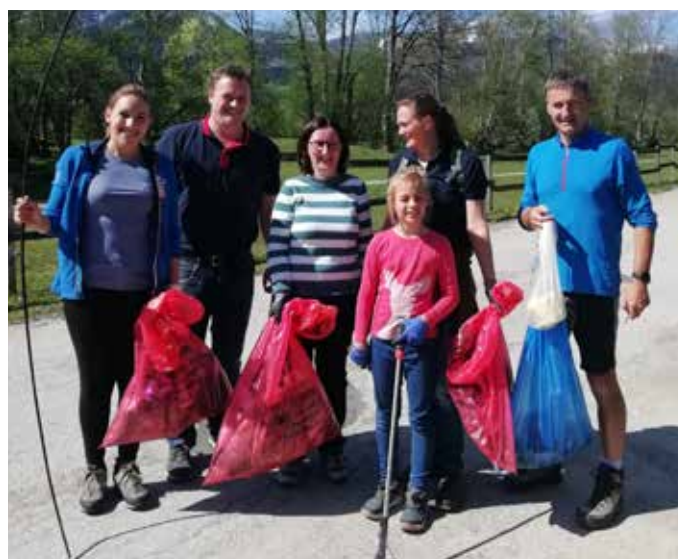
Das e5-Team organisierte die Müllsammelaktion und motivierte Bürger:innen zur Teilnahme mittels eines Gewinnspiels!

Wir möchten allen Bürger:innen danken, die sich Mitte April an unserer Reinigungsaktion beteiligt haben. Die Gewinner der Steiermark Cards und weiterer Sachpreise wurden bereits benachrichtigt. Wir gratulieren allen Gewinnern und danken allen Teilnehmern für ihren wertvollen Einsatz!