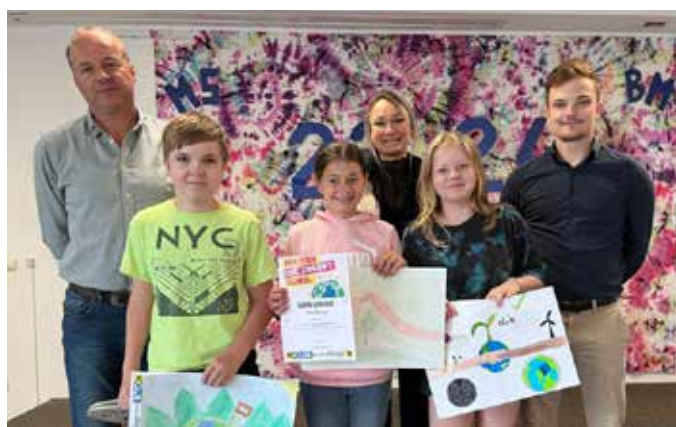
Die Sieger der 2.b-Klasse