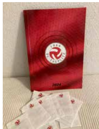
Das klebrige Highlight der Saison: das FC Tauplitz Stickeralbum!

Bei den Heimspielen in der ehrwürdigen Sturzhahnarena gab's neben der sportlichen heuer auch ein klebriges Highlight. So konnten und können im eigens designten FC Tauplitz Stickeral-