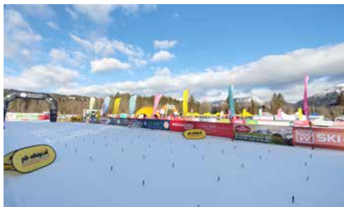
Bei den Österreichischen Schüler- und Jugendmeisterschaften herrschten brillante Bedingungen!