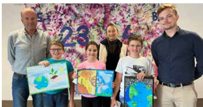
Die Sieger der 1.a-Klasse