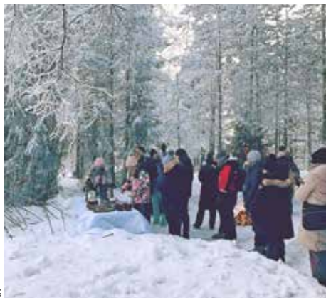
Herzliche Begrüßung durch finnische Schüler*innen.