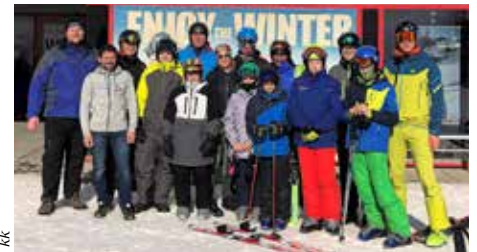
Kameraden der FF St. Lambrecht mit Geschäftsführer von Ski Grebenzen.

Das alljährliche Eisstockschießen der Feuerwehrjugend St. Lambrecht fand dieses Jahr am 5. Februar am Weirerteich statt. Eine wichtige Veranstaltung, um diese traditionelle Wintersportart nicht zu vergessen. Bei niedrigen Temperaturen und perfekter Eisfläche wurde eifrig gespielt. Wer ist der Daube am nächsten? Zentimeterarbeit, die auch mal nachgemessen werden musste. Hierbei kam der Spaß jedoch nicht zu kurz! Nach zwei Stunden kehrten die Jungeischützen ins „Setz di Nieder“ Stüberl ein, wo der Tag bei ausgezeichneter Jause einen gemütlichen Ausklang fand. SHas ■