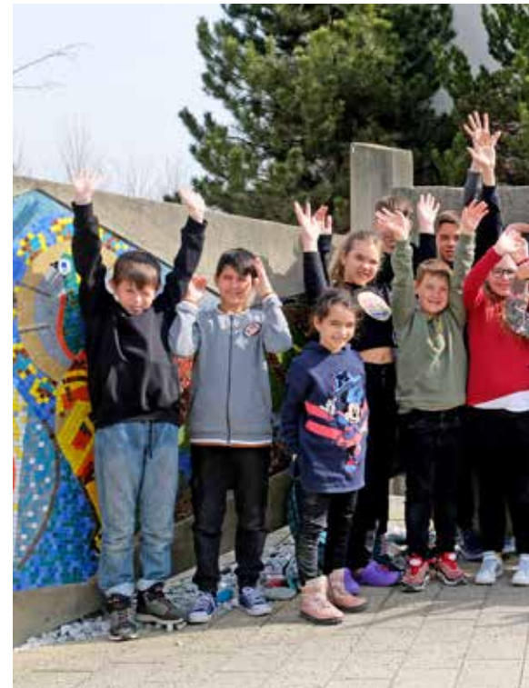
Ein geregelter Schulalltag ist dank großem Engagem...

Gemeinsame Tätigkeiten, wie hier am Sportplatz, bieten Beschäftigung und Ablenkung.