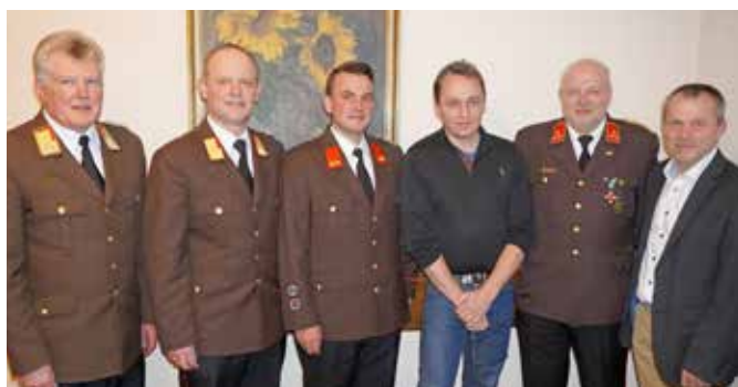
BTF Kommando mit Vertretern von Bezirksverband, Werkleitung und Gemeinde.

Außerdem bilanzierte die BTF mit 123 Zusammenkünften und 1.000 Gesamtstunden, sowie kräftiger Verstärkung durch zahlreiche neue Mitarbeiter, die auch der Betriebsfeuerwehr beigegetreten sind. SHas ■