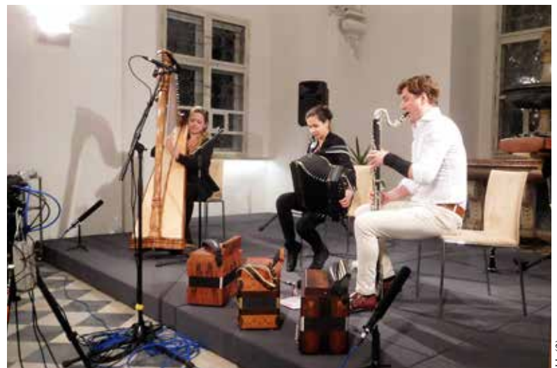
Das erste Konzert des Jeunesse-Jahres war „Diatonischen Expeditionen“ gewidmet.