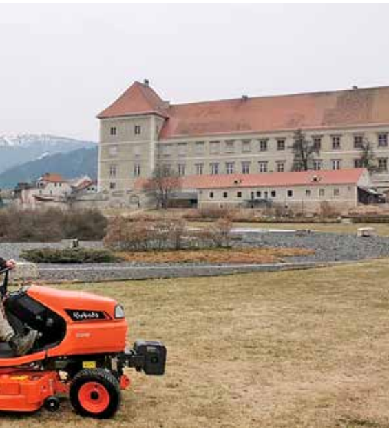
auf dem neuen Rasentraktor.