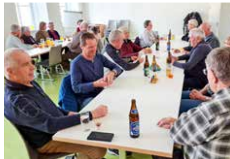
Pensionisten Verein St. Lambrecht (2)

Treffpunkt ist mittwochs ab 14 Uhr im Clublokal in der Gemeinde. ASte ■