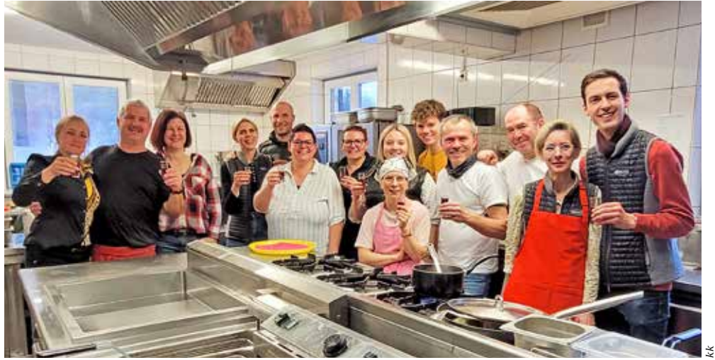
Das Grebenzenhausteam bedankt sich bei seinen Gästen für die tolle Wintersaison.