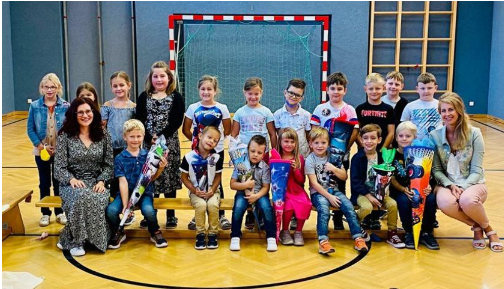
Schulbeginn VS Eltendorf