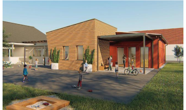
Visualisierung des geplanten Zubaus, Planer Mayfurth Martin, Rudersdorf