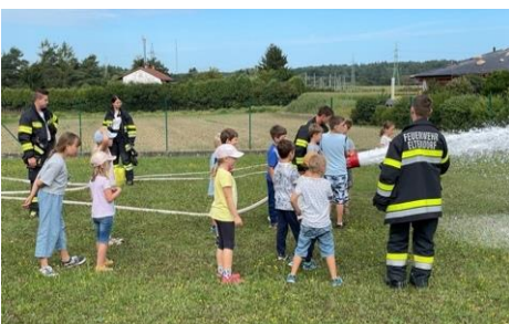
Gemeinsam mit den Kindern der Ferienbetreuung wurde auch in der Volksschule geübt.

Ich nutze die Gelegenheit und lade die Bürgerinnen und Bürger der Gemeinde Eltendorf ein, sich mit uns in der FF-Eltendorf zu engagieren. Wir können Unterstützung in allen Bereichen gebrauchen.