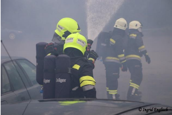
Praktische Übungen beim Tunnel-Brandbekämpfungs-Lehrgang

Das Jahr 2021 stellte die FF-Eltendorf vor große Herausforderungen. Unter Einhaltung der COVID19-Rahmenbedingungen galt es, die Einsatzbereitschaft aufrecht zu erhalten. Die Aus-, Fort- und Weiterbildung unserer Mitglieder in der eigenen Wehr war nur eingeschränkt möglich. Die FF-Eltendorf wurde als eine der Portalfeuerwehren für den S7-Tunnel Rudersdorf ausgewählt. Ferner liegt die Zuständigkeit für den S7-Tunnel