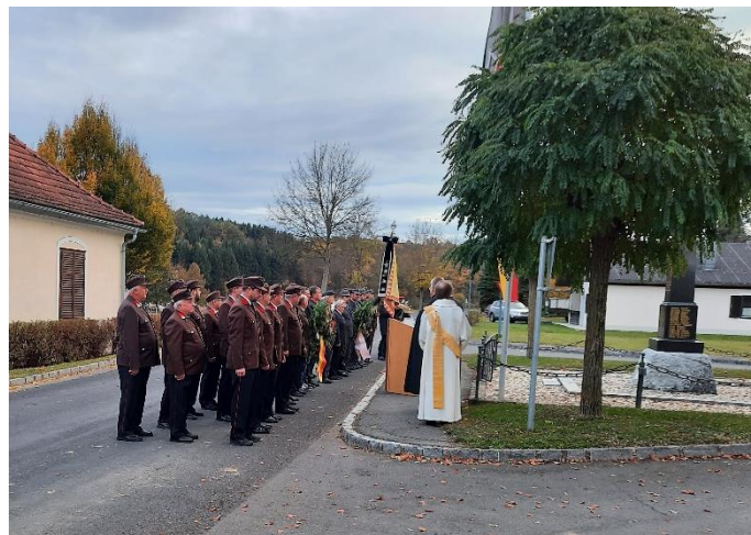
Kranzniederlegung zu Allerheiligen