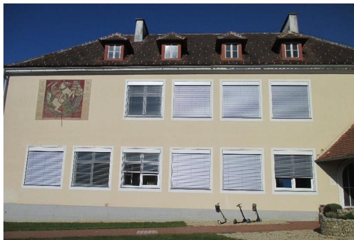
Eine neue Beschattung wurde bei der VS Eltendorf angebracht