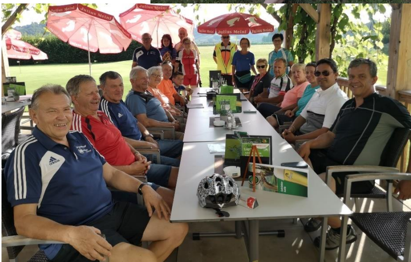
Arbeitskreistreffen am Hochkogel