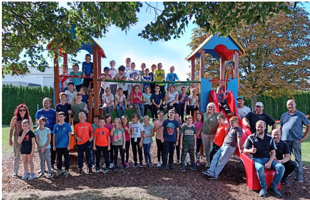
Sporttag der Volksschule Königsdorf und Eltendorf