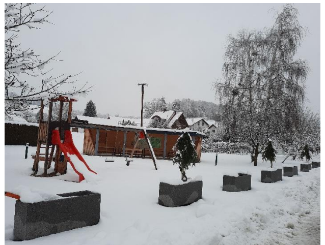
Der Dorfplatz in Zahling wurde fertiggestellt.