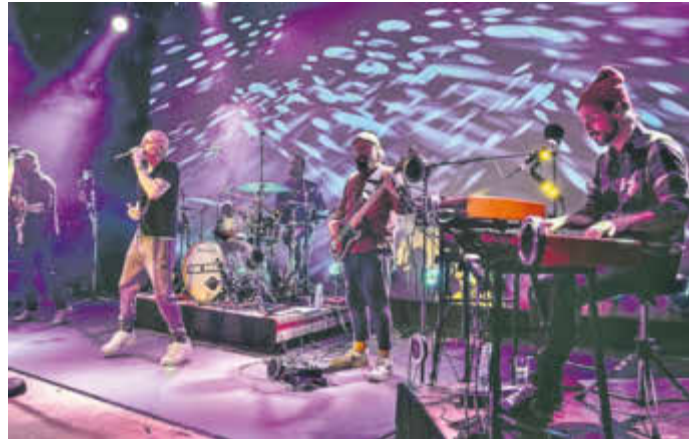
Thomas D & The KBCS spielen ein Konzert in der Messehalle Idar-Oberstein.

Am Freitag, 14. Juli, kommen Thomas D & The KBCS nach Idar-Oberstein. In Kooperation mit dem Verein Blue Note und der neu gegründeten Kulturinitiative „JAM ON!“ organisiert das Stadtjugendamt Idar-Oberstein ab 19 Uhr einen musikalischen Abend mit Jazz, Hip Hop und Rock in der Messehalle.