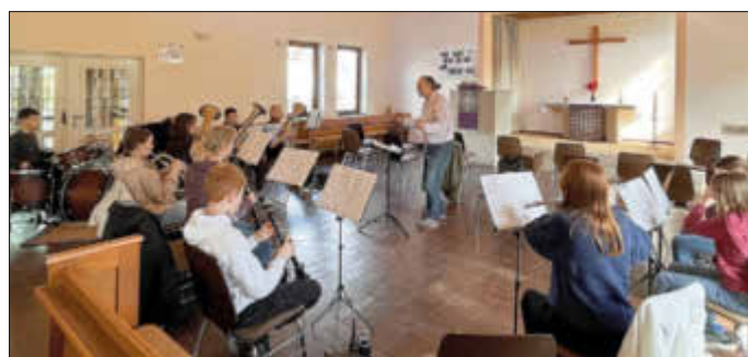
Ausweichproberaum in der ev. Kirche in Ruschberg