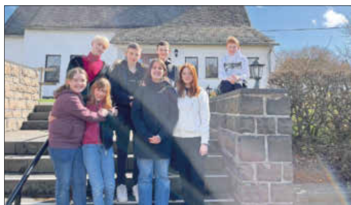
Fleißige Jungsmusiker nach der Probe