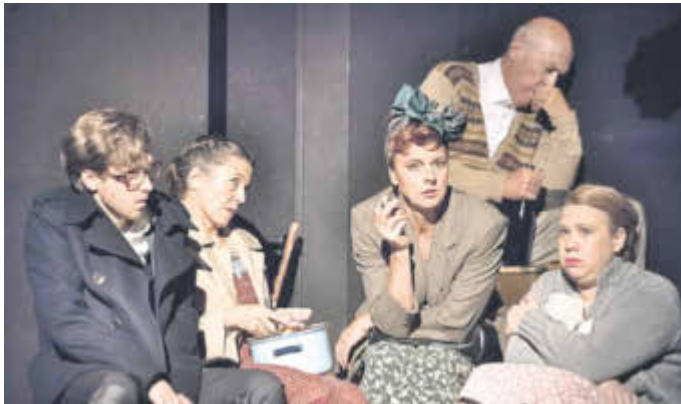
„Tadellöser & Wolff“ widmet sich der Kindheit und Jugend Walter Kempowskis in der Zeit des 2. Weltkriegs.

Im Rahmen des städtischen Theaterprogramms präsentiert das Altonaer Theater am Freitag, 14. April, um 20 Uhr im Stadttheater Idar-Oberstein das Schauspiel „Tadellöser & Wolff“. Das Stück ist der zweite Teil der Kempowski-Saga. Axel Schneider, Intendant des Altonaer Theaters, hat die neunbändige „Deutsche Chronik“ von Walter Kempowski für die Bühne bearbeitet und daraus vier Inszenierungen entwickelt. Um 19.30 Uhr findet eine Aufführung in das Stück statt.