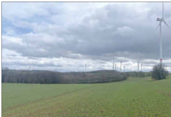
Auf dieser Ackerfläche, direkt an der Grenze zum Saarland, soll die Freiflächen-PV-Anlage errichtet werden.

Im Bereich Elektroinstallation und Aufzug lag ein Angebot vom Ingenieurbüro für Elektrotechnik Netze + Management aus Kaiserslautern vor. Der Angebotspreis beläuft sich für die erste Planungsstufe auf 7.212,26 Euro. Das Angebot wurde vom Rat unter der Bedingung angenommen, dass auch für den Bereich Heizung, Lüftung, Sanitär kurzfristig ein Planungsbüro gefunden werden kann.