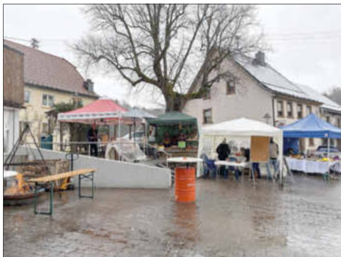
Starke Regengüsse führten Vormittags noch zu einem überschaubaren Besuch

Auch die Pateneinheit der Bundeswehr war mit von der Partie. Gemeinsam mit der Feuerwehr, dem Schützenverein und dem Sportverein wurde eine Spielstraße für Kinder aufgebaut, bei der an verschiedenen Stationen Punkte gesammelt werden konnten. Am Ende des Tages gab's dann die Siegerehrung. (gf).