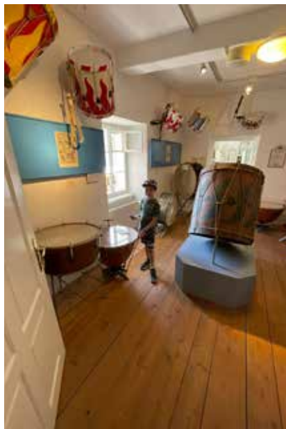
Alte Instrumente wurden in Oberwölz bewundert.

Nach diesen lustigen Ausflügen kann die TK Tauplitz mit vielen Impressionen, erholt und hochmotiviert in die musikalische Sommersaison starten und freut sich schon, Sie bei den traditionellen Donnerstags-Platzkonzerten, am Tauplitzer Dorfplatz, begrüßen zu dürfen!