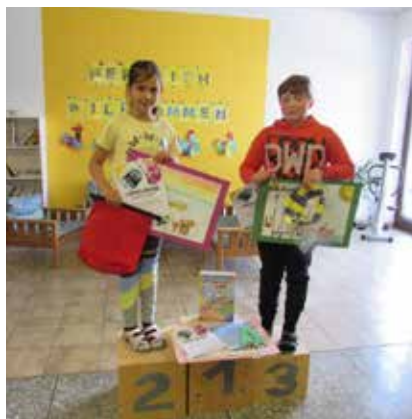
Das sind die stolzen Gewinner der VS Knoppen.