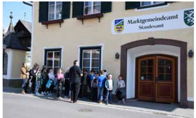
Kinder der VS besuchten die MitarbeiterInnen im Gemeindeamt. Der Bürgermeister verriet viele interessante Sachen und führte durch die Abteilungen.