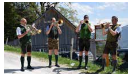
Die Strummen Musi sorgte für gute Stimmung.

Am 12. Mai wurde das von LEADER Regionalmanagement Ennstal-Ausseeerland geförderte Projekt, der „Hinterberger Panoramaweg“, auf der Lenzbauernalm eröffnet, bei herrlichem Wetter, musikalisch umrahmt durch die Strummen Musi. Der Weg verläuft 25 Kilometer entlang der Sonnenseite von Kainisch/Radling, über Knoppen, Obersdorf, die Simonywarte und Brentenmöser-Alm weiter bis nach Tauplitz unter anderem auf bereits bestehenden Wanderwegen und ist mit neuen naturbelassenen Teilabschnitten zu einer gemeinsamen Route verbunden. Entlang der Strecke vermitteln Infotafeln mit QR-Code Wissenswertes zu Natur, Kultur und Geschichte des Tales. Die Idee dazu entstammt der Hinterberger Zukunftswerkstatt.