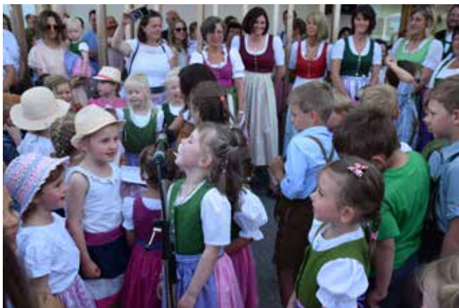
Tolle Gesangseinlage der Kinder.

erleben können. Deshalb auch der Name Kräuterkindergarten. Die Kinder haben sowohl im Garten als auch im Haus die Möglichkeit Kräuter riechen und angreifen zu können. In Folge werden diese dann auch verspeist, denn Herzstück des Gebäudes ist eine pädagogische Küche, in der täglich frisch und regional gekocht wird.