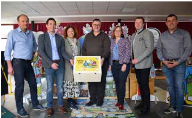
Die Wanderausstellung Klimaversum war zu Gast in Bad Mitterndorf. Hier ein Foto der Eröffnungsfeier.