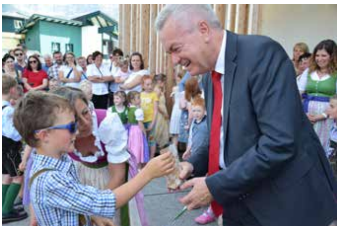
Die Ehrengäste erhielten etwas Selbstgebasteltes.