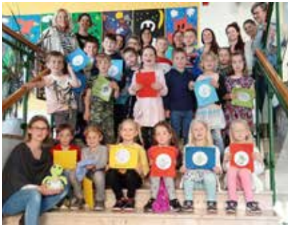
Die Vorfreude auf den Schulanfang ist groß.

In diesem Schuljahr ließ es die Coronasituation erstmals wieder zu, dass ein gemeinsamer Nachmittag für alle SchulanfängerInnen stattfinden durfte. Die Kinder konnten in Gruppen 4 Stationen durchlaufen, in denen sie spielerisch ihre bereits vorhandenen schulischen Fertigkeiten zeigen konnten. Eine Jause durfte natürlich auch nicht fehlen. Die Kinder und alle Kolleginnen der VS Bad Mitterndorf hatten viel Spaß dabei.