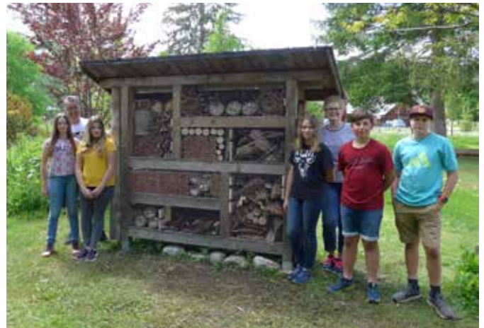
Stolz auf das fertige Projekt für Wildbienen und Hummeln.