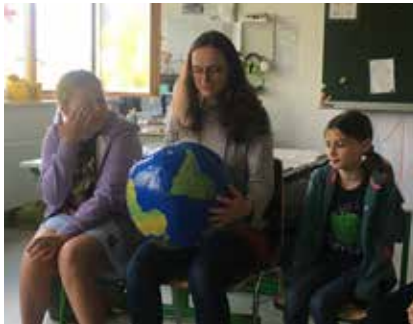
Bewusst werden: wir gestalten unsere Welt selbst.

Durch tägliche Medienberichte über die Klimakrise sensibilisiert, befassten sich die Kinder der 4.a Klasse im Rahmen des Sachunterrichts mit dem Thema Umwelt- und Klimaschutz. Denise Sprung vom UBZ des Landes Steiermark erarbeitete mit den Buben und Mädchen Möglichkeiten, die ökologische Belastung in den vier Bereichen Konsum, Ernährung, Mobilität und Wohnen möglichst gering zu halten. Leitgedanke dieses Projekttages war, die Kinder zu ermutigen, sich selbst als GestalterInnen ihrer Umwelt und damit ihrer eigenen Zukunft zu begreifen. Um es mit Greta Thunberg zu sagen: „Man ist nie zu klein, um einen Unterschied zu machen.“