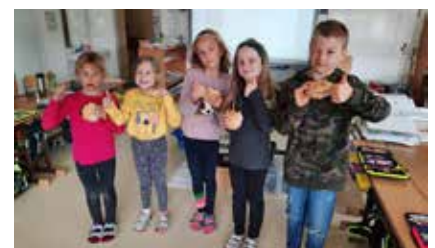
Die wohlverdiente Jause.