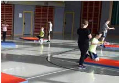
Beim Üben in der Turnhalle.

Die SchülerInnen der VS Bad Mitterndorf und VS Tauplitz konnten in diesem Schuljahr ein Falltraining, organisiert durch die AUVA absolvieren. In 3 Einheiten wurden ihnen Techniken zum richtigen Fallen bei sportlichen Aktivitäten, wie zum Beispiel Inlineskaten gezeigt.