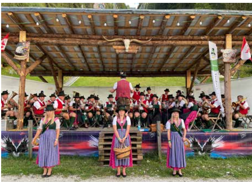
Auch in den Sommermonaten ist am Kulm immer was los.