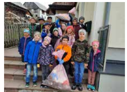
Auch in Tauplitz waren die Kids unterwegs.