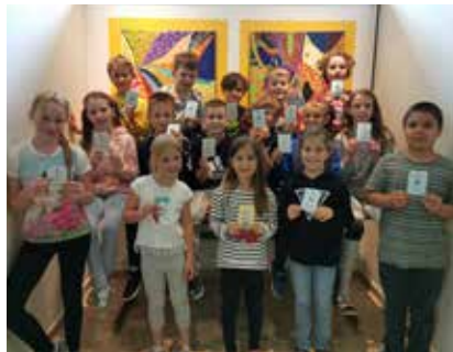
Die stolzen Schwimmabzeichen-BesitzerInnen.

Die Kinder der beiden 4. Klassen sowie jene der 2.a Klasse absolvierten ihre Schwimmprüfungen mit Bravour. Ob Früh-, Frei- oder Fahrtenschwimmer, alle Kinder waren mit großem Eifer an diesem besonderen Sportunterricht dabei.