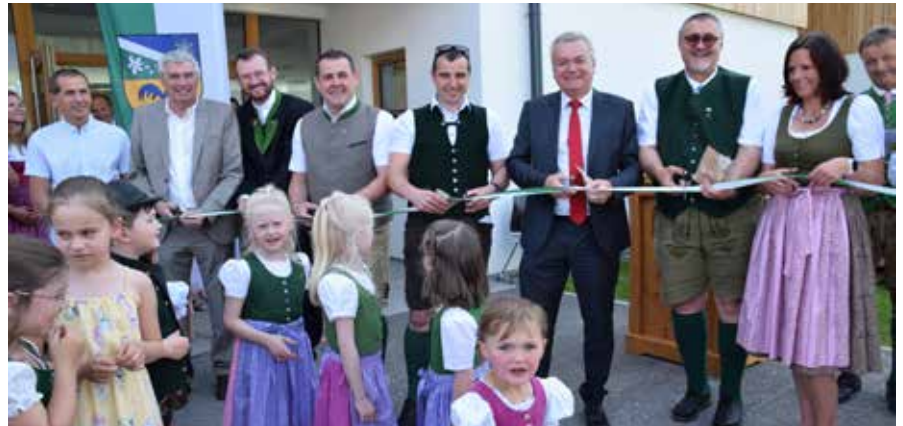
Symbolisch wurde ein Band durchgeschnitten.

Die Gemeinde war gefordert die Kinderbetreuung an die Arbeitsrealität der Eltern anzupassen und Betreuung ab dem ersten Lebensjahr sowie am Nachmittag anzubieten. Mit dem Bau des Kräuterkindergartens, für den die Wohnbaugruppe Ennstal als Bauträger fungiert, wurde dies ermöglicht. Der Bürgermeister betonte aber auch, dass es nicht Ziel sei, die Kinderbetreuung in Bad Mitterndorf zu zentralisieren, wurde doch im Vorfeld der Kindergar-