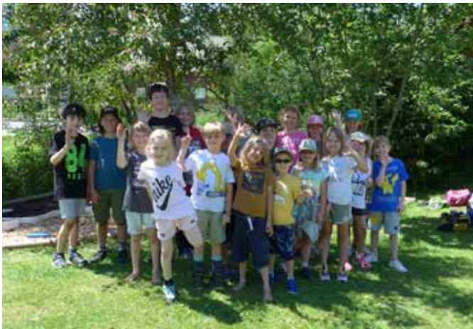
Die Kids der Montessorischule.