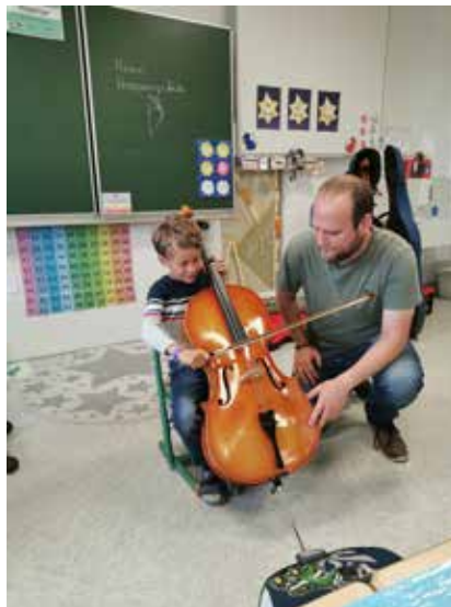
Spaß beim Ausprobieren des Instruments.

Auf Initiative der Musikschule Bad Aussee, hatten die SchülerInnen der 2. – 4. Schulstufe der VS Bad Mitterndorf die Möglichkeit ein, für die meisten, eher unbekanntes Instrument kennen zu lernen. Neben theoretischem Input kam aber auch das Praktische nicht zu kurz. Die Kinder konnten das Instrument auch selber ausprobieren.