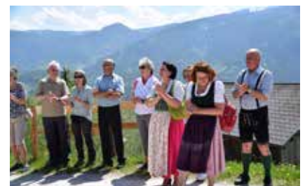
Bei der feierlichen Eröffnung des Weges.