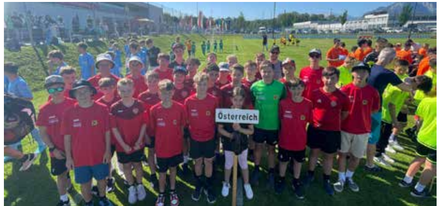
Die Jungs des ASV bei der Mozart Trophy.

Die Gegner der U 15 kamen aus Tschechien, Deutschland, Österreich und Italien. Einige waren Landesmeister in den je-