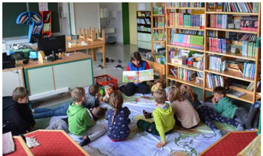
Bei der Lesung des Kinderbuches.

Das Kinderbuch ist Bestandteil der vom Lesezentrum Steiermark und der steirischen Ludothek Ludovico zusammengestellten KlimaKiste, die den steirischen Bibliotheken für die Dauer von ca. 5-6 Wochen zur Durchsicht und zum Verleih zur Verfügung gestellt wird. Das Land Steiermark, das Klimabündnis und die Marktgemeinde Bad Mitterndorf brachten die Wanderausstellung „Klimaversum“ in die Aula der MS Bad Mitterndorf. Die KlimaKiste stand dann für 5 Wochen den beiden Schulbibliotheken zum