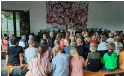
Aufmerksame Kids bei der Lesung in der Aula.