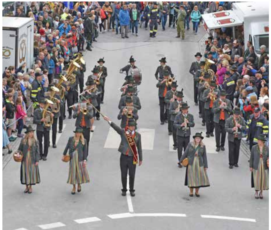
Die Kapelle beim Sternmarsch in Bad Aussee.

Die diesjährige Florianifeier wurde von der FF Obersdorf ausgerichtet. Die MK Kumitz war natürlich mit dabei und gratulierte dem neu gewählten Kommando. Im Probelokal fand ein Schnuppertag für die VolksschülerInnen statt. Den Kindern wurde das Vereinsleben nähergebracht, es wurden sämtliche Musikinstrumente vorgestellt und konnten auch probiert werden. Zurzeit