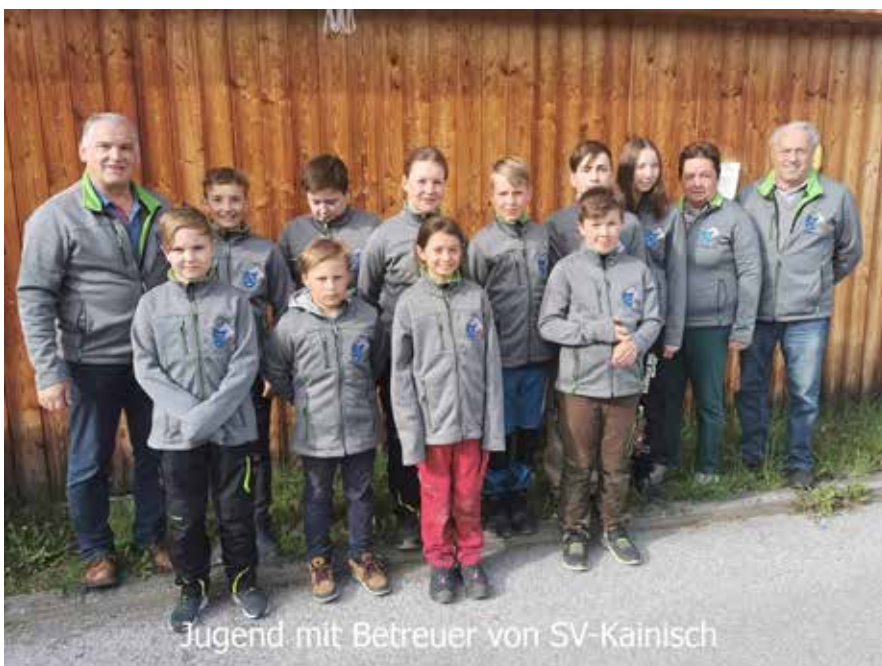
Jugend mit Betreuer von SV-Kainisch