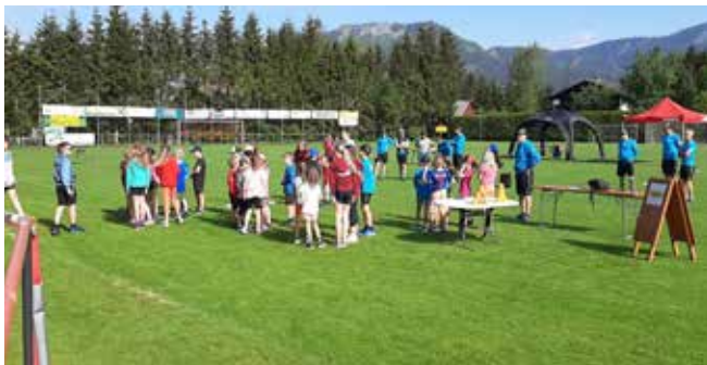
Beweg dich schlau Challenge am Fußballplatz.

rische Art einiges abverlangt, ohne dass sie total ausgepowert werden. Ziel ist es, Kinder für den Sport nachhaltig zu begeistern. Wer sich bereits als Kind regelmäßig bewegt, macht das mit großer Wahrscheinlichkeit auch im Erwachsenenalter und sorgt so für einen dauerhaft gesunden Lebensstil. Durch die Durchführung der Übungen sollen sie weniger gestresst und wesentlich aufnahmefähiger sein.