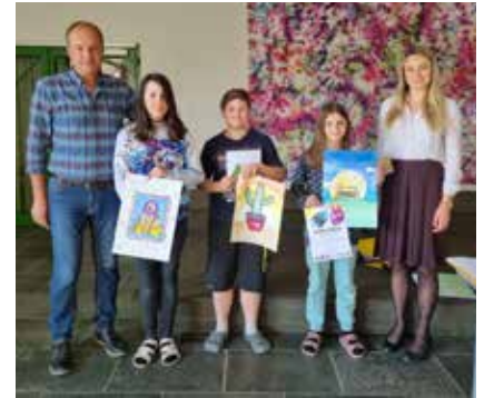
Auch die MS Bad Mitterndorf nahm am Zeichenwettbewerb teil. Hier die Gewinner bei der Preisübergabe in der Aula.