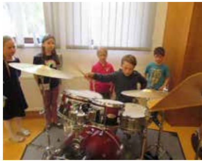
Talente kamen zum Vorschein.