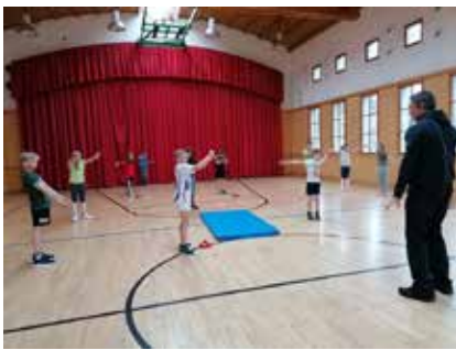
Auch richtig fallen will gelernt sein.

Auch die Volksschule Knoppen war im Rahmen der Aktion „Sichere Schule“ dabei. Diese wertvolle Aktion stärkt auch das Selbstbewusstsein und das Selbstvertrauen der Kinder. Sie hatten großen Spaß dabei.