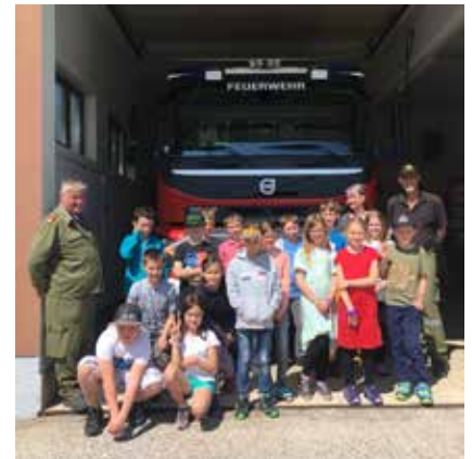
Ein spannender Ausflug zur Feuerwehr.