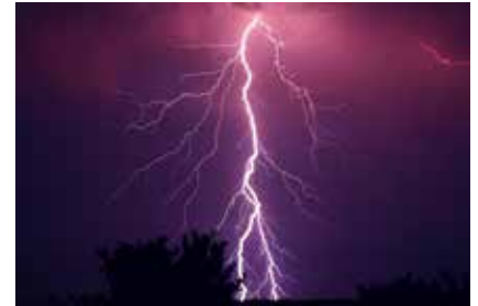
Wetterextreme sind keine Seltenheit mehr.