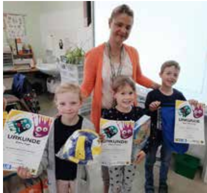
Die glücklichen Gewinnergesichter der VS Tauplitz.

Raiffeisenbank eine Reihung der Bilder vorzunehmen, was bei der Auswahl an Kunstwerken nicht einfach war.