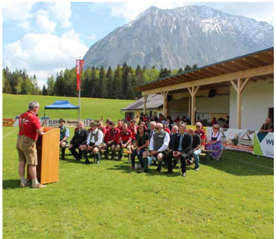
Eröffnungsfeier in der Sturtzhahnarena.

Die TrainerInnen nahmen in der Frühjahrssaison wieder an zahlreichen Turnieren teil.