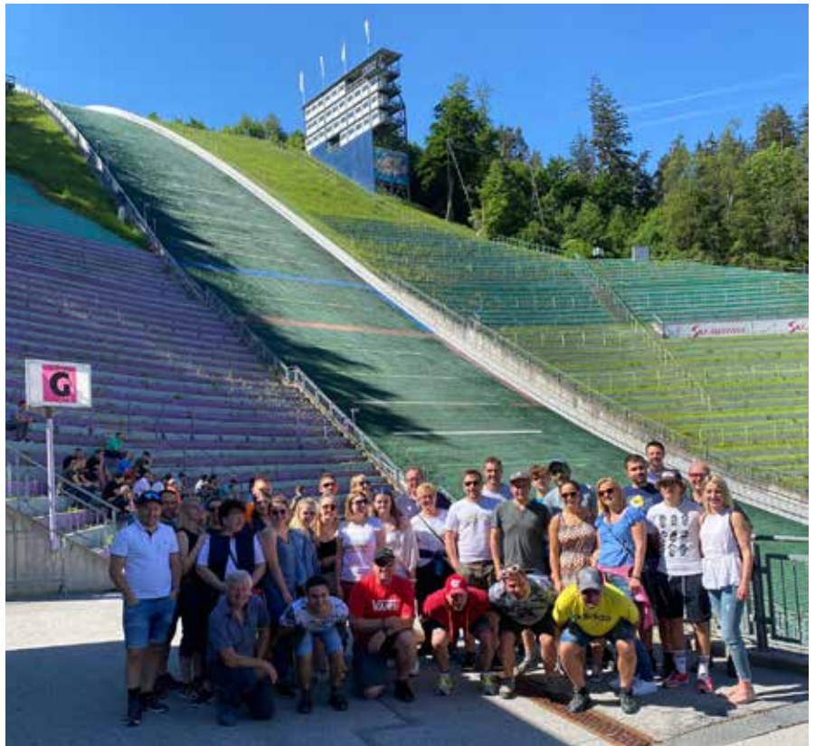
Die TK Tauplitz vor der Bergisel Schanze.

Die MusikerInnen der Trachtenkapelle konnten endlich ihren schon lang geplanten Ausflug nach Innsbruck antreten. Drei Tage verbrachten sie im schönen Tiroler Land und besuchten dort die verschiedensten Ausflugsziele. Am ersten Tag führte sie die Tour, nach einem reichhaltigen Frühstück in Bruck an der Glocknerstraße, über den Paß Thurn nach Wattens. Dort wurden die Swarovski Kristallwelten besichtigt. Den Abend ließen die Tauplitzer dann in der Innsbrucker Innenstadt ausklingen. Der zweite Tag startete mit einer Führung auf der berühmten Bergisel Schanze. Dort trafen sie den ehemaligen Cheftrainer des österreichischen Skisprung-Nationalteams Alexander Pointner. Bei einer anschließenden Stadtführung erfuhren die Musikanten viele geschichtliche Details über die Stadt Innsbruck. Einige verschlug es dann auf die Hafelkarspitze auf 2334m. Im Zuge der Rückreise am dritten Tag fuhren sie mit einem Schiff über den Achensee, bestaunten den großen Ahornboden und wanderten in die Engalm zu einer Schaukäserei, ehe die sie abends wieder zu Hause in Tauplitz ankamen.