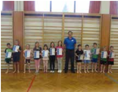
Nach dem Falltraining gab es für alle eine Urkunde.

Auch die Volksschule Knoppen war im Rahmen der Aktion „Sichere Schule“ dabei. Diese wertvolle Aktion stärkt auch das Selbstbewusstsein und das Selbstvertrauen der Kinder. Sie hatten großen Spaß dabei.