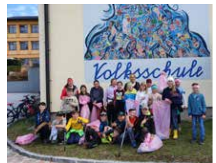
Die fleißigen MüllsammlerInnen der VS Bad Mitterndorf.

Wie jedes Jahr nahmen die Volksschulen Bad Mitterndorf und Tauplitz auch heuer am Frühjahrsputz teil. So konnten sie wieder einen wichtigen Beitrag zum Allgemeinwohl in ihrer Gemeinde beitragen. Ein großes Dankeschön an die Kinder, die daran teilgenommen haben und an die Gemeinde für die Jause.