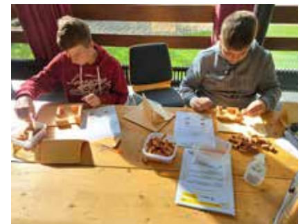
Bei einer Station gings ums Bauen.

schaft. Unter anderem erklärten die anwesenden Personen den Kids, was bei ihrem Beruf Sache ist. Es wurden Cocktails gemixt, Gipse angelegt, Möbelstücke vermessen, Minihäuser gebaut uvm. Dieser kleine Einblick brachte wieder etwas Klarheit in die Köpfe der Schüler und alle zeigten große Freude daran.