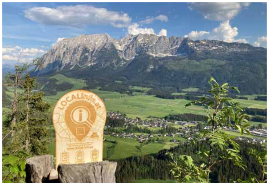
Hiermit können Sie bequem viele Infos rund um Bad Mitterndorf finden.

Wer kennt das nicht: Wohin können wir Essen gehen? Wann fährt der nächste Bus? Diese und weitere Fragen können jetzt ganz schnell und einfach beantwortet werden. LOCAL Info.at hat viele Informationen rund um das Ausseerland für Einheimische und Gäste zusammengefasst und stellt diese digital zur Verfügung. Zu den Infos gelangen Sie ganz leicht, indem