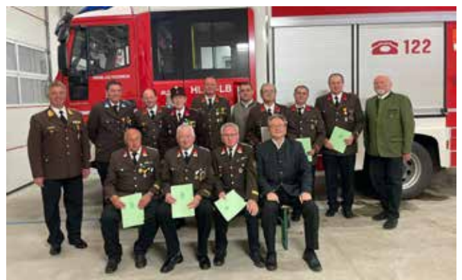
Wehrversammlung und Ehrungen bei der FF Zauchen – wir gratulieren allen Geehrten und Beförderten!