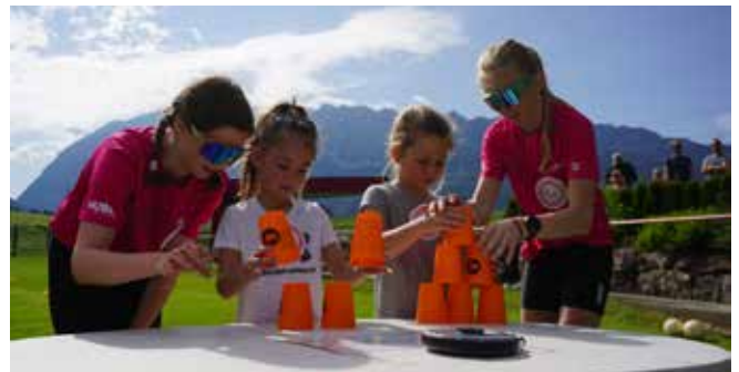
Schnelligkeit und Geschicklichkeit waren hier beim „Stacking“ gefragt.