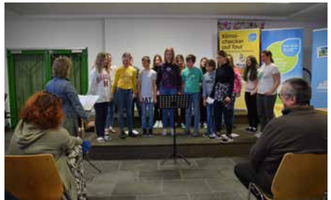
Tolle Gesangseinlage bei der Eröffnungsfeier für „Klimaversum“.