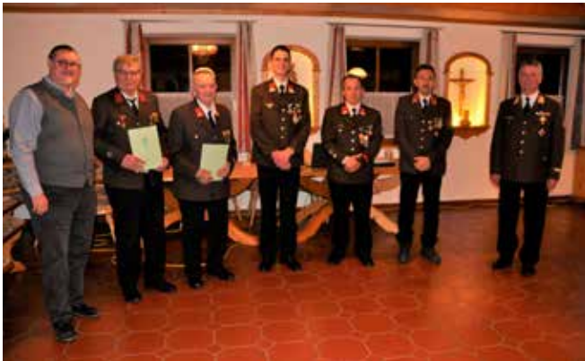
Bei der Wehrversammlung der FF Bad Mitterndorf – Geehrte und der neu gewählte Kommandant und sein Stellvertreter. Wir gratulieren recht herzlich!