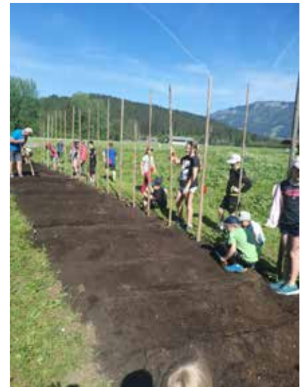
Der vorbereitete Acker wird bepflanzt.

mit der kommenden 3. Klasse zu ernten. Die Tontafeln, mit den Namen der Kinder darauf, stellten sie selber im Werkunterricht her. Die Schule bedankt sich beim Einachser-Verein für die Bemühungen und Vorbereitungen.