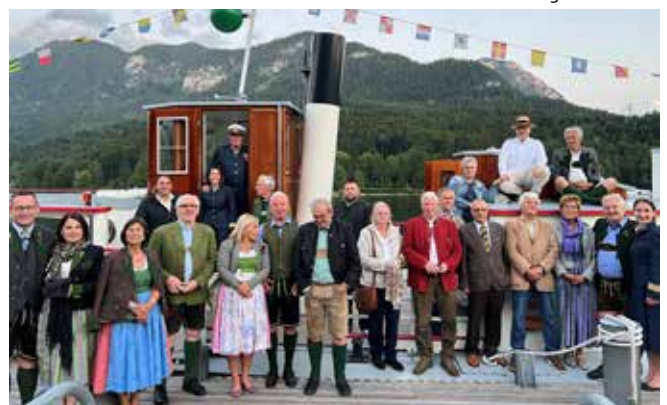
Rotary und Lions Ausseerland begaben sich auf gemeinsame Seefahrt am Grundlsee. Interessante Geschichten zur Schifffahrt wurden erzählt und gemeinsame Bände gestärkt.