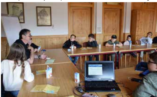
Bei der Kinder-Gemeinderatssitzung wurde diskutiert, ob die Sommerferien verkürzt werden sollen. Man war sich übrigens einig, dies nicht zu tun.