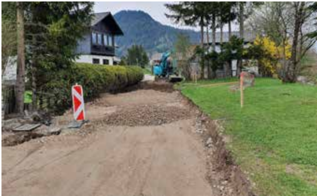
Entlang der „Ungarischstraße“.