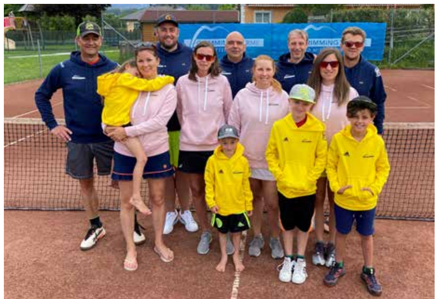
Stolz werden die neuen Vereins-Hoodies präsentiert.

war, wurde das Niveau gleich sehr hoch und stieg also zusammen mit der Begeisterung an. 22 Damen-Teams kämpfen in individuell vereinbarten Spielen um den Titel. Der TC GrimmingTherme Bad Mitterndorf bietet dazu mit dem Kinder- und Jugendtraining und dem Tennisshop ein rundum-Paket an, das es ermöglicht eine so gesellige und körperlich anspruchsvolle Sportart ohne Probleme und weite Wege direkt im Ortszentrum durchzuführen. Alle sind willkommen.