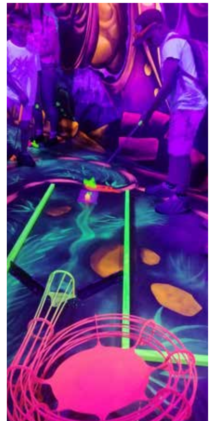
Minigolf mal anders.

Nach diesen lustigen Ausflügen kann die TK Tauplitz mit vielen Impressionen, erholt und hochmotiviert in die musikalische Sommersaison starten und freut sich schon, Sie bei den traditionellen Donnerstags-Platzkonzerten, am Tauplitzer Dorfplatz, begrüßen zu dürfen!