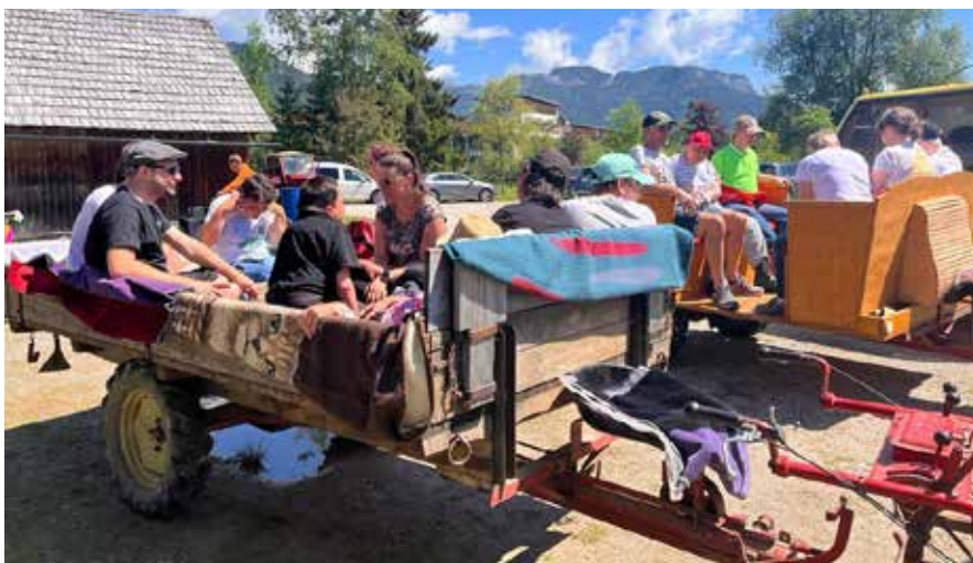
Ein unvergesslicher Tag für die Lebenshilfe.

Der Einachser-Club Bad Mitterndorf hat alle KlientInnen und BetreuerInnen der Tageswerkstätte Plaisirgasse zu einem launigen Stelldichein geladen.