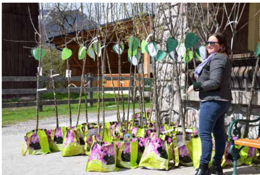
Für jedes Neugeborene ein Bäumchen.

nextperte Klaus Strassegger gab einen Einblick in das Thema „digital:total“ Risiken im Handy- und Internetalltag“. Der Umgang mit sozialen Medien, dem Internet allgemein, stellt für Kinder eine oft unterschätzte Gefahr dar. Zur Sprache kamen Risiken wie Online Betrug oder „Cyber Mobbing“, welche durch diesen Vortrag ins Bewusstsein gerufen wurden. Der Vortrag wurde von der Gemeinde finanziert und ich bedanke mich stellvertretend bei allen Eltern, die an der Veranstaltung teilgenommen haben.