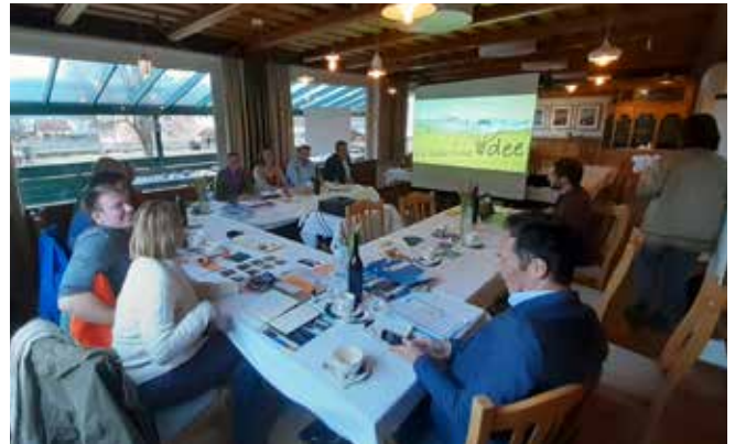
Das Bad Mitterndorfer „e5-Gemeinde“ Team bespricht Pläne und Ideen für die energieeffiziente Zukunft der Großgemeinde.