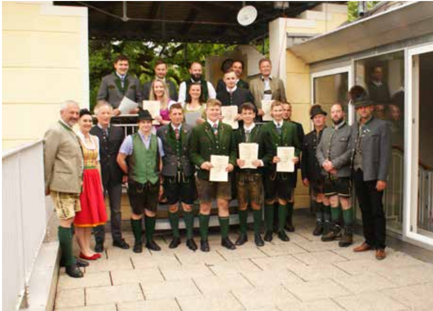
Die JungjägerInnen mit den PrüferInnen und Vortragenden.

Ausbildungskurse für die steirische Jägerprüfung erfahren einen großen Andrang. Auch in Bad Mitterndorf wurde ein Kurs angeboten, ein weiterer wird folgen.