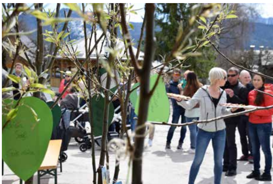
Bei der nett gestalteten Übergabe im Kurpark.