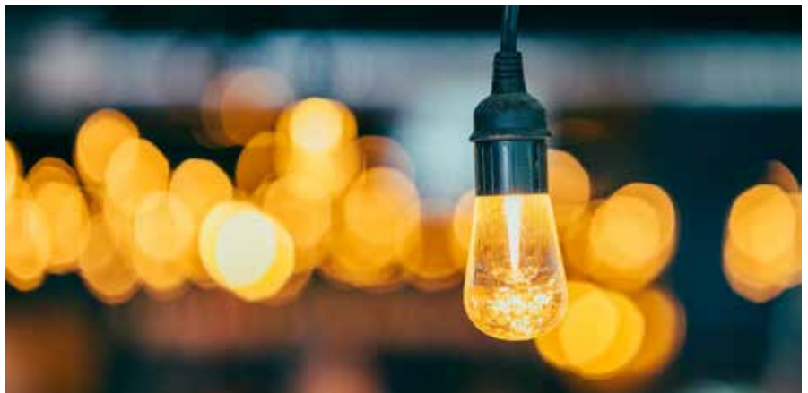
Strom wird teurer, aber wie setzt sich der Preis eigentlich zusammen?