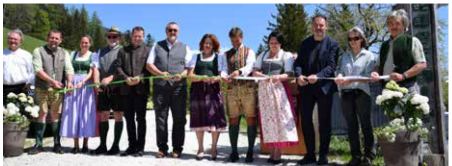
Die Ehrengäste beim Durchschneiden des Bandes.

Bad Mitterndorf verfügt über ein neues Leaderprojekt: Eine quer durch das „Hinterbergertal“ verlaufende Wanderroute, die eine schöne Aussicht verspricht.