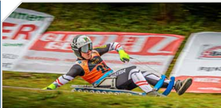
Rollenrodeln - die Sommervariante des Naturbahnrodelns.