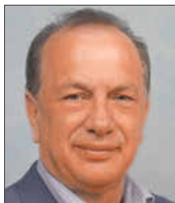
Hans Jürgen Noss, MdB