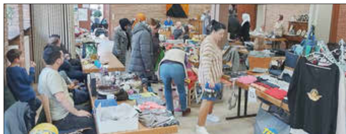
Viele Interessierte und ein interessantes Angebot gab es beim Familienflohmarkt im vergangenen Jahr.

Das Quartiersmanagement der Sozialen Stadt veranstaltet mit Unterstützung des Begegnungscafés am Samstag, 15. Februar 2025, von 10 bis 12 Uhr im Pfarrsaal der katholischen Kirche St. Walburga im Heckweg 9 einen Familien-Flohmarkt. Verkauft werden gebrauchte Waren des täglichen Bedarfs, also gut erhaltene Kleidung und Schuhe (für Babys, Kinder und Erwachsene), gut erhaltene Spielsachen, Bücher, Haushalts- und Dekowaren und ähnliches. Bewohner aus dem Quartier sowie aus dem gesamten Stadtgebiet haben die Möglichkeit, bei Tee, Kaffee und einem Stück Kuchen gemütlich vorbei an den Ständen zu schlendern und eventuell das ein oder andere Fundstück zu erwerben.