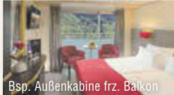
Bsp. Außenkabine frz. Balkon

KREUZFAHRTEN eine Marke von ReisenAKTUELL.COM