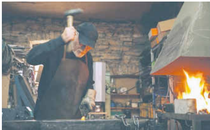
Bei der Tour können die Teilnehmer unter anderem einem Schmied bei der Arbeit zuschauen.

Die Tage werden kürzer, die gemütlichen Abende länger – wie wäre es jetzt mit einer geführten Tour durch die dämmerigen Gassen Herrsteins? Im Licht von Fackeln, die tanzende Schatten an Wände werfen, durch die mittelalterlichen kopfsteingepflasterten Gassen spazieren und die wunderschönen Fachwerkhäuser betrachten. Spannenden Mittelalter-Geschichten aus der bewegten Vergangenheit des Örtchens lauschen und dunkle Wehgänge und Verliese erkunden. Und dann noch in der historischen Dorfschmiede dem Schmied zuschauen, wie er glühendes Metall nach alter Tradition verarbeitet und seine wunderschönen, handgefertigten Werkzeuge bestaunen.