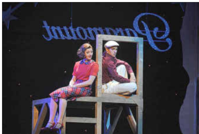
Szenenfoto aus „Endstation Sehnsucht“

Anmeldungen und Informationen bei der Volkshochschule Baumholder, Hauptstr. 10, 55774 Baumholder, Telefon: 06783 4063, Mail: vhsbaumholder@gmx.de