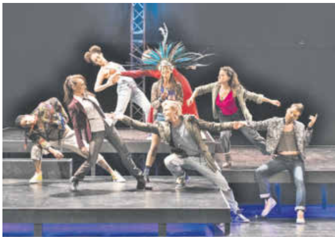
Das Musical „Hair“ ist ein Happening voller Lebensbejahung, Aufbruchsstimmung und Musik.

Am Samstag, 22. Oktober, um 20 Uhr präsentiert das Altonaer Theater im Stadttheater Idar-Oberstein das Musical „Hair“. Es spielt Ende der 60er Jahre in den USA: In Vietnam herrscht Krieg, wehrpflichtige Amerikaner werden eingezogen, junge Menschen (heute nennen wir sie Hippies) protestieren und suchen abseits etablierter Bürgerlichkeit und in Opposition zum Staatsapparat nach einem anderen, friedvolleren Leben ohne Krieg, Gewalt und Rassismus. Vor diesem Hintergrund entsteht „Hair“ und wird zum Kult: der Traum von einem neuen Zeitalter.