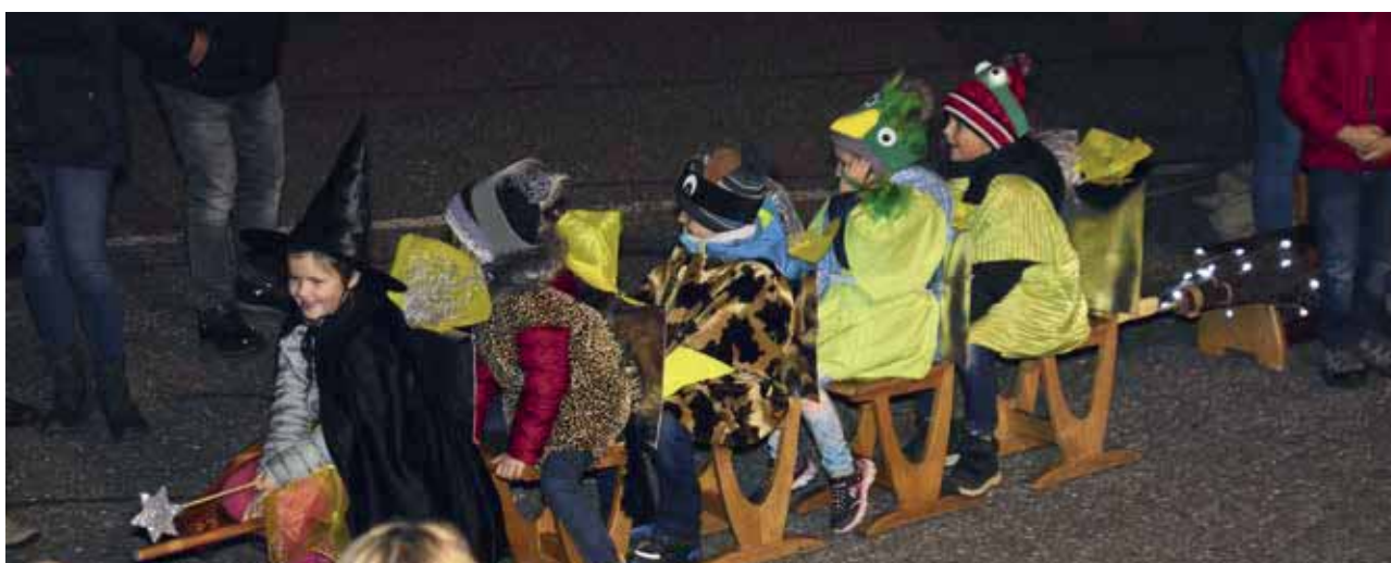
Hexe Annabell – Für Hund und Katz ist auch noch Platz!

Vielen Dank an alle Eltern für Ihre Mithilfe und das köstliche Buffet!