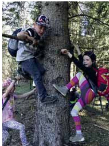
Wald- und Wiesentag: Schau wo ich bin!

Durch das Erproben fein – und grobmotorischer Fertigkeiten entwickeln sie ihr Körpergefühl und Körperbewusstsein kontinuierlich weiter.“