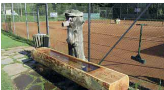
Neuer Brunnen Tennisplatz