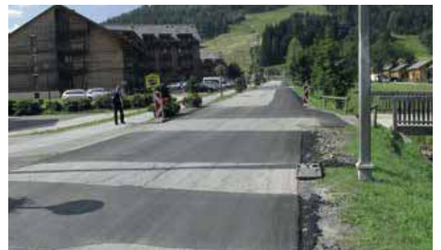
Kreischbergstraße Plombensanierung Asphaltdecke vor DDK