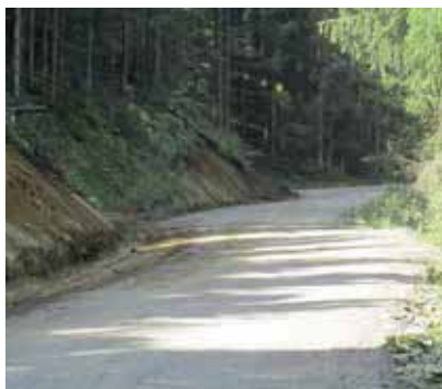
Hinterer Kotschildergrabenweg Straßenbegradigung