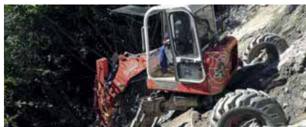
Zielberg Behebung Unwetterschäden