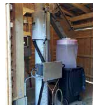
Kläranlage Allgau Siebschnecke