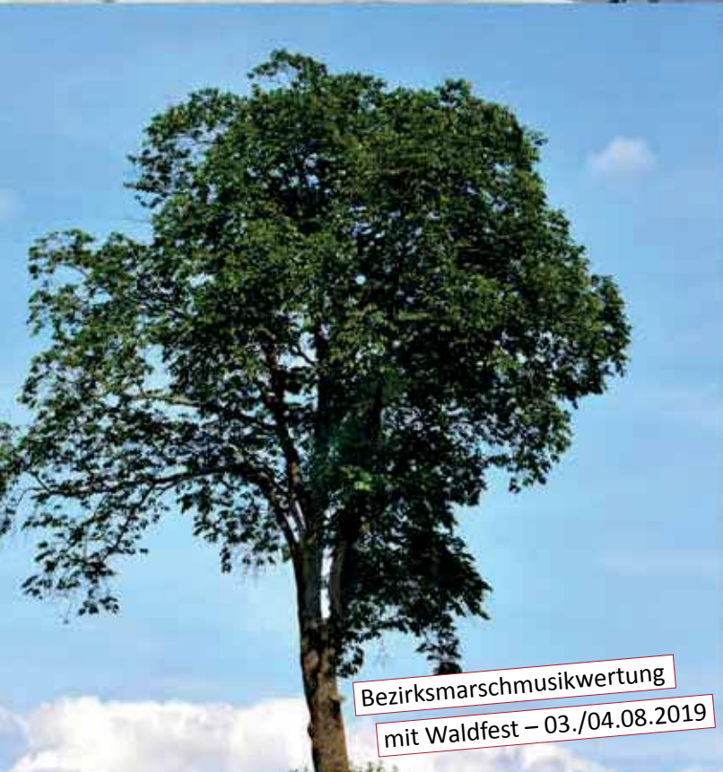
Bezirksmarschmusikwertung mit Waldfest – 03./04.08.2019