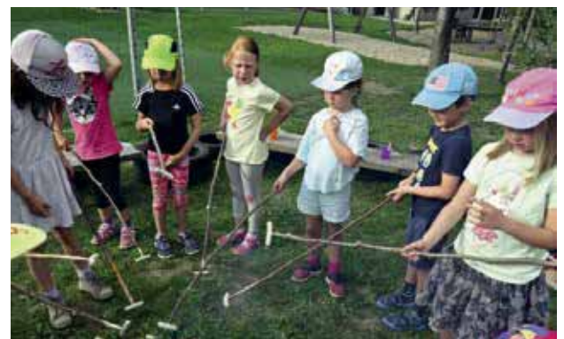
Palmbesen binden mit der 4. Klasse