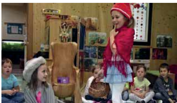
Rotkäppchen und der böse Wolf

„Sprache ist die Grundlage für die Gestaltung sozialer Beziehungen. Sprache ist notwendig, um Gefühle und Eindrücke in Worte zu fassen und damit sich selbst und andere zu verstehen.“