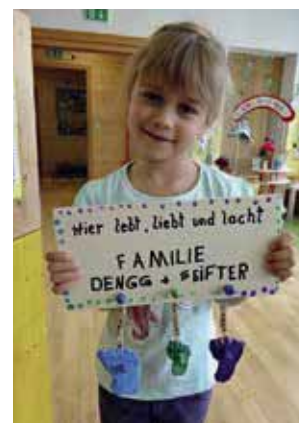
Alles Gute zum Muttertag!

„Werte stellen die Grundlage für Normen und Handeln dar. Kinder erfahren Werte in der Auseinandersetzung mit ihrer Umwelt und gewinnen dadurch Orientierung für ihr eigenes Denken und Handeln. Unterschiede in einer Gruppe können zu einer interessanten Auseinandersetzung führen und als Basis für ein respektvolles Miteinander genutzt werden.“