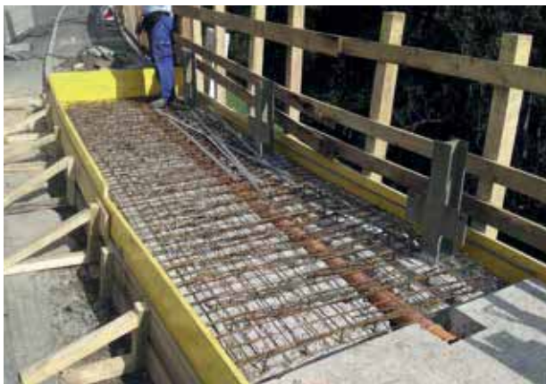
Holzeuropabrücke Betonsanierung Randbalken