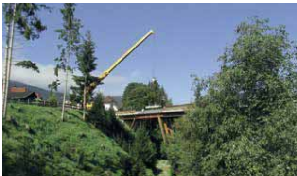
Kreischbergstraße Holzeuropabrücke Randbalken herausheben