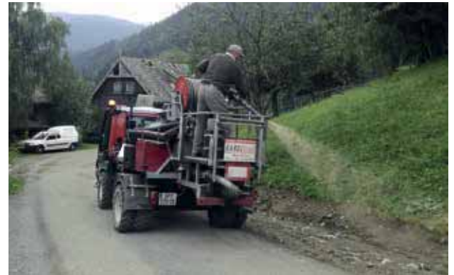
Hinterer Kotschildergrabenweg Spitzbegrünung