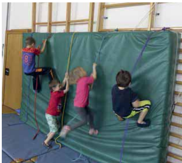
Rapunzelturm – Klettern