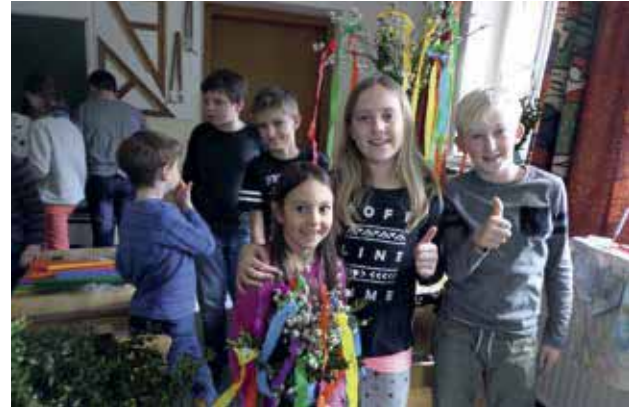
Die Schulanfänger übernachten im Kiga.