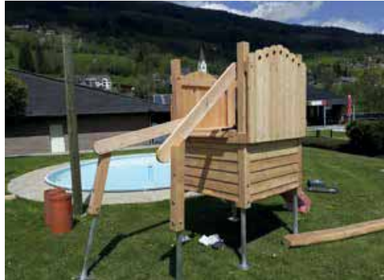
Freibad St.Lorenzen, Neue Spielgeräte