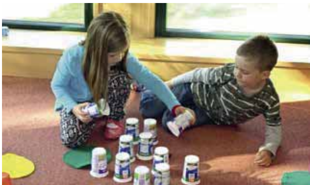
Partnerspiel – Memory