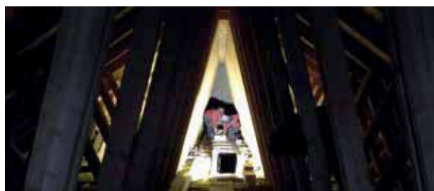
Volksschule Turnsaal Deckendämmung