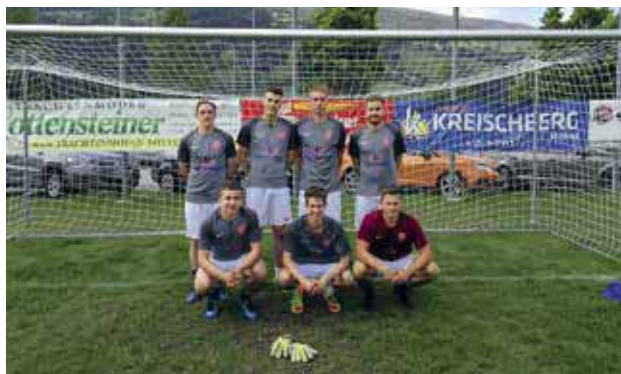
Erfolgreiche Titelverteidigung beim Pfingstturnier

Durch die unterstützende Hand unseres heimischen Gasthauses „Seppenwirt“ war es im Jahr 2018 wieder möglich, einen Landjugendball zu veranstalten. Wir hof-