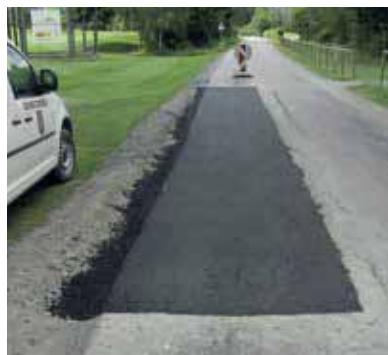
Marbachstraße Plombensanierung Asphaltdecke