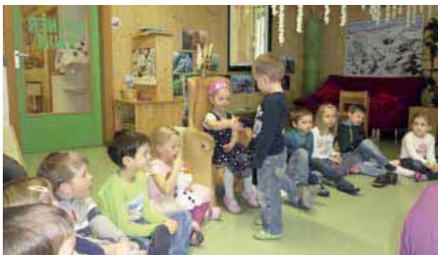
Wir gratulieren zum Geburtstag