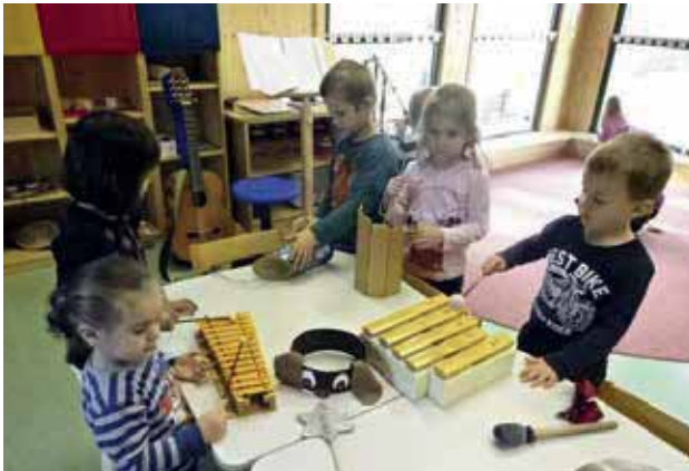
Wir machen Musik!

Im ästhetischen Bereich wird Kreativität in verschiedenen künstlerischen Ausdrucksformen deutlich, wie im bildnerischen und plastischen Gestalten, im darstellenden Spiel, im Tanz und in der Auseinandersetzung mit Musik und Sprache.“