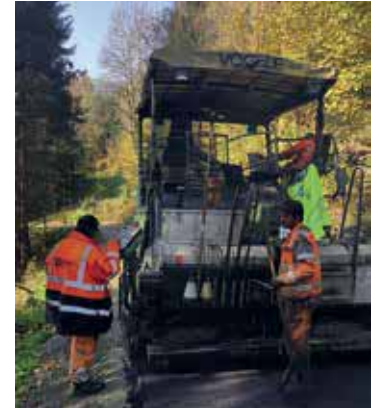
Hinterer Kotschildergrabenweg Asphaltierungsarbeiten