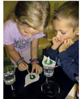
Forschen mit Fred