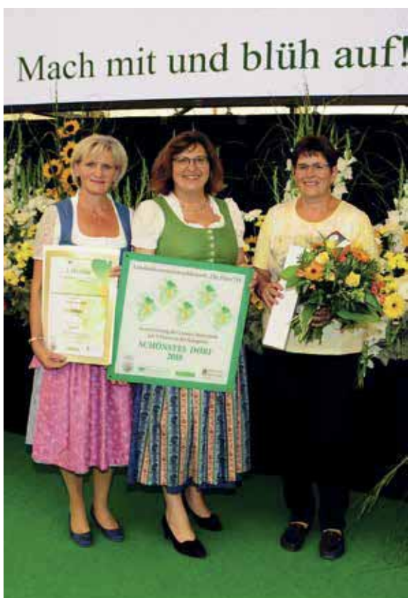
Flora18_@Foto: J. Zingl