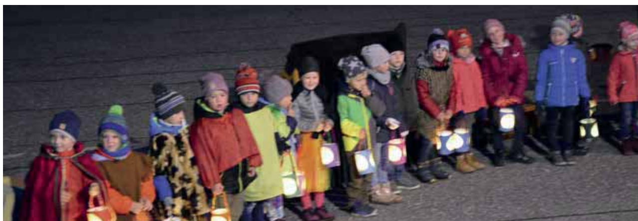
Wir feiern unser Laternenfest 2018

Das neue Kindergartenjahr 2018/19 starteten wir mit 37 Kindern.