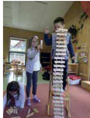
Bauen und Konstruieren mit Kaplasteinen

„Ordnungsstrukturen und Gesetzmäßigkeiten werden Schritt für Schritt erkannt. Bereits junge Kinder sammeln vielfältig Lernerfahrungen mit Raum und Zeit, mit Formen und Größen sowie mit weitem mathematischen Regelmäßigkeiten und Gesetzmäßigkeiten.“