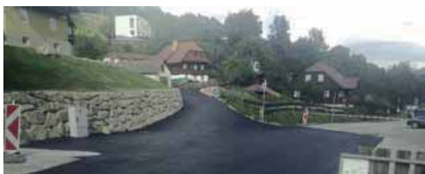
Volksschulplatz Urlweg nach den Asphaltiermaßnahmen