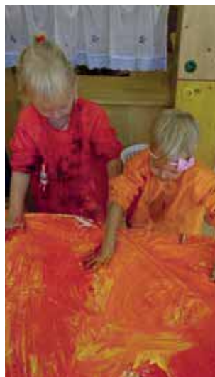
Wir malen mit Fingerfarben