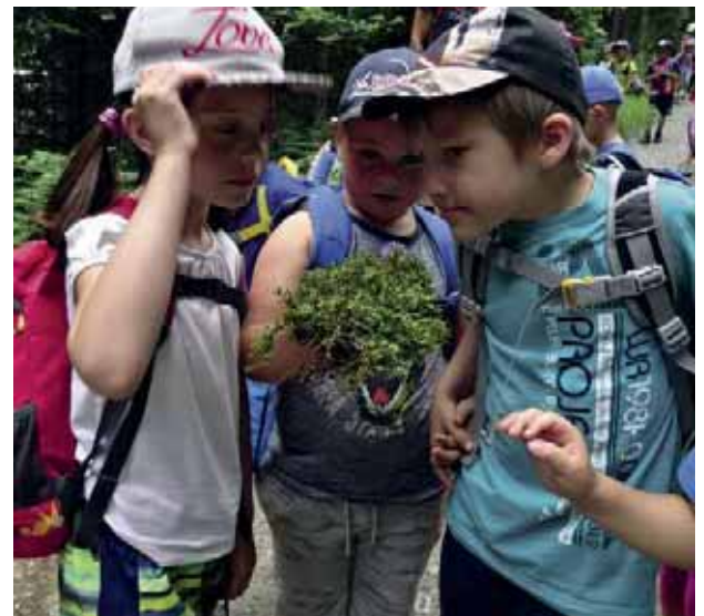
Wandertag im Eselsbergergraben 2017