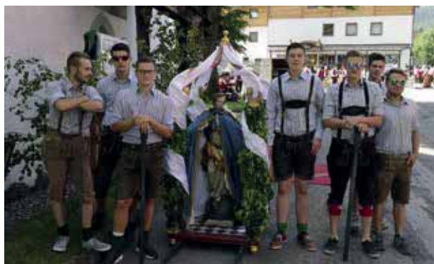
Auch bei kirchlichen Veranstaltungen waren wir tatkräftig anwesend