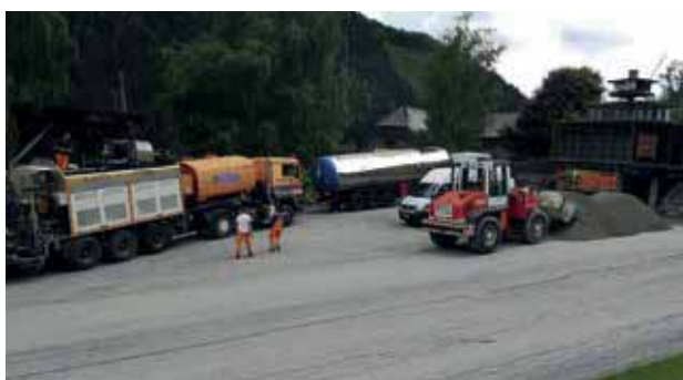
St.Ruprecht Holzmuseum vor DDK