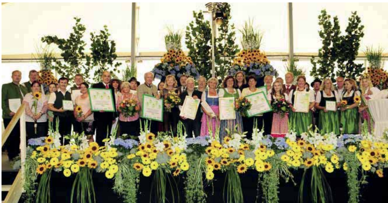
Siegerehrung in Haus im Ennstal am 6. September. Zum 4. Mal in Folge wurde die Gemeinde St. Georgen am Kreischberg zum „Schönsten Dorf“ der Steiermark gekürt.