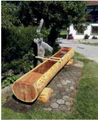
Dorfplatz St.Lorenzen, Neuer Dorfbrunnen