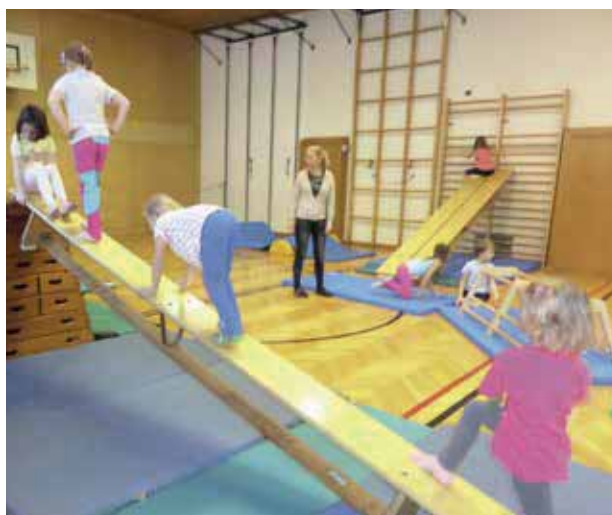
Winterlandschaft – Sprungschanz