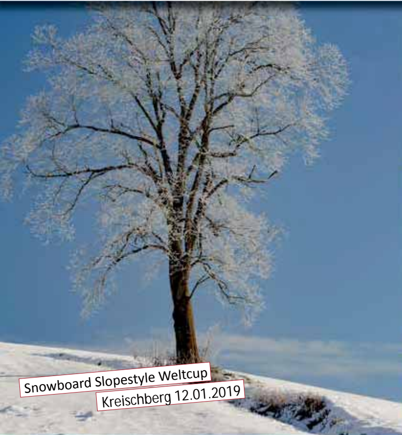
Snowboard Slopestyle Weltcup Kreischberg 12.01.2019