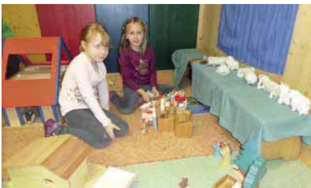
Kleine Welt – Wir spielen die Weihnachtsgeschichte