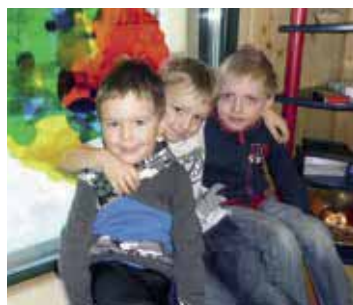
Wir sind Freunde!

„Kinder sind soziale Wesen, deren Beziehungen von Emotionen geprägt sind. Stabile Beziehungen fördern das Vertrauen ins eigene Ich und in die Umwelt.“