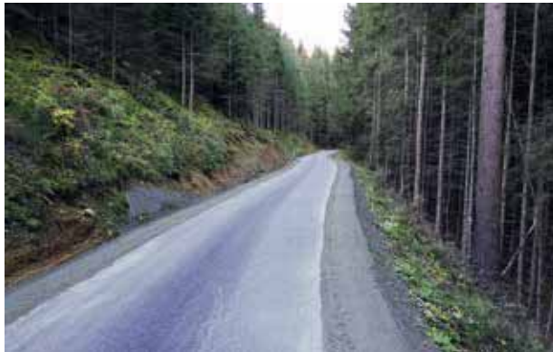
Hinterer Kotschildergrabenweg nach Asphaltierung