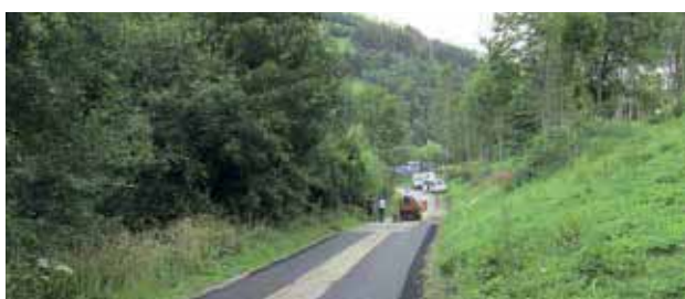
Tratte Plombensanierung Asphaltdecke