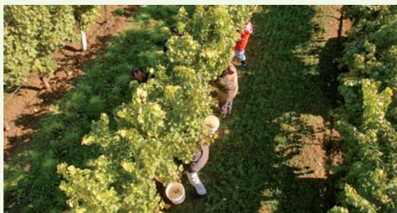
Bei der Weinlese

Aber auch so manch hervorragender Chardonnay , Sauvignon Blanc , Gelber Muskateller und Traminer wächst hier zur Reife heran. Besonders qualitätsbewusste Schönberger Weinhauer haben sich unter dem Namen Schönberger Stoamandl zusammengesetzt und garantieren beste Qualität nach strengsten Kriterien. In der Vinothek der Alten Schmiede (siehe auch Seite 6) kann man sich davon überzeugen.