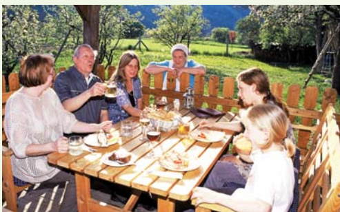
Heurigen-Kultur von urig ...