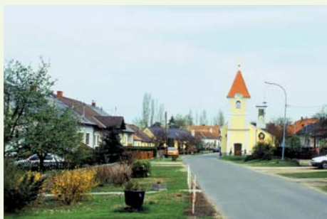
Thürneustift: eine der ältesten Siedlungen des Kamptales. Das Ortsbild wird von der Kirche und den sonnigen Weinhängen des Thürneustifter Berges geprägt.

Die Gemeinde Schönberg am Kamp mit den Hauptorten Schönberg, Stiefern und Plank! Urlaub hat hier Tradition, denn das milde, regenarme Klima lässt nicht nur den Wein bestens gedeihen, es erfreut auch den Gast. Wir laden Sie herzlich ein, diese ganz besondere Mischung zu genießen!