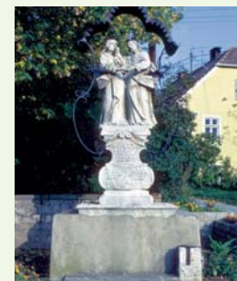
„Urlaubung“ heißt ein Ortsteil von Schönberg. Wenn das kein gutes Omen ist!