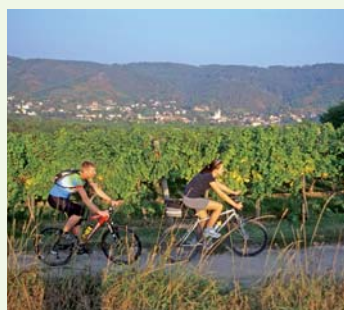
Auch Mountainbiker kommen auf ihre Rechnung.