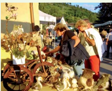
Schönberger Bauernmarkt: Vielfalt seit 1977