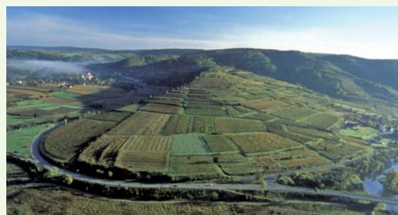
Einen herrlichen Ausblick auf den zwischen Stiefern und Schönberg gelegenen Kalvarienberg hat man vom Irlblingkreuz.

„Naturpark des Jahres“ durfte sich der Naturpark Kamptal schon einmal stolz nennen. Kein Wunder, denn dieser Park hat wirklich einiges zu bieten: Drei Landschaftstypen, die hier aufeinandertreffen, und drei Lehrpfade, die über Flora und Fauna der abwechslungsreichen Gegend informieren, machen aus einer Wanderung durch das Tal ein Naturerlebnis.