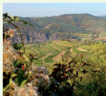
Auf dem Weinlehrpfad dem Wein auf der Spur.