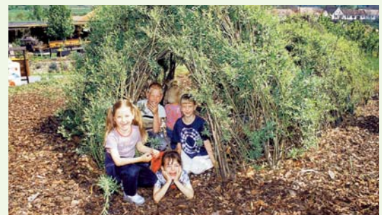
... aber auf jeden Fall kinderfreundlich!