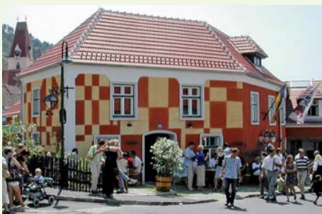
„Alte Schmiede“: erste Anlaufstelle für Gäste

E-Mail: alteschmiede@schoenberg.gv.at / www.schoenberg.gv.at