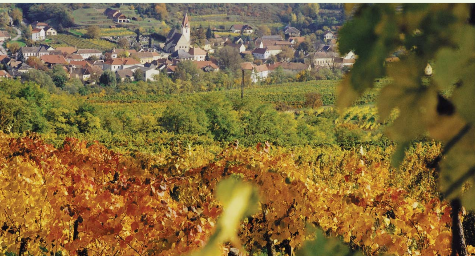
Eine ganz besondere Mischung: Schönberg am Kamp