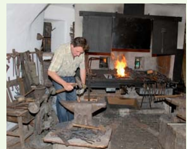
Schmieden wie damals: An besonderen Tagen wird die historisch komplett eingerichtete Schmiede sogar lebendig.