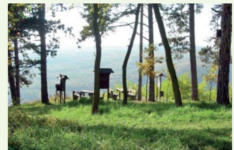
Märchenhaft: Wälder rund um Schönberg