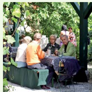
Irgendwo ist immer „ausg’steckt“