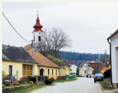
Freischling: Nicht nur Weinbau, auch „klassische“ Bauerndörfer findet man in der Gemeinde Schönberg.