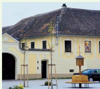
Historisch: Der Dorfplatz von Plank