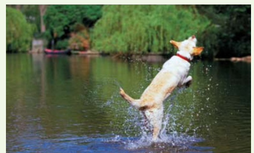
Tierische Badefreuden im Kamp