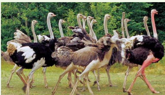
Abwechslung gefällig? Na, dann ins Straußenland!

Zum Wasser des Kamp und zum Wein kommen in Schönberg noch zauberhafte Wälder, die zum Wandern und Mountainbiken einladen.