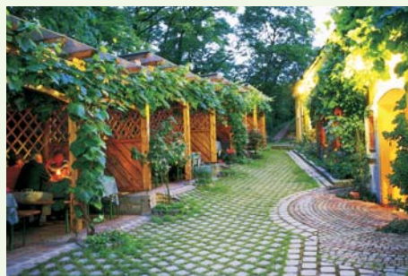
... bis gediegen, ...