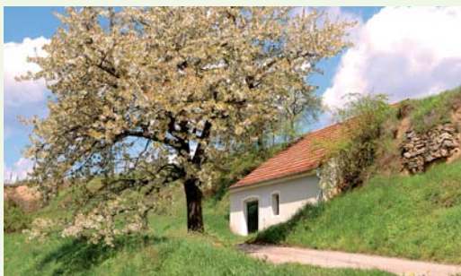
Vor dem gemütlichen Heurigenbesuch lädt die idyllische Umgebung von Schönberg zu Spaziergängen ein.