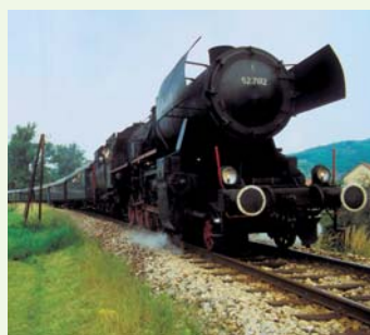
Mit der Dampfloks durchs Kamptal

In den 1930er-Jahren dampfte der „Busserzug“ Woche für Woche durchs Kamptal nach Schönberg. Die Passagiere: Berufstätige Väter, die an den Samstagen ihre Lieben in Schönberg besuchten, wo diese den ganzen Sommer über Urlaub machten. Jeden Montag ging's dann wieder nach Wien zur Arbeit. Dass man dem Zug bei so vielen Willkommens- und Abschieds-Szenen den Namen „Busserzug“ gab, liegt auf der Hand. Auch heute kann man noch viel von diesem einzigartigen Flair erleben: Bei Sonderfahrten mit Dampf- und Dieselloks rattert man über die historischen Kamptalbrücken, lernt das Tal von seiner schönsten Seite kennen und gibt sich bei den Zwischenstopps den kulinarischen Genüssen der Gegend hin.