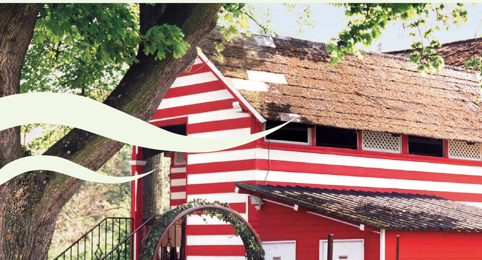
Ein Naturbad, das den Zauber der Sommerfrische lebendig werden lässt: das Kampbad von Plank.