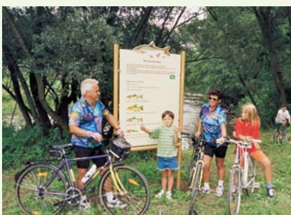
Flusslehrpfad entlang des Kamp

Es soll aber auch Leute geben, die einem Bad im Fluss nicht so viel abgewinnen können. Kein Problem: Für die gibt's das Freizeitzentrum Schönberg mit Freibad, Kinderplanschbecken, Liegewiese, Bocciabahn, Beachvolleyball- und Tennisplätzen.