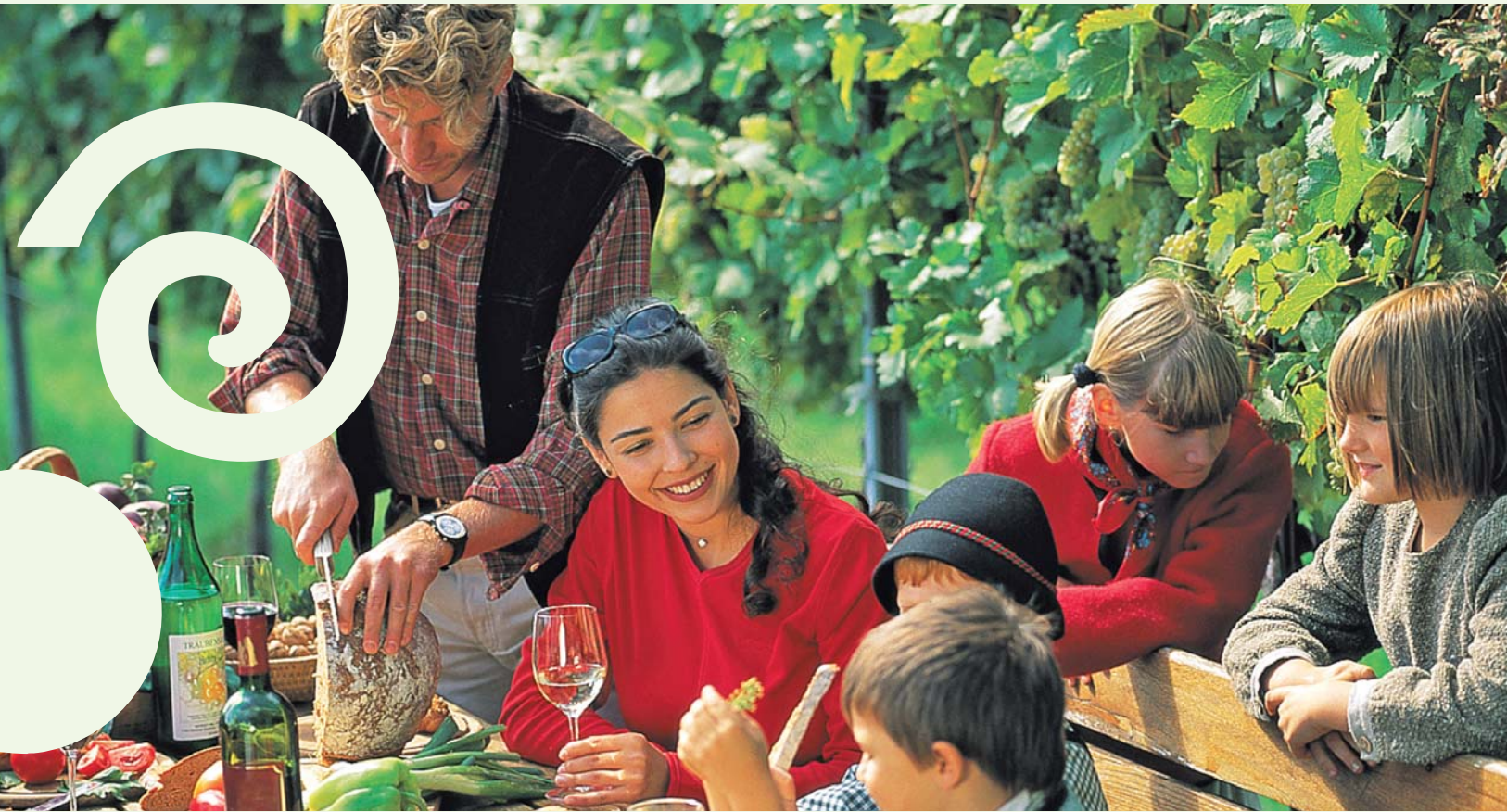
Ein gemütlicher Heuriger, eine urige Kellerpartie oder eine spontane Jause im Weingarten – in Schönberg ist alles möglich.