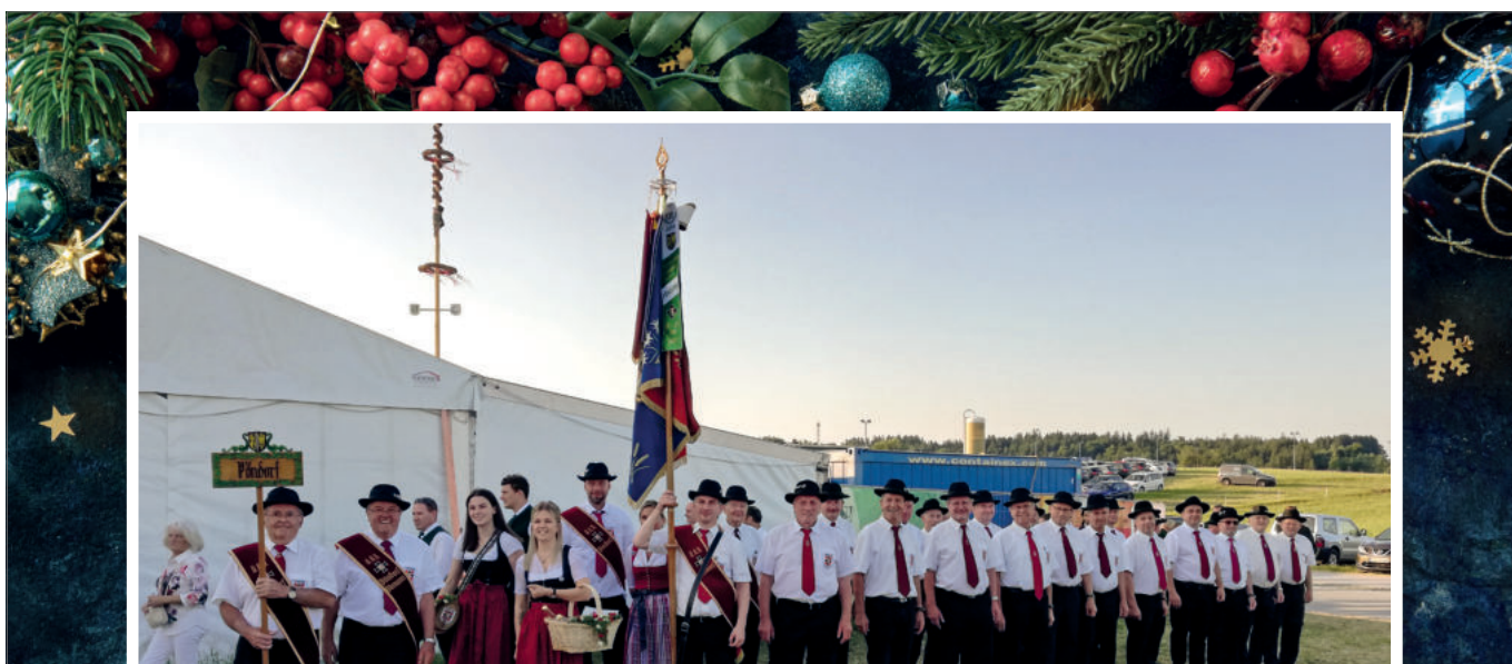
Auf dem Foto: KB Pöndorf in Eugendorf