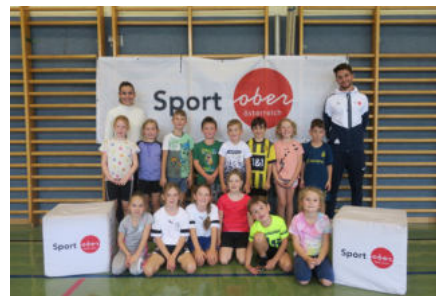
VS Pöndorf, 2023