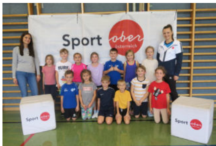
VS Pöndorf, 2023