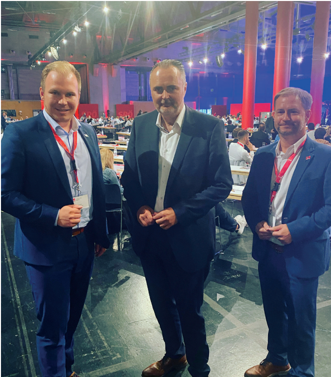
Bundesparteitag in Wien