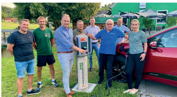
Errichtung der E-Tankstelle abgeschlossen