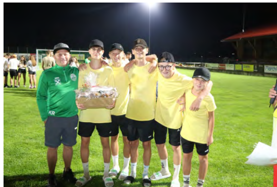
Starke Jugendmannschaft beim Elfmeterturnier 2022.