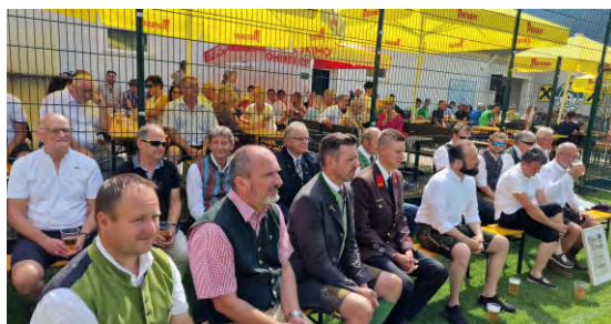
Zahlreiche Gäste und Ehrengäste beim Jubiläumsfestakt.