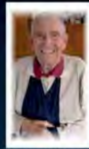
Hotter Alfons 90 St. Peter a. Kbg.