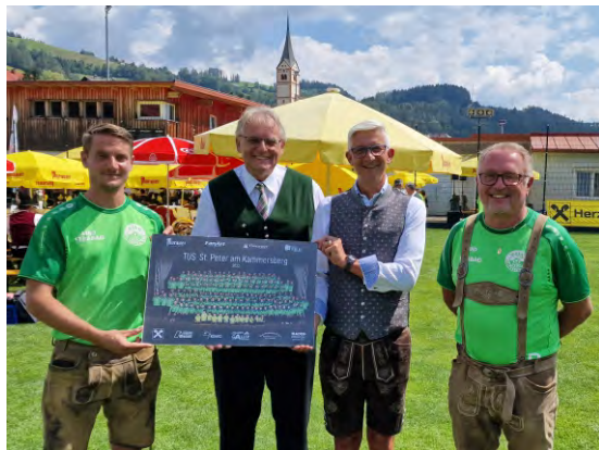
Der TUS bedankt sich bei der Raiffeisenbank Murau für die jahrzehntelange Unterstützung.