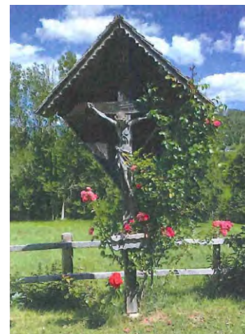
Holzkreuz im Gedenken an die 1947 ermordeten Gendarmen.