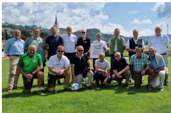
Die Legenden des TUS beim 70-Jahr-Jubiläum.