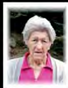
Stock Elisabeth 85 Peterdorf