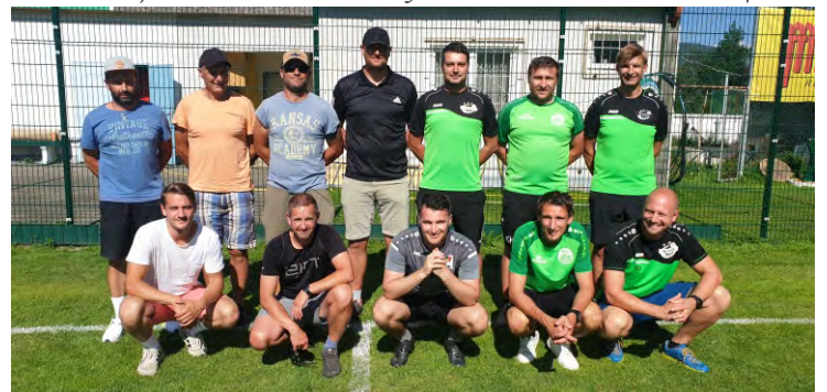
Gemeinsame Trainerausbildung mit dem SV Oberwölz.