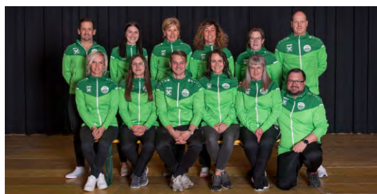
Sie sorgen für den reibungslosen Ablauf im Hintergrund - das Kantinenteam.