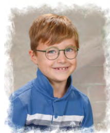
Schnedl Mattia Feistritz ☺ Falkner 🍷 Turnen