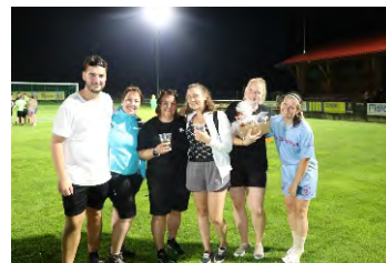
Die Damenteams waren beim diesjährigen Elfmeterturnier wieder sehr erfolgreich.