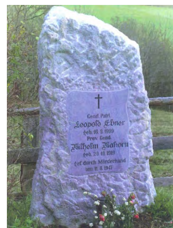
Gedenkstein am ursprünglichen Standort beim Tatort.