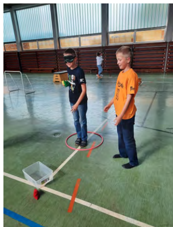
Neu saniertes Schulgebäude Der heurige Start ins neue Schuljahr war für die Kinder der

MS St. Peter a. Kbg. generell ein besonderer, da erstmals wieder alle Kinder im neu sanierten Schulzentrum ihre Klassen beziehen konnten. Die Schülerinnen und Schüler bestaunten mit Begeisterung ihre neuen Klassen und die dazugehörigen Marktplätze, die Teil des neuen pädagogischen Konzeptes sind. Auch sämtliche Funktionsräume wie zum Beispiel der Physiksaal, die Schulküche oder der Werkraum wurden bereits genauestens unter die Lupe genommen. Schulisch stand die