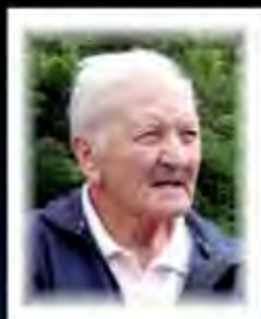
Stock Burkhard 90 Peterdorf