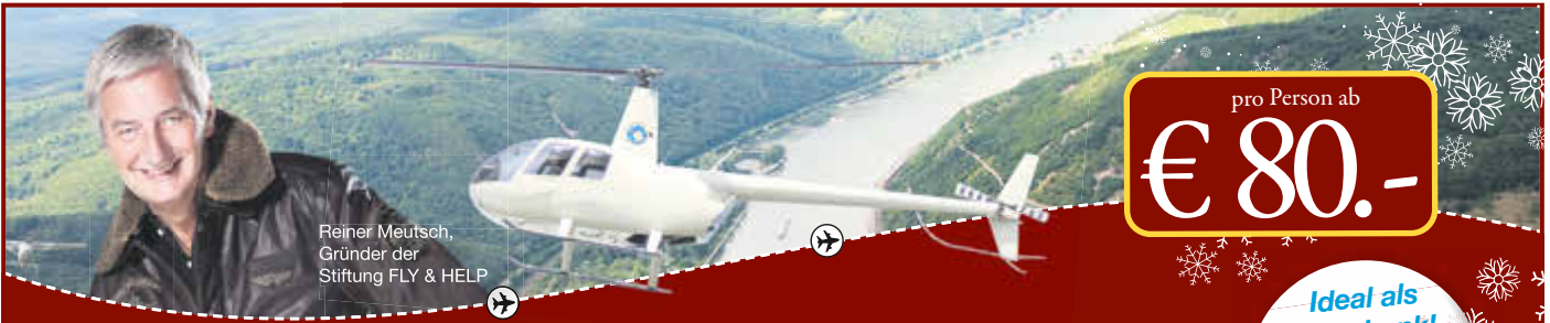
Reiner Meutsch, Gründer der Stiftung FLY & HELP