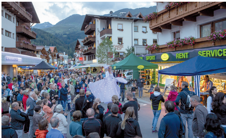
Die Begegnungszone wurde bei der „Langen Nacht“ ausgiebig genutzt.

„Es ist ein gutes Projekt: Die Bevölkerung muss sich wahrscheinlich erst daran gewöhnen – aber auch die U-Bahn