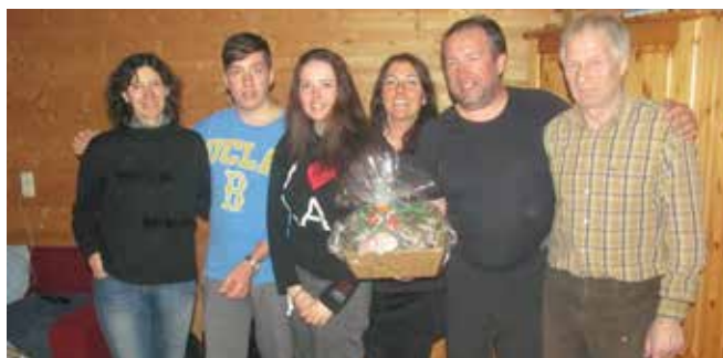
Fam. Medved wurde ebenfalls für 10 Jahre ausgezeichnet