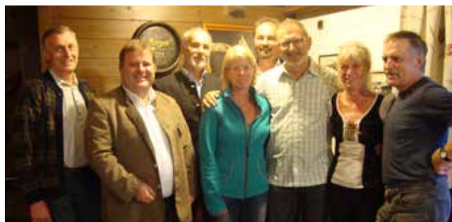
Fam. Viehberger wurde für 25 Jahre geehrt