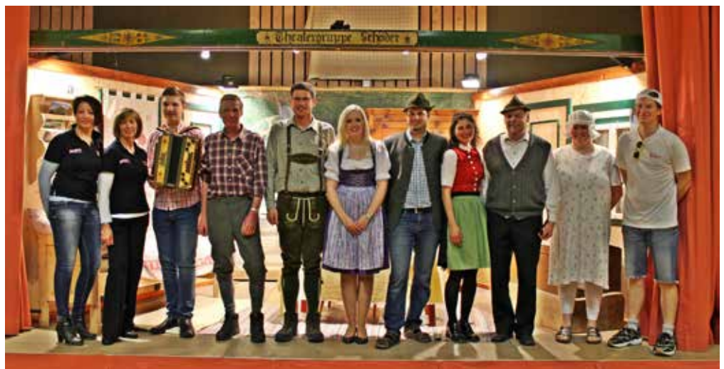
Die Theatergruppe Schöder begeisterte mit dem Stück „Die Wett im Bett“.