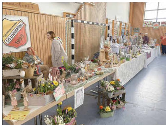
Groß war das Angebot an Bastel-, Deko- und Osterartikeln.