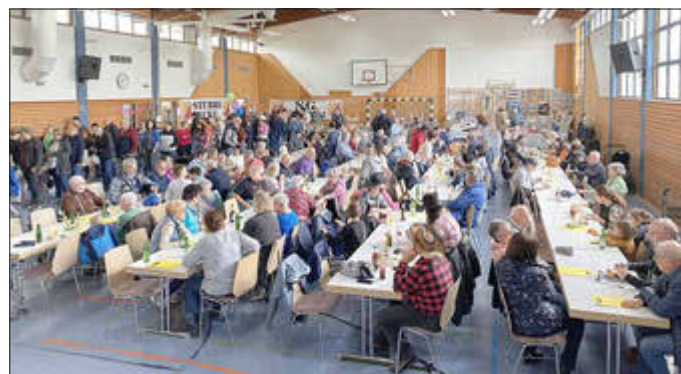
Zur Mittagszeit war die Dr. Darge-Halle bereits gut gefüllt