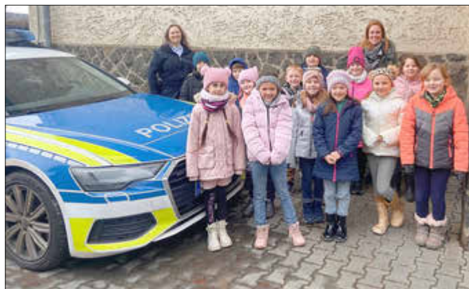
Zweitklässler besuchen Polizei