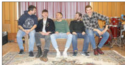
Die Band „summer returns“ ist der Headliner des Abends

Am Freitag, 19. April 2024 sind wieder laute Klänge im JAM zu hören. Spielen werden 3 Bands, die Türen sind ab 18 Uhr geöffnet. Der Eintritt kostet 5 €. Zu Gast werden die Bands summer returns, Lowknox und Alderson sein.