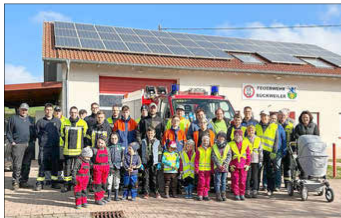
Archivbild Umwelttag 2022

Am Samstag, 06. April findet der diesjährige Umwelttag in und um Rückweiler statt. Gemeinsam werden wir unsere Gemarkung von Abfall und Müll säubern, den andere achtlos weggeworfen haben und hoffen auf die Beteiligung vieler Bürgerinnen und Bürger.