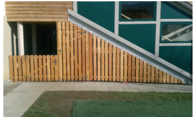
Arbeiten von unserem Schulwart