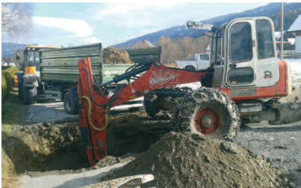
Kanalarbeiten in der Gemeinde