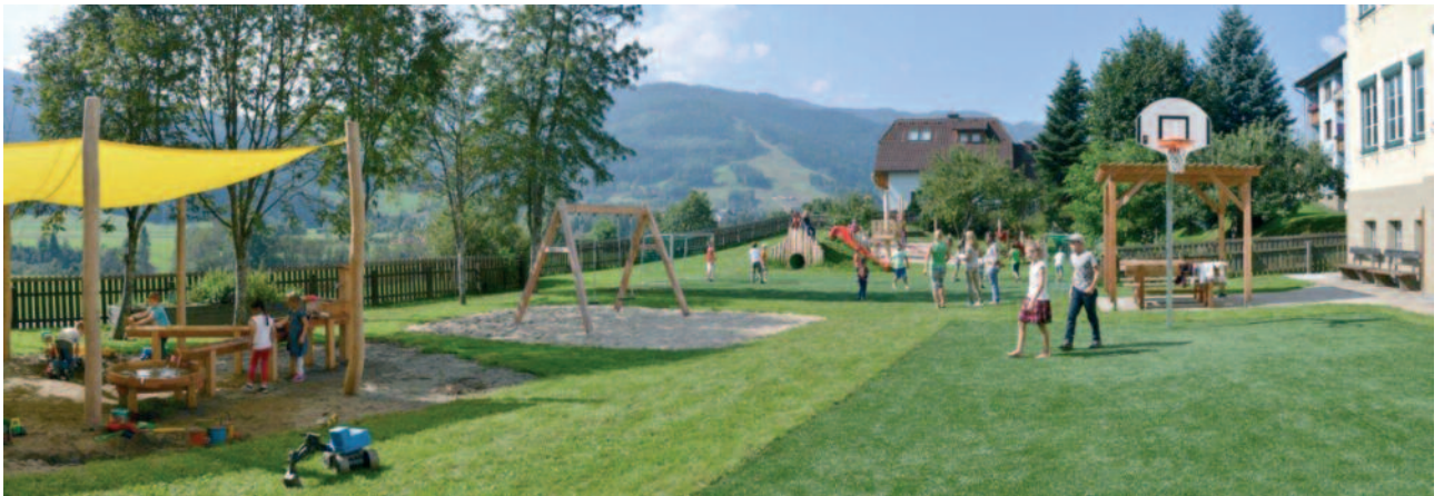
Gemeinsamer Spielplatz Schule und Kindergarten