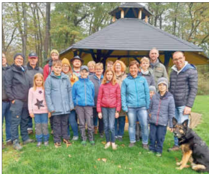
Ein gelungener Wandertag 2022

Teilnehmer bitte bis 07.06.2023 bei Vorstand oder Trainern anmelden. Infos auf der Homepage des Vereins: www.kcb-karate.de