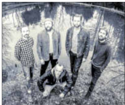
Thomas D &amp; The KBCS

Thomas D hat schon früh erkannt, dass er den Rummel des Popstar-Daseins am besten durch echte Handarbeit ausgleichen kann. Die praktiziert er seit über 20 Jahren auf seinem Hof in der Vulkaneifel. Hier gerät er eines Tages durch einen großen Zufall an eine Schallplatte der Hamburger Band The KBCS. Er hört gespannt die ersten Minuten und fragt sich, wann endlich Gesang einsetzt. Doch nach einigen Songs wird ihm klar: das ist eine instrumentale Platte.