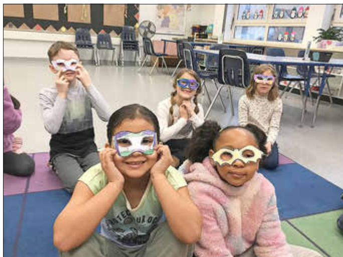
Helau von unseren Zweitklässlern!

Dieses Jahr kam bei den Kindergartenkindern und Erstklässlern vor allem die Tänze zum Fliegerlied und der beliebte Ententanz gut an, da beide Lieder so gute Laune verbreiten. Die Zweitklässler bastelten Papierkrawatten für den dicken Donnerstag und gestalteten bunte Masken (siehe Foto).