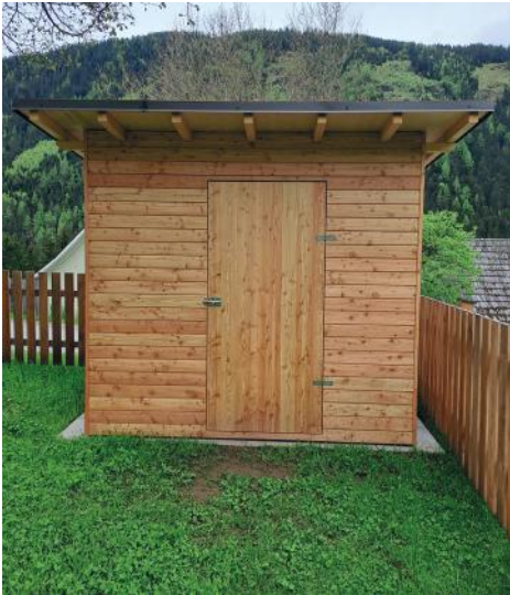
Errichtung Gerätehaus Kindergarten St. Ruprecht