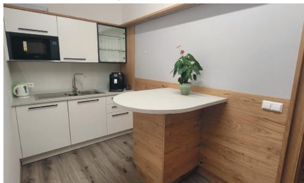
Küchensanierung im Gemeindeamt