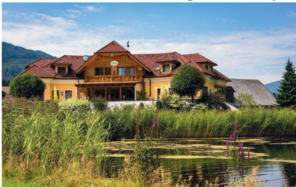
„Eagle“ – das neue Wirtshaus am Golfplatz wird nicht nur die Golfer begeistern!

Der GC Murau-Kreischberg bietet mit dem „Startpaket“ den perfekten Einstieg in den Golfsport: Um € 420,- (für Saisonkarteninhaber Kreischberg sogar nur € 320,-!) erhalten Sie