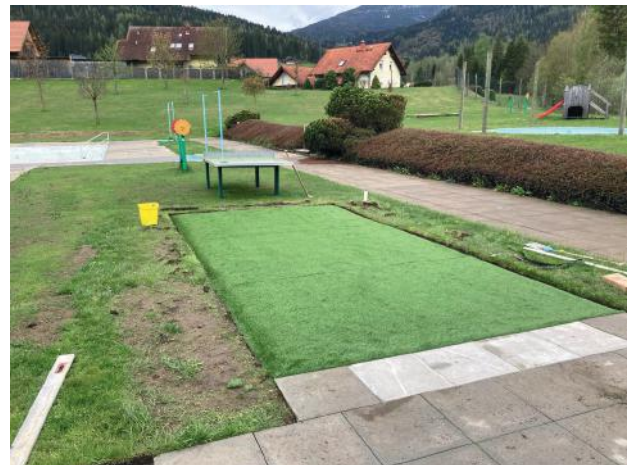
Sanierungen im Freibadbereich

Ein herzliches Dankeschön an unsere Mitarbeiter/Innen unserer Gemeinde für ihre vielfältigen Einsatzbereiche und Tätigkeiten während des ganzen Jahres!