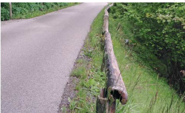
Die geplanten Leitschienerneuerungen in der Gemeinde