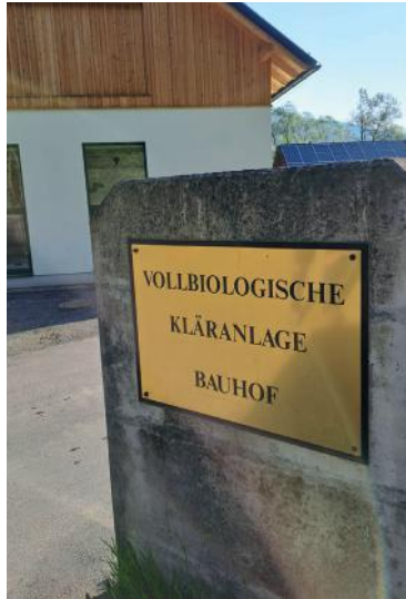
Kläranlage BA 15, Halle Klärschlammwässerung und „Mehrzweckraum im DG“