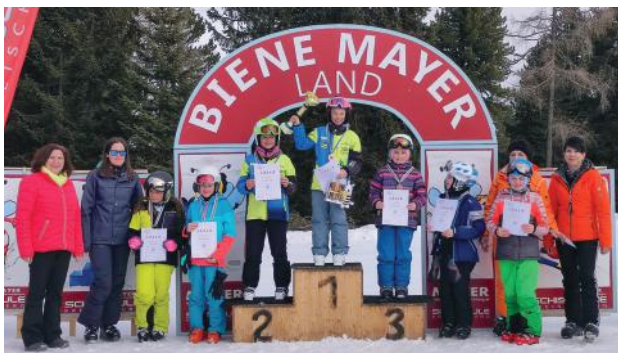
Die Mäd'l's der 4. Schulstufe.

Die Schulschitage fanden heuer wieder Anfang März statt. Das Schifahren mit den Schilehrern und Schilehrerinnen der Schischule Mayer machte den Kindern viel Freude und sie lernten eine Menge dazu. Am Freitag stellten die Kinder ihr Können bei einem spannenden Abschlussrennen unter Beweis.