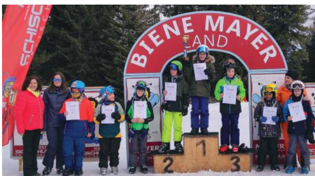
Die Burschen der 4. Schulstufe.