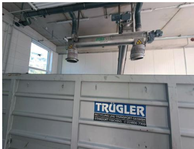
Mechanische Vorreinigung und Klärschlammwässerung