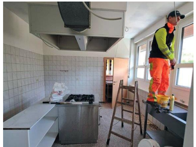
Sanierungs- Verbesserungs- und Malerarbeiten im Badrestaurant