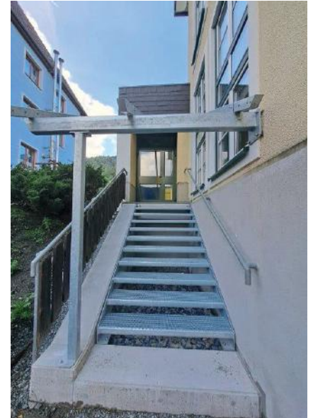
Notausgang mit Glasüberdachung bei der Volksschule