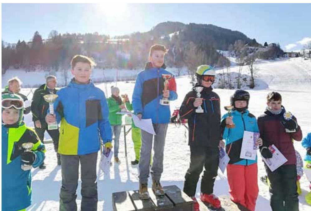
Glückliche Gesichter der Gewinner der Ski-Vereinsmeisterschaft 2018