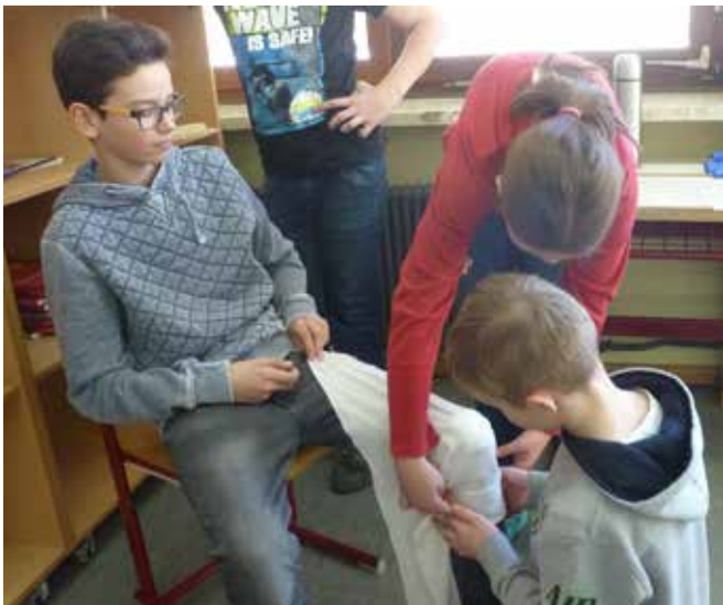
Tag der offenen Tür

Unser Schulteam bemüht sich auch weiterhin um eine nachhaltige Verankerung des digitalen Lernens an unserem Schulstandort!