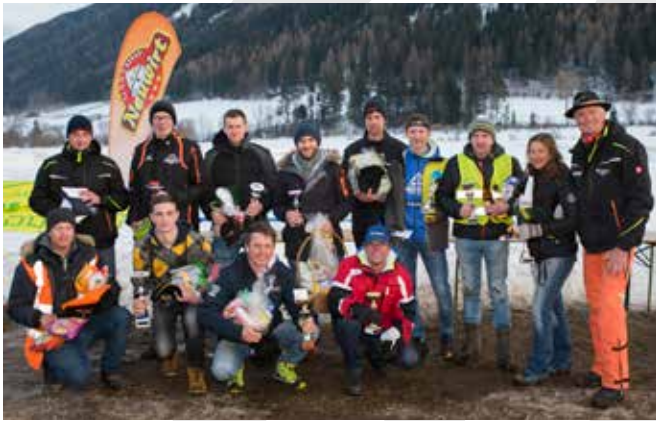
Der Veranstalter mit den Klassensiegern