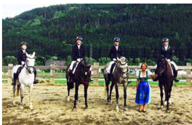
Landesmeisterschaften Vielseitigkeit am Olachgut