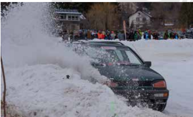
VW Golf vom Team Wohleser in Aktion