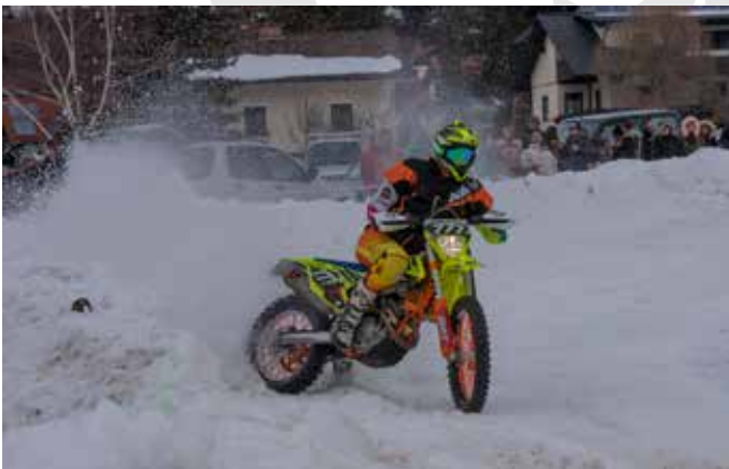
Nur etwas für Könner