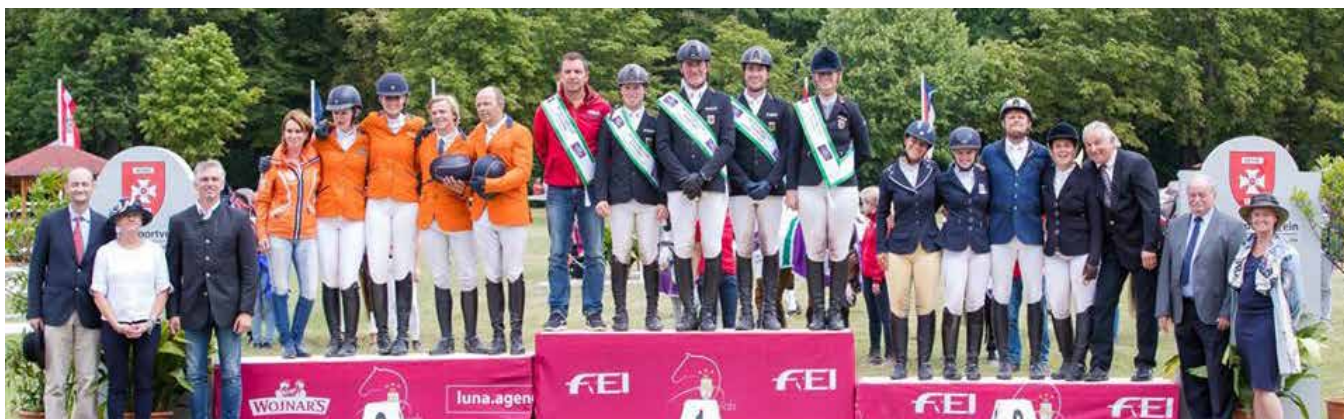
CIC2* in Thal