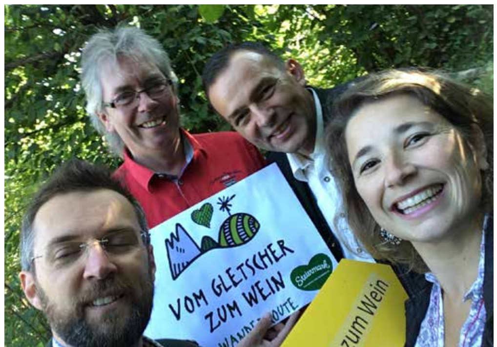
Weitwanderweg vom Gletscher zum Wein

▪ 28. Februar bis 04. März Nürnberg wurde, wie gewohnt, in Zusammenarbeit mit dem Tourismusverband Murau Kreischberg besucht.