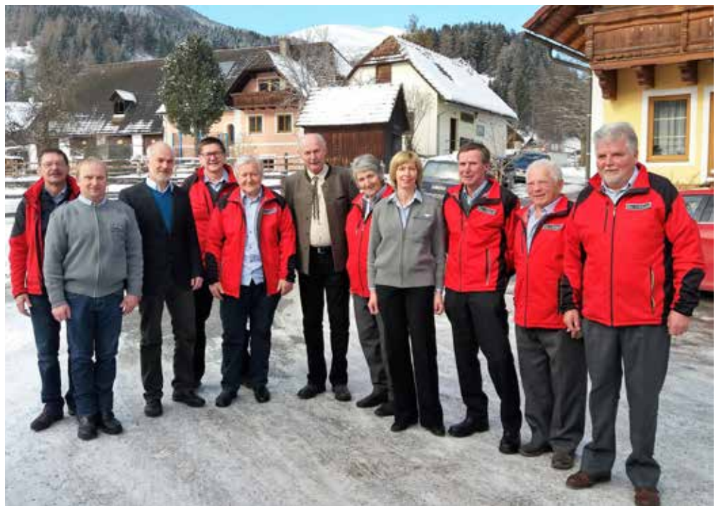
Neuwahl der Ortseinsatzstelle Schöder/Ranten am 04.02.2018 im Gasthaus Neuwirt

lichen Dienst zum Wohl der Natur. Für die zukünftige Bewältigung dieser Aufgaben brauchen wir interessierte Personen, die uns mit Freude und gewissenhaftem Einsatz unterstützen und mitarbeiten. Für die einzelnen Aufgabenbereiche wie Gewässeraufsicht, Motorsportüberwachung, Schlangengexperten und Ameisenheger gibt es laufend Schulungen.