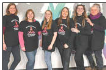
BUZ: Das Orga-Team zog eine positive Bilanz des Aktionstages.

Anlässlich des Aktionstages ‚One Billion Rising‘ fand in Idar-Oberstein am Valentinstag ein Tanzflashmob zu dem Lied ‚Break the chain‘ statt. Auf dem Schleiferplatz im Stadtteil Idar standen dabei von 14 bis 16 Uhr neben dem gemeinsamen Tanz als Symbol der Solidarität und des Engagements auch Redebeiträge, die Trommelgruppe Tanamasi und verschiedene Aktionsstände auf dem Programm. Für das leibliche Wohl sorgte eine Gruppe junger Frauen der Berufsbildenden Schule Wirtschaft und Technik mit einem Waffelstand.