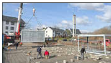
Am Barbararing entsteht vorübergehend eine Container-Kita.

An der neuen Kindertagesstätte Barbararing wurden Ende Februar die Container aufgestellt. Das städtische Gebäude am Barbararing wird umgebaut und erweitert, damit hier eine neue Kindertagesstätte mit bis zu 75 Plätzen entstehen kann. Um bereits zeitnah den dringenden Bedarf an Kita-Plätzen in diesem Bereich zu decken, wird während der Umbaumaßnahme eine Containerlösung mit rund 40 Plätzen auf dem angrenzenden Gelände eingerichtet. Diese soll voraussichtlich ab Mai zur Verfügung stehen.