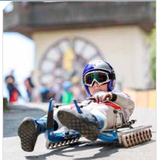
Rodeln über Kopfsteinpflaster vom Grazer Schlossberg.