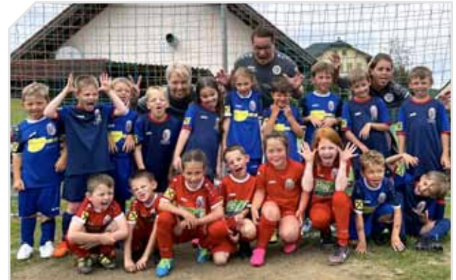
Die erfolgreichen Jugendteams haben sichtlich Spaß.