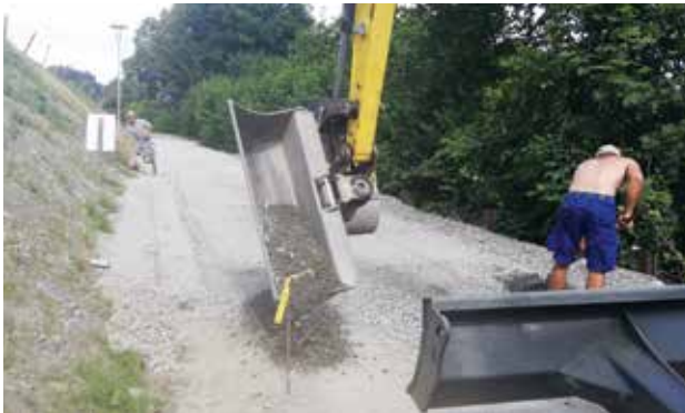
Thannerweg - Unterbauarbeiten