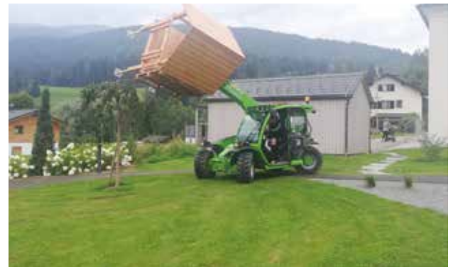
Das Spielhaus wird angeliefert