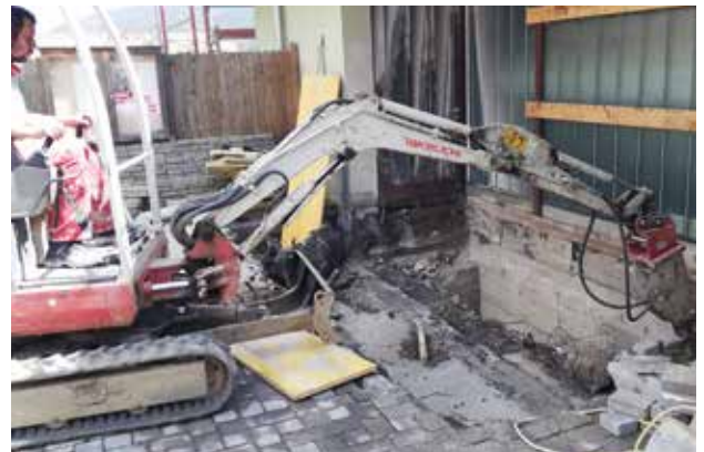
Gemeindeamtsumbau - Abbrucharbeiten