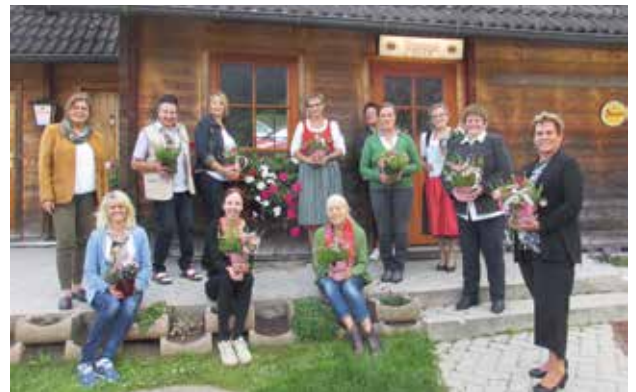
Unsere Landessiegerinnen in Bronze