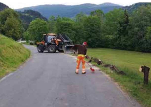
Lutzmannsdorferstraße - Abriss der alten Leitschiene