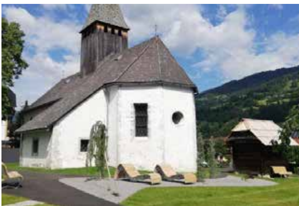
Gemütlichkeit am Dorfplatz