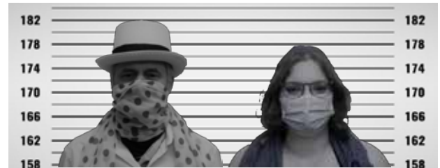
Der Theaterverein St. Georgen am Kreischberg präsentiert: