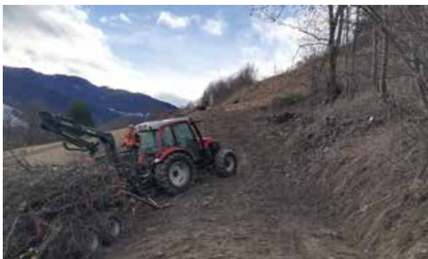
B97 Hangrutschung - Neuverlegung Kirchsteig