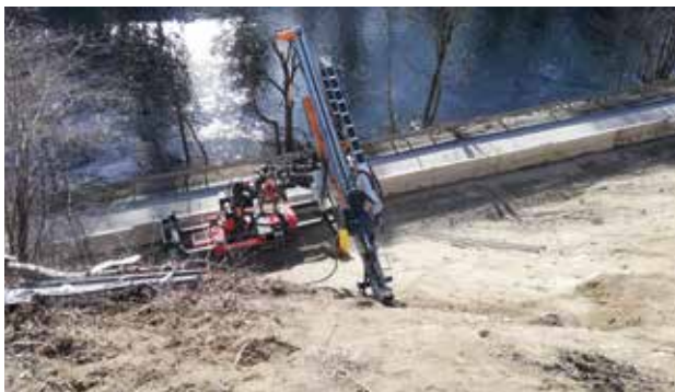
B97 Hangrutschung Sicherungsarbeiten