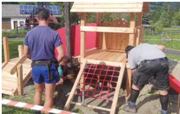
Ein neuer Spielplatz Mitten im Dorf