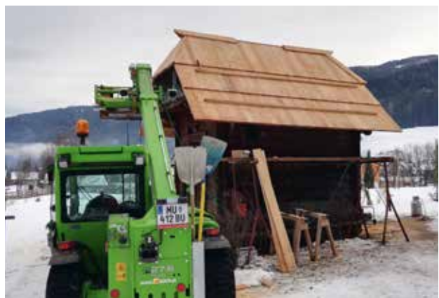
Dachdeckerarbeiten beim Troatkasten