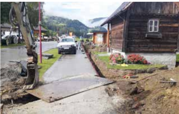
Kreischbergstraße - Stromanschlüsse für die Objekte