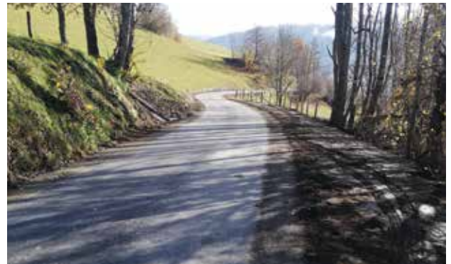
Feldernweg - Generalsanierung eines Teilstückes