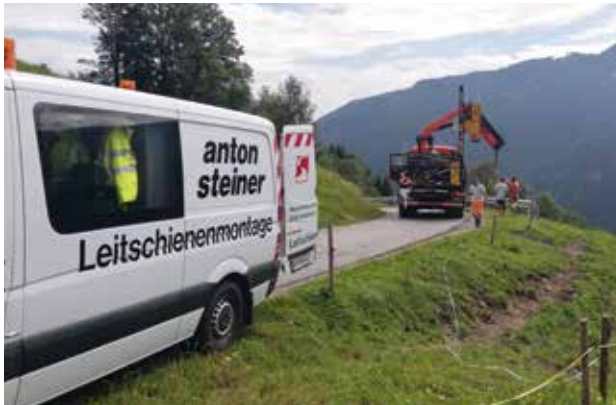
Oberes Falkendorf - Leitschienen werden erneuert