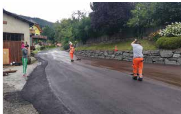
Marbachstraße - DDK-Asphaltdecke