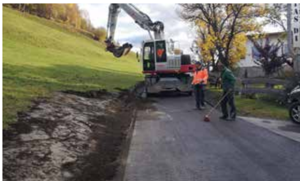
Feldernweg - Bankettarbeiten und Humusarbeiten