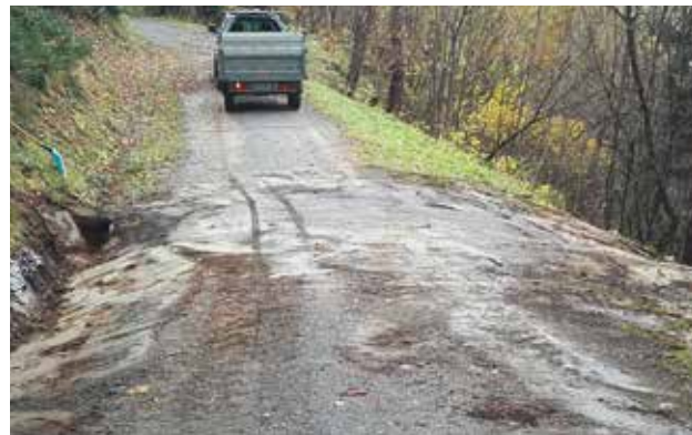
R2 Murradweg - Unwetterschäden behoben