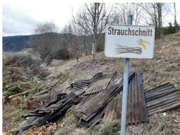
Müll – Unrat