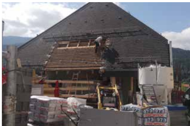
Gemeindeamtsanierung - Dachabdeckung