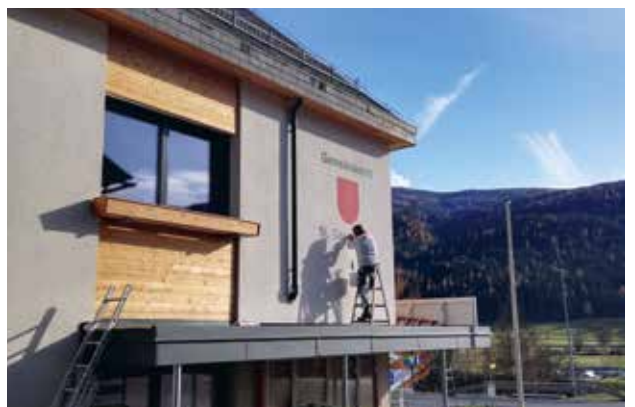
Gemeindeamtsanierung - das neue Gemeindewappen