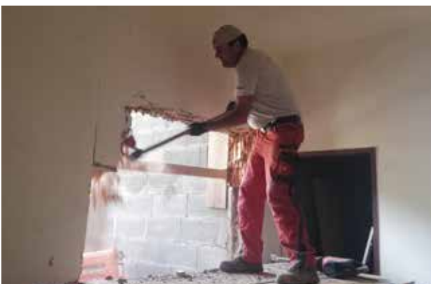
Gemeindeamtsanierung - Liftschachtdurchbruch