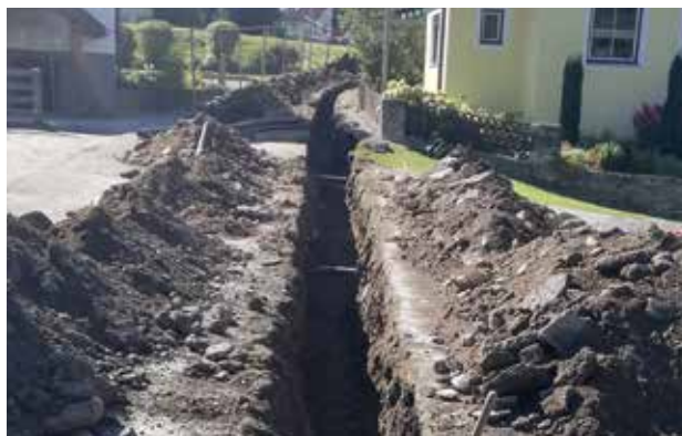
Ahornweg - Erweiterung des Stromnetzes

Liebe Gemeindebevölkerung, liebe Gäste, Bitte bedenken Sie, dass widerrechtliche Entsorgung des Unrates auf Kosten aller GemeindebürgerInnen geht. Außerdem haben unsere Gemeindemitarbeiter einen besonderen Zeit- und finanziellen Aufwand, den nicht fachgerecht entsorgten Müll zu sortieren und zu beseitigen.