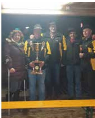
Sieger die „Papageien“

Der Eisschützenverein Lutzmannsdorf wünscht allseits Frohe Weihnachten, Stock Heil und ein gutes, gesundes Neues Jahr.