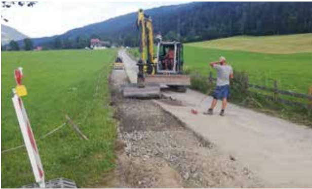
Marbachstraße - Plombensanierung mit Unterbau