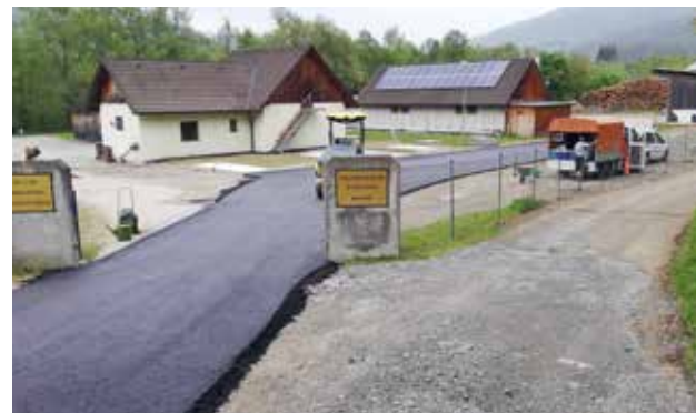
Neugestaltung Einfahrt Bauhof Kläranlage