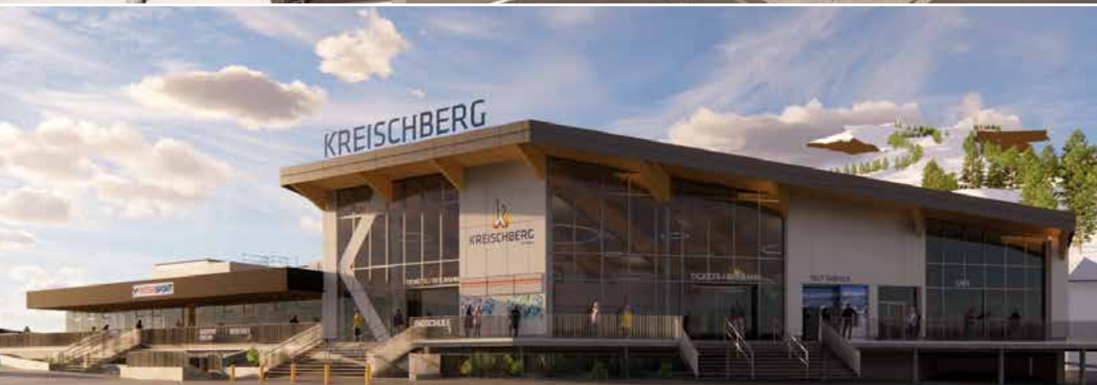
Projekt Kreischberg 10er Gondelbahn