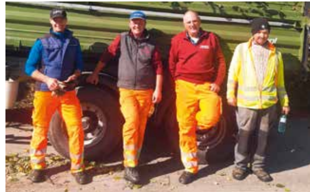
Das Bauhofteam im Außendienst