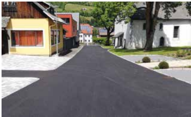
Dorfplatz St. Lorenzen, die neue Verschleißschicht