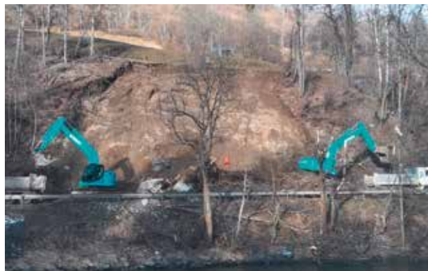
B97 Hangrutschung - Aufräumarbeiten