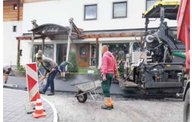
Dorfplatz – Verschleißschicht wird aufgezogen