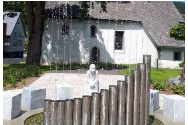
Ein schöner Platz für uns alle