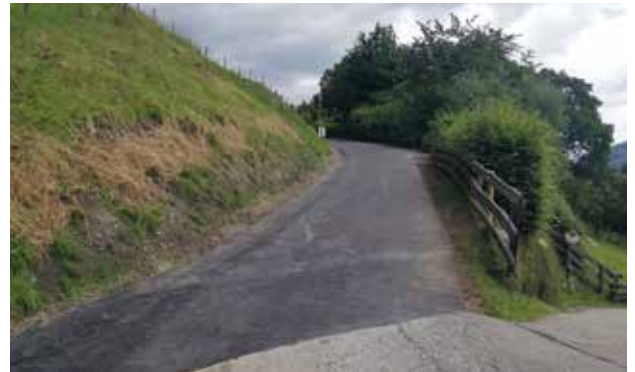
Thannerweg - Asphaltierungsarbeiten