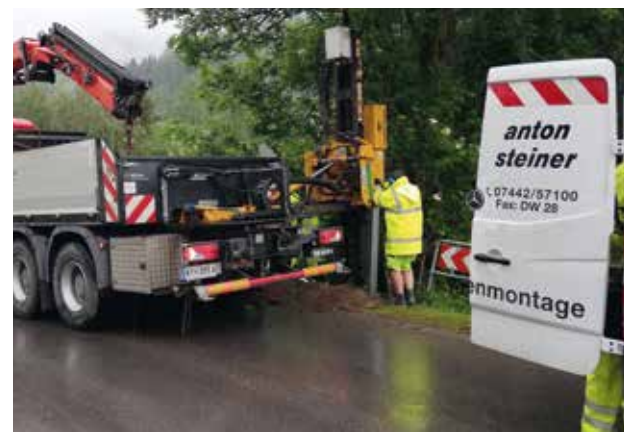
Errichtung der neuen Leitschiene