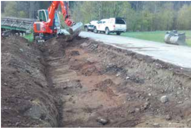
Errichtung Abstellfläche Bereich Oberwiesenbrücke