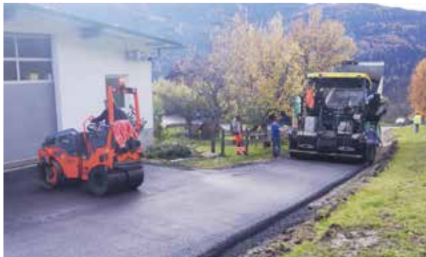
Feldernweg - Generalsanierung Asphaltdecke