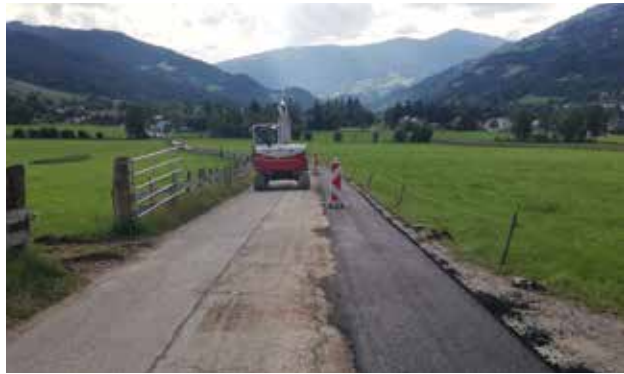
Marbachstraße - Plombensanierung