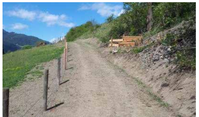
Das neue Teilstück des Kirchsteigweges

Ein herzliches Dankeschön an die Grundbesitzer Michael Moser und Michael Seidl für die Möglichkeit der Verlegung des Kirchsteigweges