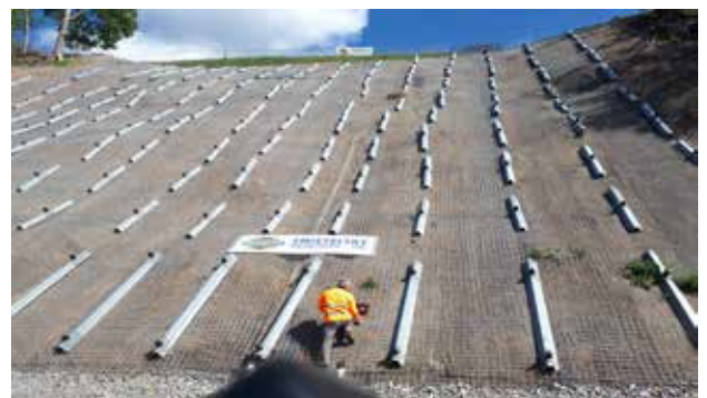
Abschlussarbeiten der Sanierung/Hangrutschung