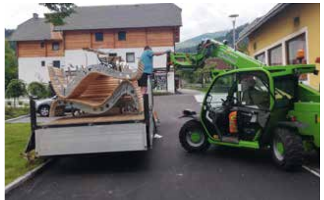
Neugestaltung Dorfplatz - Parkmöbel