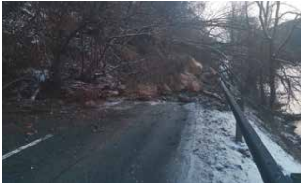
B97 Hangrutschung - von 27. auf 28. Dezember 2019