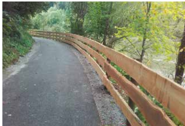
R2 Murradweg - Neuerrichtung des Zaunes