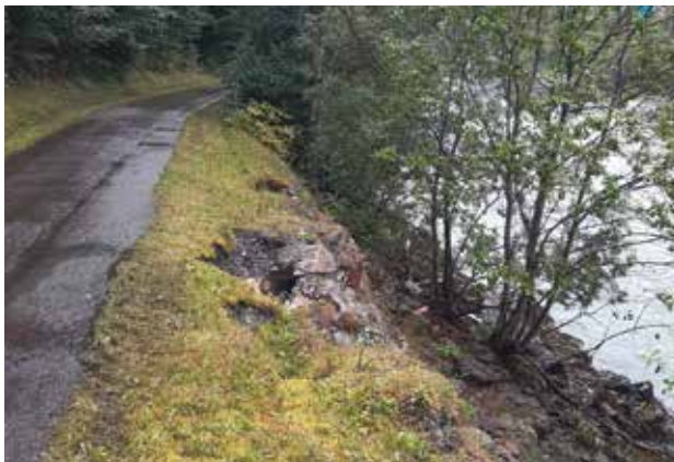
R2 Murradweg - Unwetterschäden