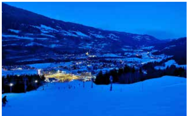
Verkehrschao rund um die Uhr