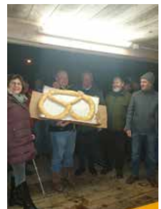
Trostpreis: „Die Feuerwehr“