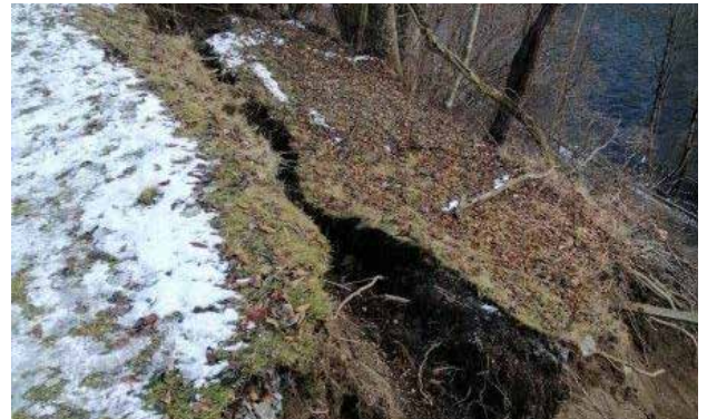
Der Hang ist in Bewegung