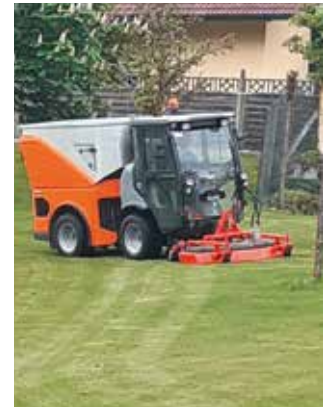
Das Kommunalfahrzeug im Einsatz