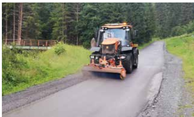
Grabenstraße - Unwetterschäden