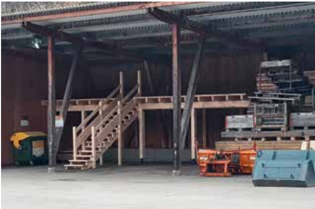
Neue Lagermöglichkeiten am Bauhof