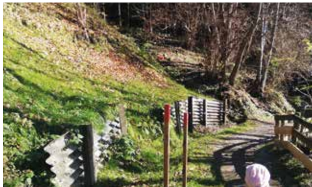
Mursteig - Unwetterschäden Hangrutschung