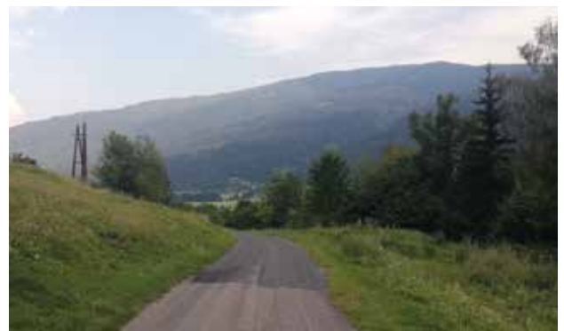
Feldernweg - Spritzasphaltsanierung