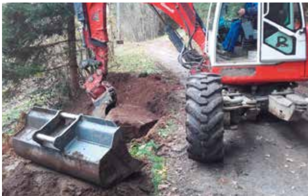
R2 Murradweg - zahlreiche Sanierungen