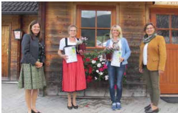
Unsere Landessiegerinnen in Silber