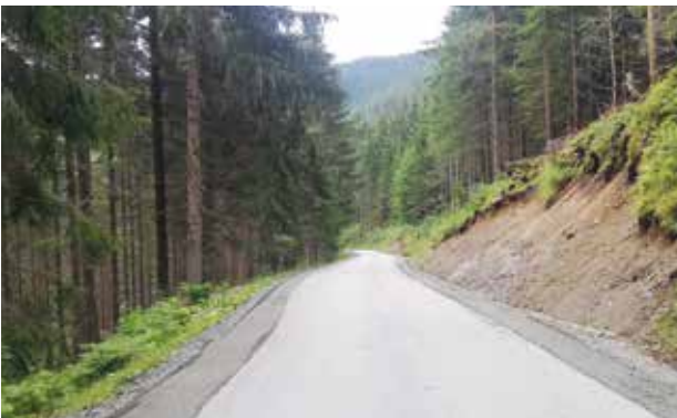
Hinterer Kothschildergrabenweg - Bankettsanierung