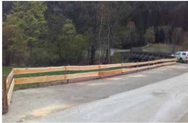
Fertigstellung Abstellfläche Oberwiesenbrücke