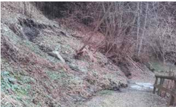
Mursteig - St. Georgen, Unwetterschäden