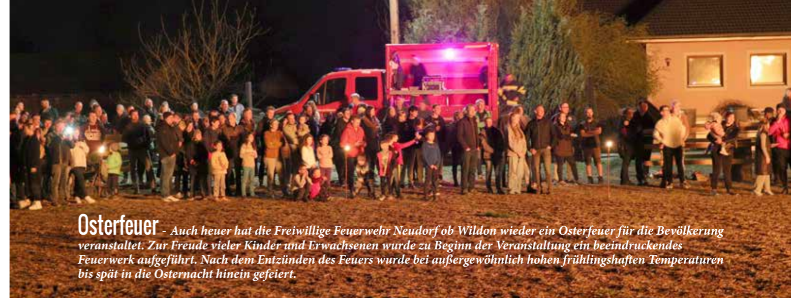
Osterfeuer - Auch heuer hat die Freiwillige Feuerwehr Neudorf ob Wildon wieder ein Osterfeuer für die Bevölkerung veranstaltet. Zur Freude vieler Kinder und Erwachsenen wurde zu Beginn der Veranstaltung ein beeindruckendes Feuerwerk aufgeführt. Nach dem Entzünden des Feuers wurde bei außergewöhnlich hohen frühlinghaften Temperaturen bis spät in die Osternacht hinein gefeiert.