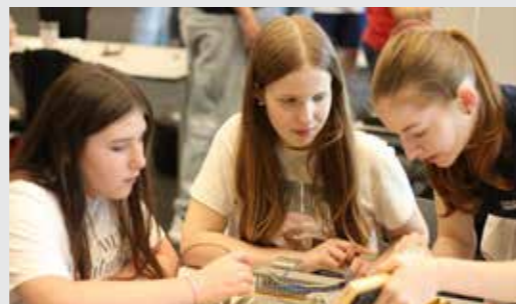
Präzision und Genauigkeit sind hier gefragt