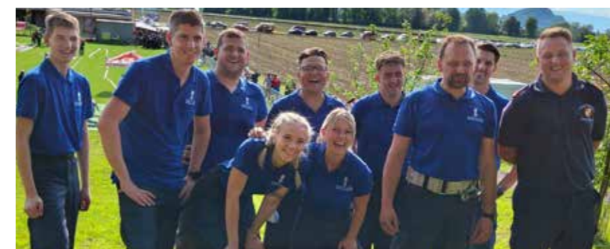
Die Kameradinnen und Kameraden der Neudorfer Feuerwehr beim Bereichsleistungsbewerb am 4. Mai in St. Georgen/Stiefing.

Nach einem Jahr Pause nahm eine Gruppe der Freiwilligen Feuerwehr Neudorf ob Wildon wieder am alljährlichen Bereichsleistungsbewerb des Feuerwehrbereichs Leibnitz teil.