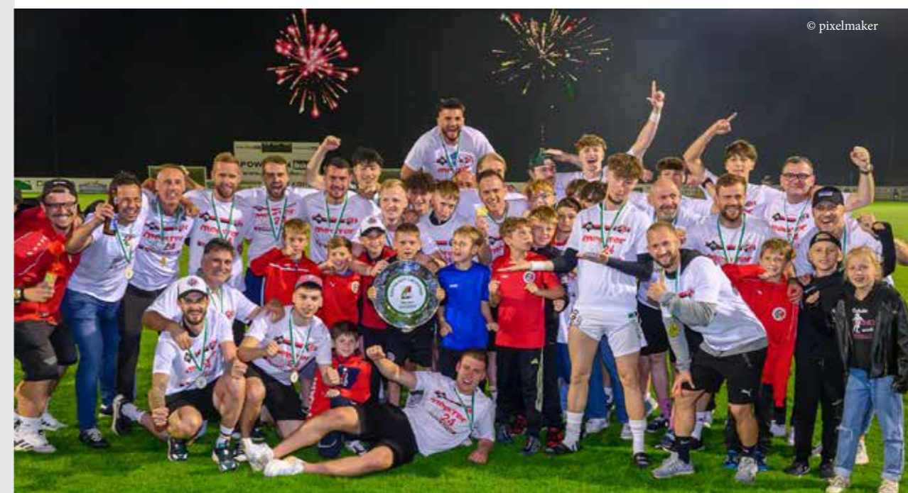
Die Meistermannschaft des SV Wildon feiert zusammen mit Nachwuchsspielern und Nachwuchstrainern