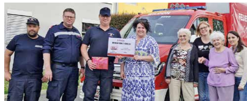
Berichte: OLMdV Marcel Keutz

Terminavisio: Sommernachtsfest am 24. August 2024