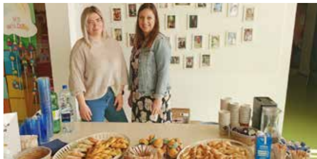
Die 4. Klasse beim SeneCura Sozialzentrum Wildon.