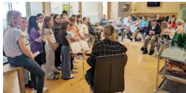
Die 4. Klasse beim SeneCura Sozialzentrum Wildon.