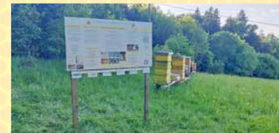
Die neue Infotafel samt Vereinsbienen am neuen Lehrbienenstand am Buchkogel.