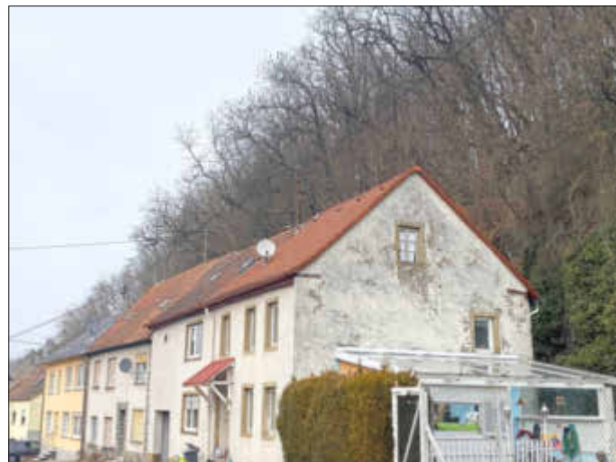
Die Bäume oberhalb der Gebäude in der Straße „Züsch“ stellen schon länger eine Gefährdung da. Jetzt sollen sie entfernt werden.