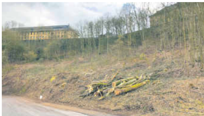
Im Zuge der notwendigen Verkehrssicherungsmaßnahme wurden am Steilhang der Nordtorstraße Bäume gefällt.

Im Zuge des aktuellen Ausbaus der Nordtorstraße im Stadtteil Oberstein wurde durch das Forstamt Birkenfeld, Forstrevier Idar-Oberstein auch eine Verkehrssicherungsmaßnahme im dortigen Baumbestand durchgeführt. Dabei waren im Hangbereich umfangreiche Baumentnahmen erforderlich, da der an die Nordtorstraße grenzende Wald in seiner Stabilität und Vitalität stark beeinträchtigt war. Ähnliche Maßnahmen wurden in den vergangenen Wochen unter anderem bereits entlang der B 422 zwischen Tiefenstein und Kirschweiler oder entlang der L 177 zwischen den Abfahrten Regulshausen und Reichelsdell durchgeführt. Martin Döscher, Leiter des Forstreviers Idar-Oberstein, weist darauf hin, dass in den nächsten Wochen auch noch weitere solcher Verkehrssicherungsmaßnahmen erfolgen werden.