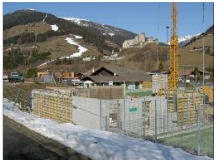
Rohbau des Sporthauses im Frühjahr