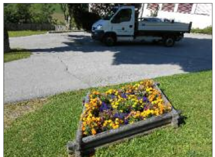
Pflege und Instandhaltung der Grünanlagen