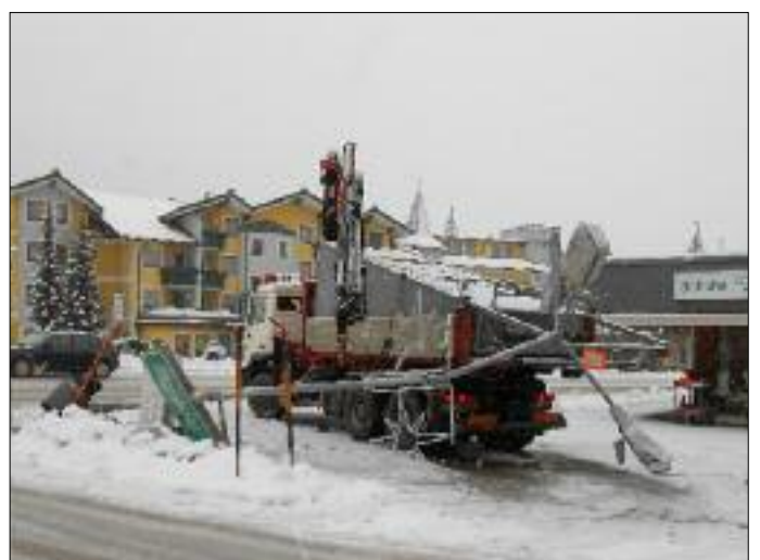
Beschädigte Straßenbeleuchtung bei der B100