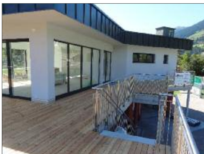
Terrasse beim Gastronomielokal im Sporthaus