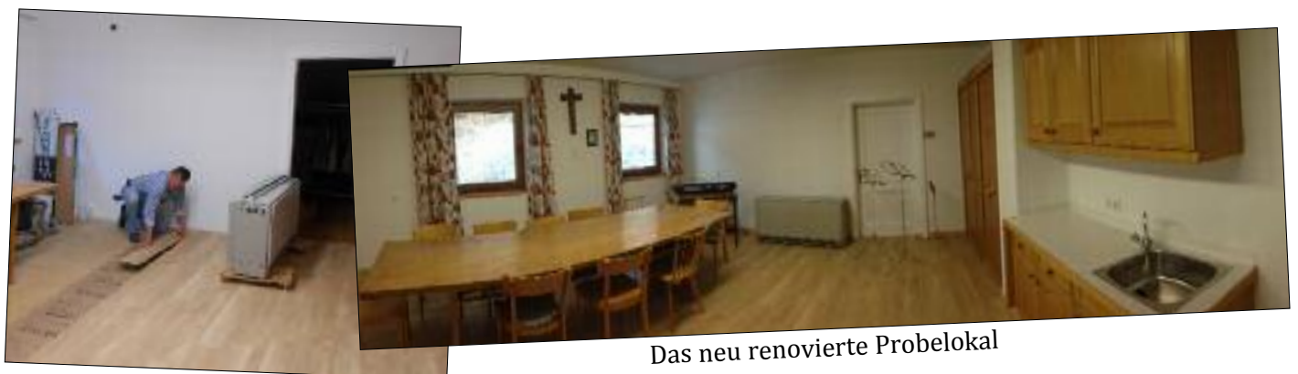
Das neu renovierte Probelokal