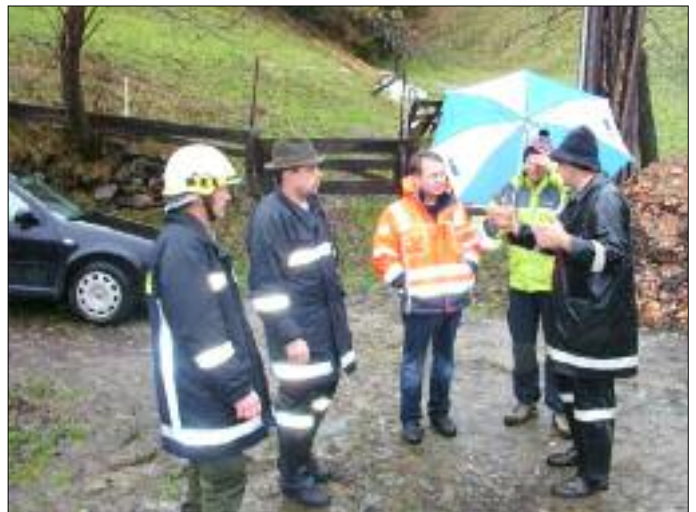
Besprechung der Einsatzleitung