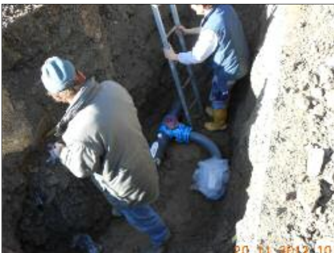
Arbeiten bei der Löschwasserleitung in Tessenberg