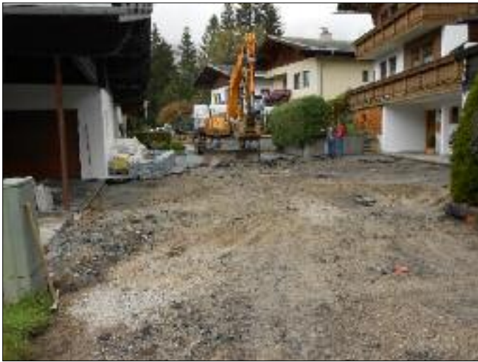
Sanierung der Wohnstraße in Hinterheinfels