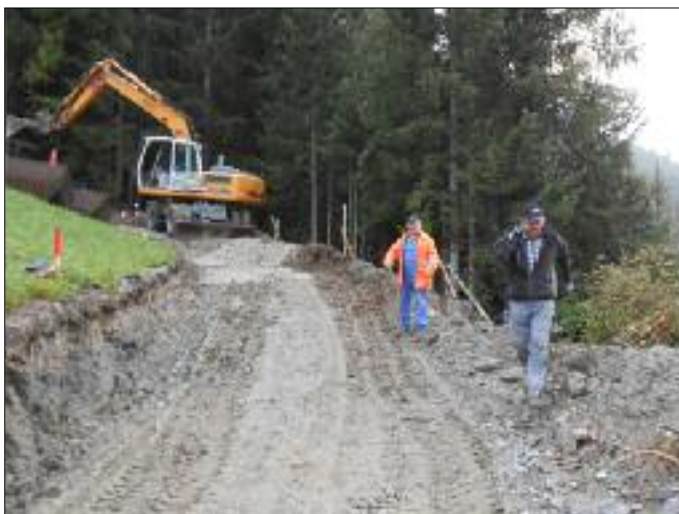
Sanierung der Straße Tessenberg-Oberberg - 2. Abschnitt