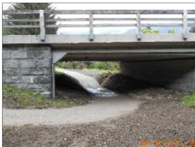
Unterführung der B100 am Villgratenbach