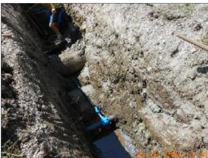
Herstellung von Wasseranschlüssen bei Privathäusern