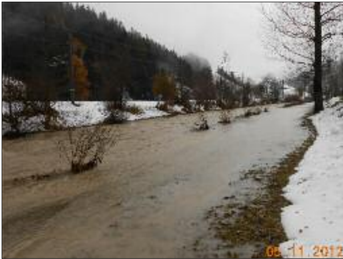
Hochwasser entlang der Drau