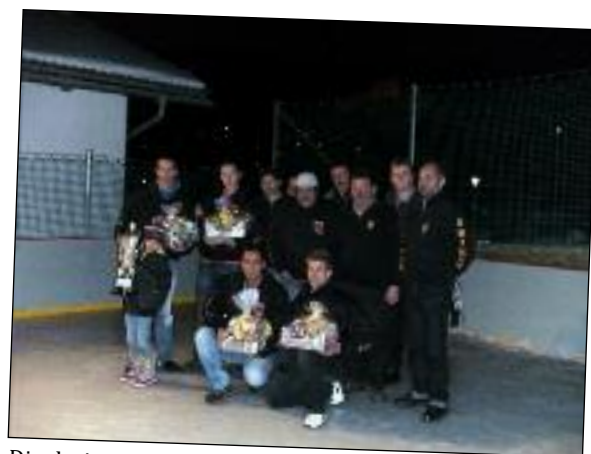
Die drei erstgereihten Mannschaften der Eisstockdorfmeisterschaft