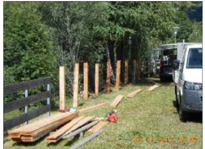
Zaun entlang des Villgratenbaches