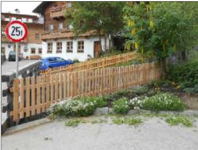
Zaun beim Tessenberger Bach