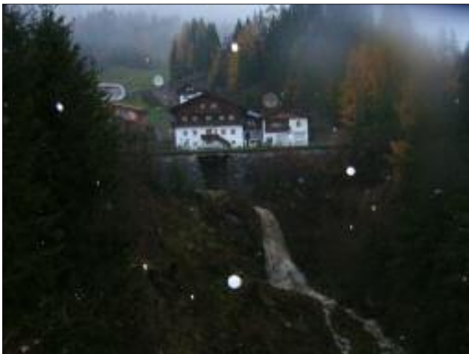
Wassermassen des Tessenberger Baches