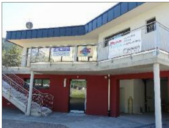
Fertigstellung der Außenanlagen beim Sporthaus