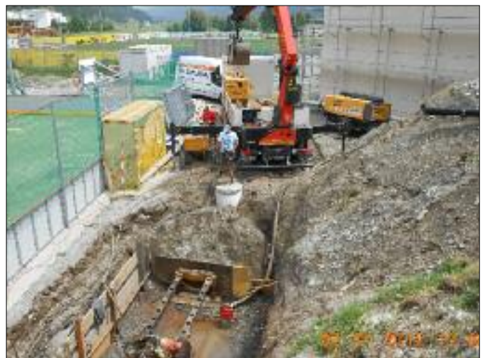
Kanalanschlussarbeiten beim Sporthaus