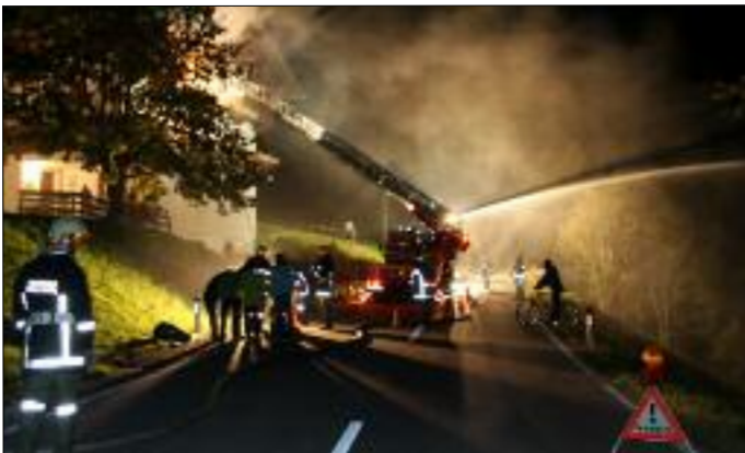
Herbsthauptübung mit den Nachbarwehren Panzendorf und Sillian

Da es im Ernstfall sehr wichtig ist, sich auf gut ausgebildete Einsatzkräfte verlassen zu können, fanden auch im Jahr 2012 viele Übungen und Schulungen statt. Zahlreiche Feuerwehrmänner besuchten verschiedene Lehrgänge an der Landesfeuerweherschule in Telfs und im Bezirk. Besonders bei den Herbstübungen wurde großes Augenmerk auf gemeinsame Übungen mit den Nachbarfeuerwehren Panzendorf, Strassen und Sillian gelegt, um im Ernstfall eine gute Zusammenarbeit gewährleisten zu können.