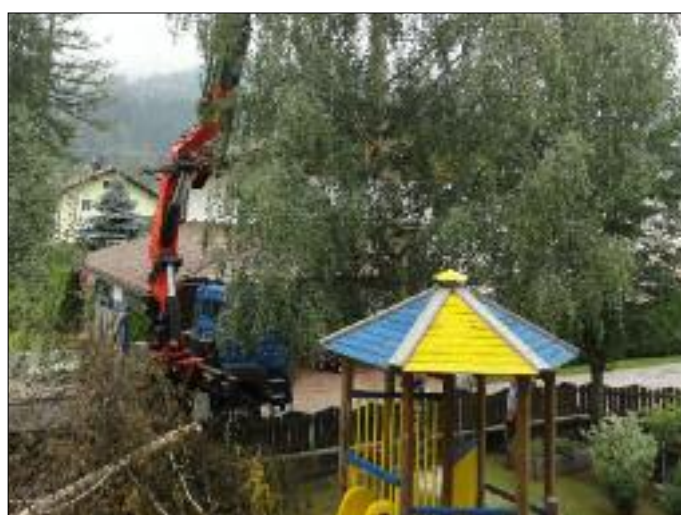
Fällen der Birken beim Kindergarten