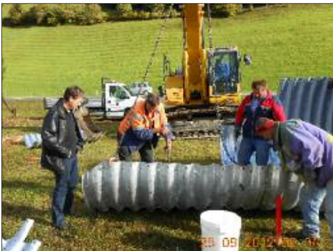
Erschließung des Gewerbegebietes mittels Wellstahldurchlass über den Mühlbach