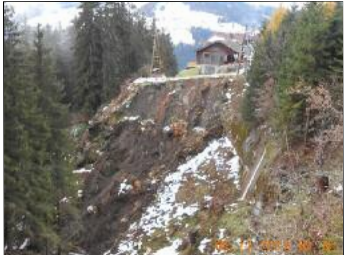
Hangrutschung in Tessenberg