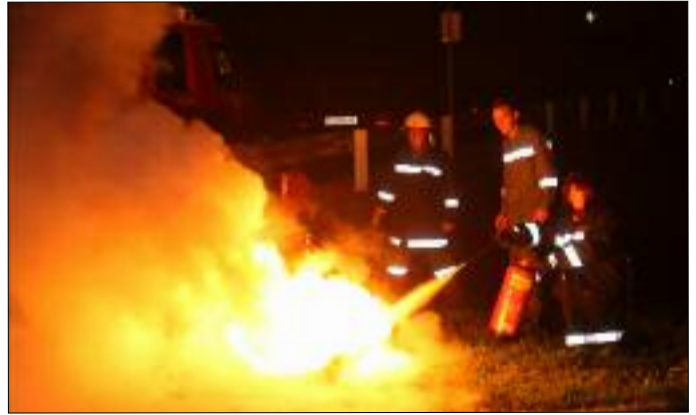
„Action“ bei der „Langen Nacht der Feuerwehr“

Auch die Kameradschaft kam im abgelaufenen Feuerwehrjahr nicht zu kurz. Neben den alljährlichen Fixpunkten - wie dem Florianikirchgang - veranstaltete die Feuerwehr Tessenberg unter anderem einen Dämmerstopp mit der MK Heinfels im Feuerwehrhaus. Eine Besonderheit stellte die „Lange Nacht der Feuerwehr“ am 1. September dar, welche landesweit stattfand und bei der auch unsere Feuerwehr die Pforten des Gerätehauses öffnete. Die Besucher hatten die Möglichkeit das Gerätehaus und die verschiedenen Gerätschaften bis ins kleinste Detail zu erkunden. Weiters bestand die Möglichkeit mittels Feuerlöscher einen Fettbrand zu löschen und so Feuerwehr einmal „hautnah“ zu erleben.