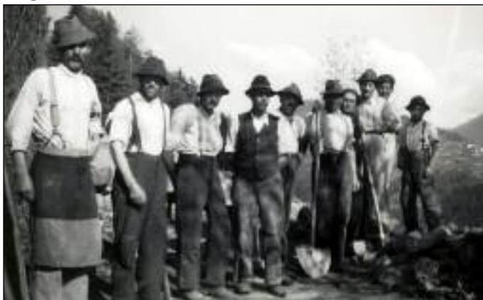
Güterwegbau von Tessenberg nach Panzendorf 1952