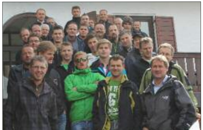
Die Ausflugsteilnehmer in Werfen

Am 15. September fand – schon traditionell zum Abschluss der Funktionsperiode – ein Kameradschaftsausflug statt. Dieses Mal ging es nach Werfen im Salzburger Land, wo wir die Eisriesenwelt besichtigten. Nach dem Mittagessen auf der Burg Hohenwerfen ging es weiter nach Gmünd, wo wir die Möglichkeit hatten, die Altstadt zu besichtigen. Anschließend ging die Fahrt weiter nach Greifenburg, wo wir den Tag bei einem guten Abendessen ausklingen ließen. Bei der Ankunft in Tessenberg konnten die Teilnehmer auf einen äußerst gelungenen und geselligen Ausflug zurückblicken, welcher sicher noch lange in Erinnerung bleiben wird.