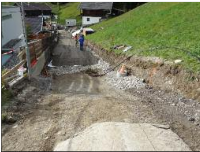
Sanierung der Straße Tessenberg-Oberberg - 1. Abschnitt