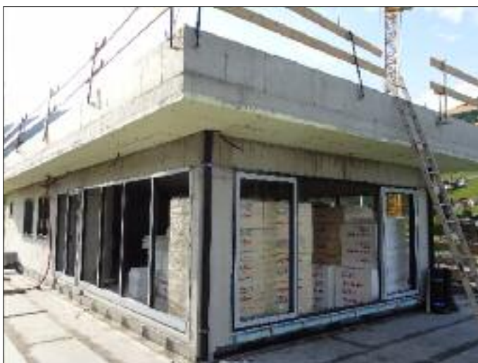
Das obere Stockwerk ist im Entstehen ...