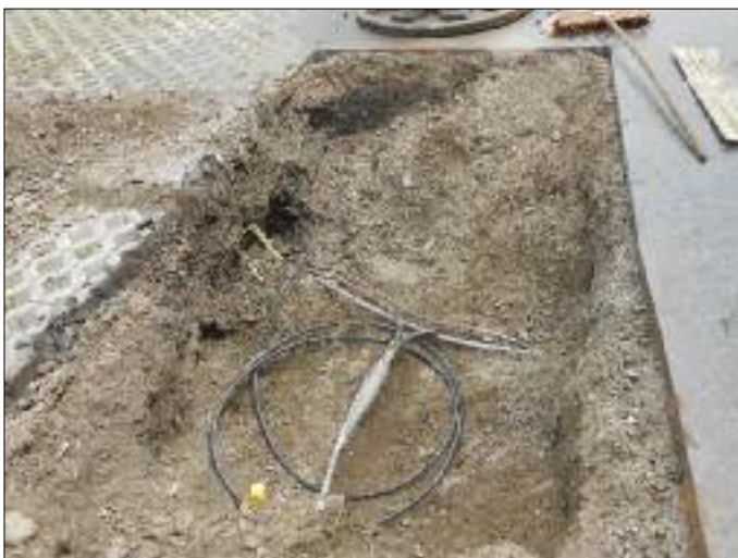
Arbeiten bei der Straßenbeleuchtung in Panzendorf