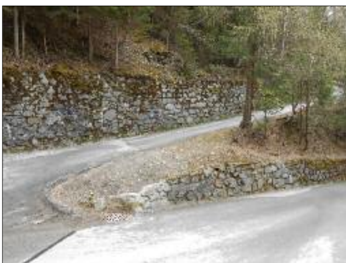
Instandhaltungsarbeiten Straße Heinfelsberg