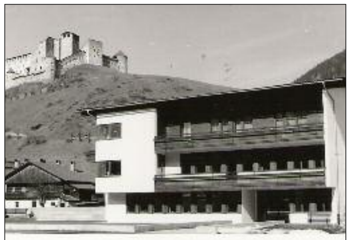
Das neu erbaute Gemeindehaus

Die Gemeinde Panzendorf beginnt mit dem Bau des Gemeindehauses. Mechanikermeister Otto Lusser baut eine Autowerkstätte.