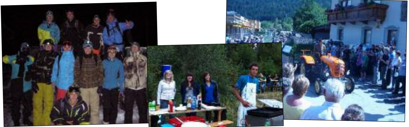
Text und Fotos: LJ Panzendorf

Abschließend wünschen wir allen Bewohnern von Heinfels frohe Weihnachten und ein gutes, neues Jahr 2013.