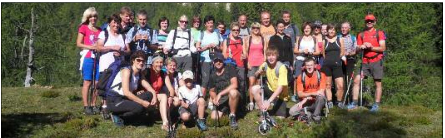
Die Teilnehmer an der Fußwallfahrt über den Kofel nach Maria Luggau.