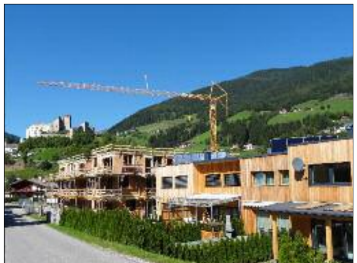
Wohnanlage der OSG in Bau