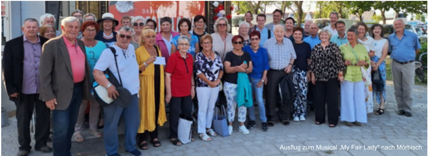
Ausflug zum Musical „My Fair Lady“ nach Mörbisch