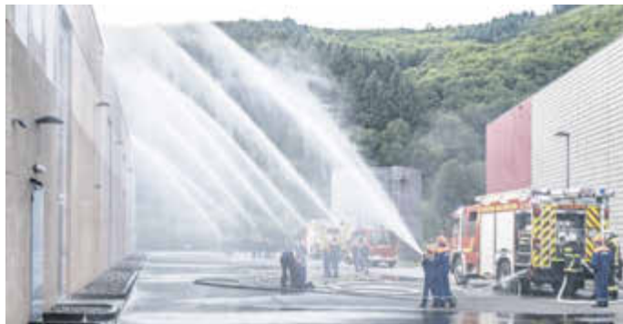
Nachdem die ‚Vermissten‘ gerettet waren, ‚löschte‘ die Jugendfeuerwehr Idar-Oberstein die Messehalle.

„Feuer in der Messe Idar-Oberstein, mehrere Personen vermisst.“, so lautete die Einsatzmeldung für die Abschlussübung 2021 der Jugendfeuerwehr Idar-Oberstein. Und so rückten die insgesamt 40 Jugendlichen – Mädels und Jungs aus allen Stadtteilen – mit mehreren Löschfahrzeugen an der Messe an. Schnell wurden drei Übungsdummys gerettet und parallel dazu fünfzehn Strahlrohre zur Brandbekämpfung aufgebaut. Mit ihnen wurde dann die Messehalle ‚gelöscht‘.