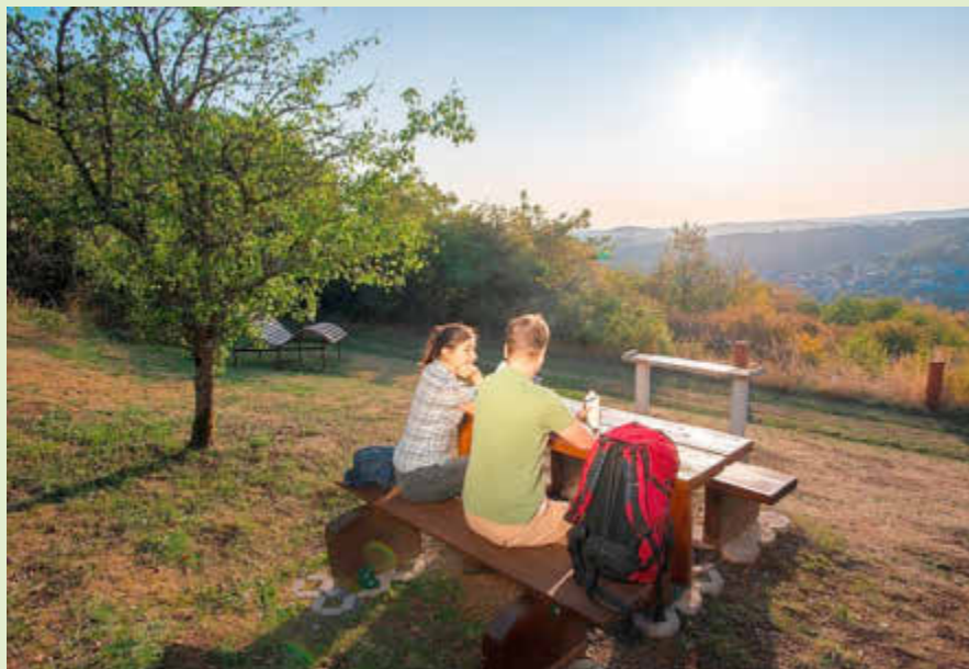
Wanderbüro Saarlunzrück-Steig

Begleiten Sie unseren Wanderführer Ernst Schmitz auf diesem abwechslungsreichen Premiumwanderweg und entdecken Sie die grandiose Fern- und Talsichten.