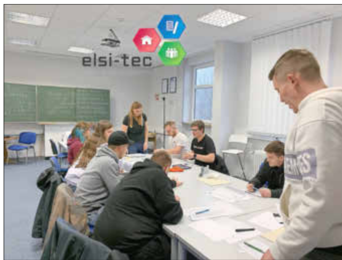
Engagiert beteiligten sich die Auszubildenden an der ersten „Azubi-Akademie“

Über weitere Anmeldungen und ein damit verbundenes Interesse an der Ausbildung unseres Nachwuchses, sowie der Qualifikation unserer Region freuen sich die beiden Geschäftsführer schon jetzt. (gf).