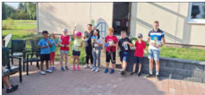
Die Teilnehmerinnen und Teilnehmer der Kinder- und Jugend Clubmeisterschaft 2021.

Übrigens: der Jahresmitgliedsbeitrag für Kinder und Jugendliche beträgt nur 50,00 €. In diesem Beitrag sind das regelmäßige Training, die Abnahme der Kindergolfabzeichen sowie die Teilnahme an Turnieren enthalten. Neben den Grundlagenübungen auf der Driving Range und dem Putting / Pitching Grün spielen die Kinder auch einzelne Löcher auf dem Platz. Schnuppertrainings sind jederzeit möglich. Voranmeldungen bitte bei sven.fritz@golf-baumholder.de .