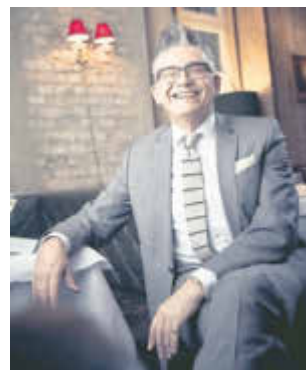
Götz Alsmann

Das 25. Jubiläum der Jazztage Idar-Oberstein hätte eigentlich schon im Jahr 2020 stattfinden sollen. Mit zwei Jahren pandemiebedingter Pause startet das Kulturamt Idar-Oberstein nun aber mit einem außergewöhnlichen Programm in die Jubiläumsausgabe des beliebten Festivals in der Innenstadt des Ortsteils Idar. Auf fünf Bühnen geben sich an drei Tagen mehr als zwanzig nationale und internationale Jazzgrößen, aufstrebender Nachwuchs und routinierte Lokalmatadore die Mikrofone in die Hand und verwandeln den Stadtteil Idar in eine Jazzmetropole.