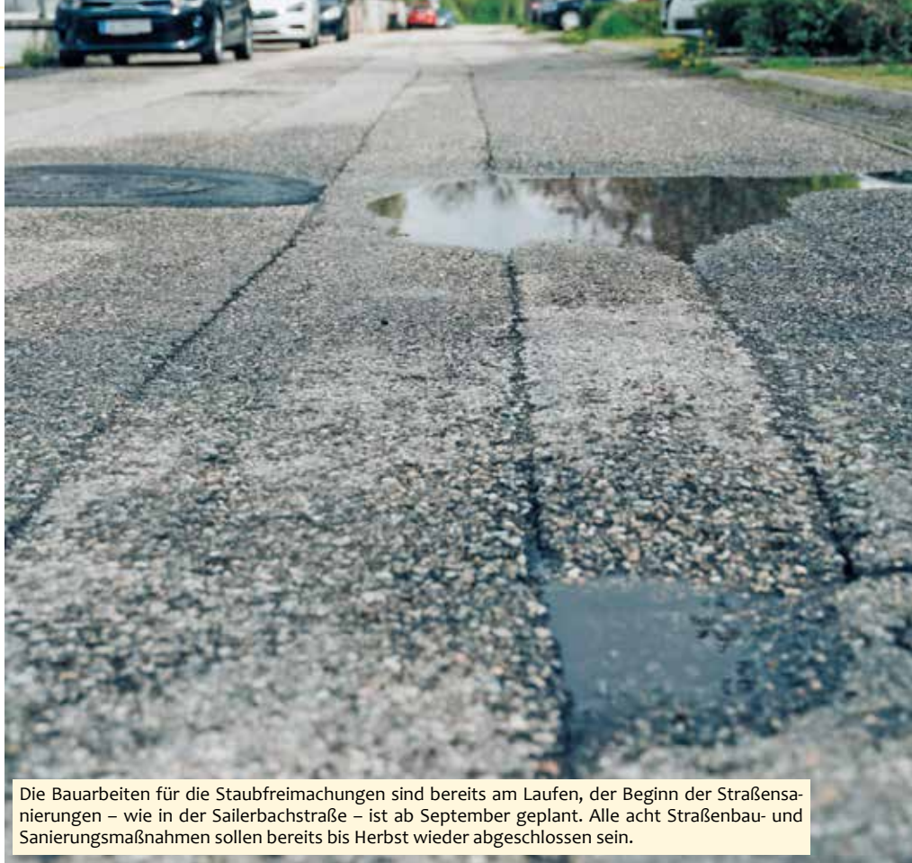
Die Bauarbeiten für die Staubfreimachungen sind bereits am Laufen, der Beginn der Straßensanierungen – wie in der Sailerbachstraße – ist ab September geplant. Alle acht Straßenbau- und Sanierungsmaßnahmen sollen bereits bis Herbst wieder abgeschlossen sein.

Bedanken möchte ich mich aber auch für die Unterstützung bei den Vertretern des Landes Oberösterreich, beim Bund für die Bereitstellung der Kommunalinvestitionsmilliarde 2023 und für die hervorragende Beratung durch die Mitarbeiterinnen und Mitarbeiter der Direktion Inneres und Kommunales beim Amt der Oö. Landesregierung. Nur so war es trotz der sehr angespannten Finanzlage möglich, rund 830.000 EUR für die Finanzierung der Aktion 33/8 aufzustellen.