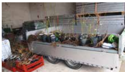
Die Wildsträucher und Obstbäume wurden im Bauhof zur Abholung zusammengestellt.

Die Wildsträucher und Obstbäume wurden im Bauhof zur Abholung zusammengestellt. Die (Wild-)Bienen, Insekten und Vögel werden es ihnen in den nächsten Jahren sicher danken!