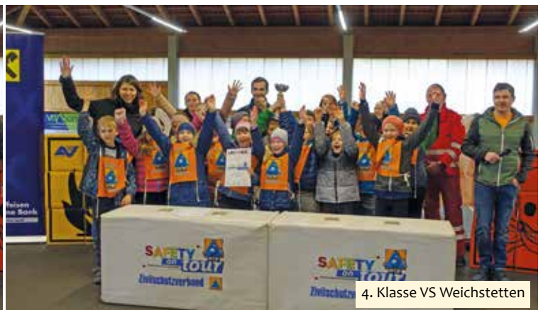
4. Klasse VS Weichstetten