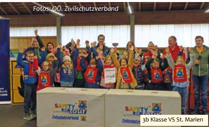
3b Klasse VS St. Marien