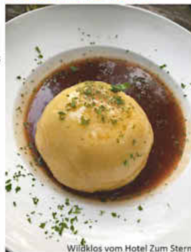
Wildklos vom Hotel Zum Stern