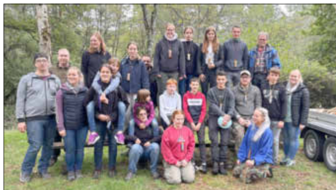
Hier sind alle Teilnehmer der Rallye zusammen.

Den musikalischen Abschluss des heißen Sommers und den zahlreichen Auftritten feierte der Musikverein „Germania“ Ruschberg dieses Mal am Grillplatz in der Eschelbach. Eingeladen waren alle Vereinsmitglieder, also große wie kleine Musiker sowie alle tatkräftigen Helfer unserer letzten Sommerfeste.