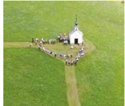
Andacht bei Kapelle