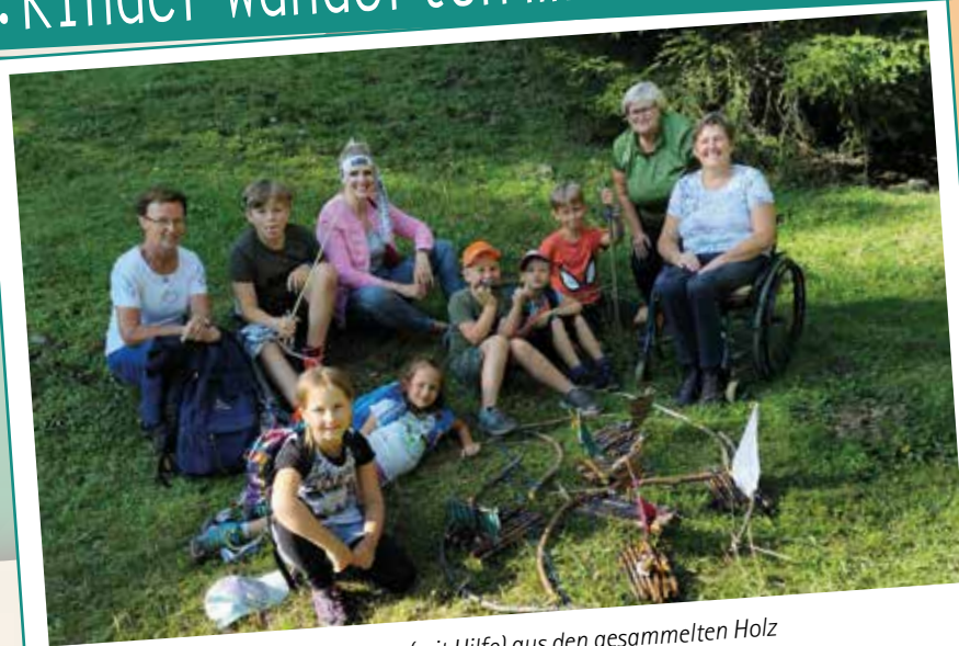
Großen Spaß beim bauen der Flosse (mit Hilfe) aus den gesammelten Holz und anschließend Probefahrt im Bach. Die Jause ließen sich alle gut schmecken.