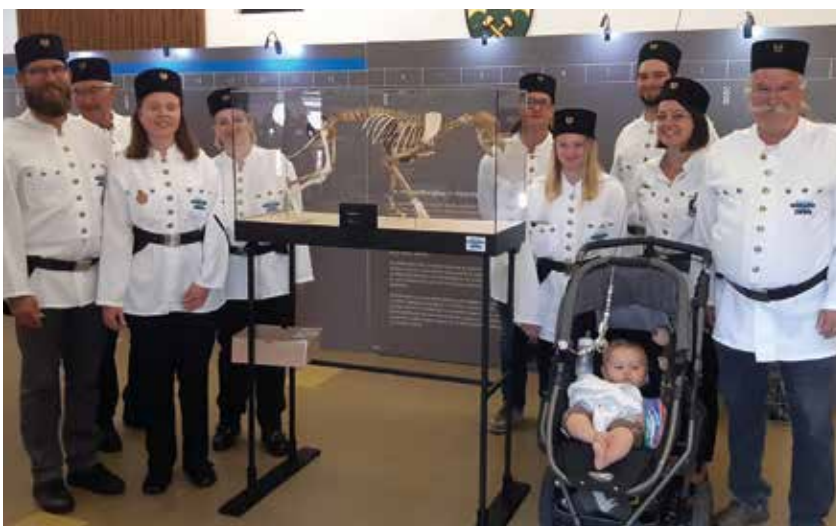
Auf Besuch bei unserem „Grubi“

Auch dieses Jahr war das Schaubergwerk Museum Oberzeiring wieder beim Aufsteirern in der Grazer Schmiedgasse