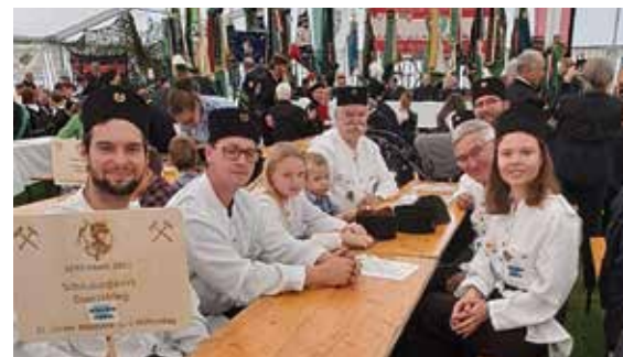
Unsere Kumpel beim gemütlichen Ausklang

schen. Ein gemeinsamer Umzug mit über 20 verschiedenen Vereinen bildete das Highlight. Natürlich durfte auch ein gemütliches Beisammen sein nicht fehlen.