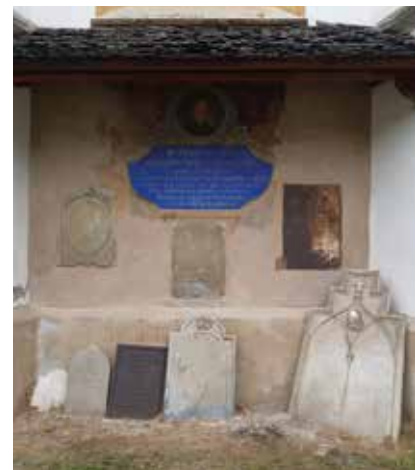
Übersicht nach der Fertigstellung der Bildfixierung.

lich restauriert werden. Seit beinahe 50 Jahren sind diese Renovierungsarbeiten schon im Gespräch, und jetzt konnte gemeinsam das Bild vor dem endgültigen Verfall gerettet werden. Weiters ist mit den Beteiligten eine Informationstafel sowie die Neugestaltung des Bodenbereichs geplant.