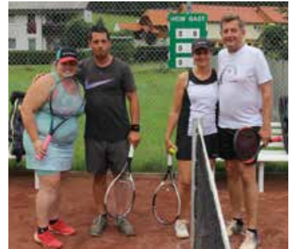
Finalspiel Mixed A