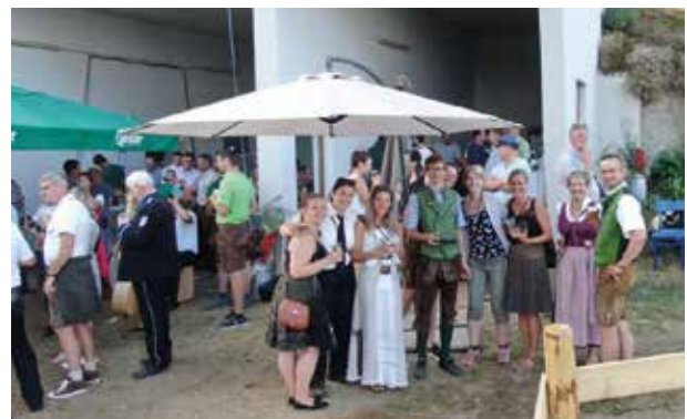
Vor der Weinbar