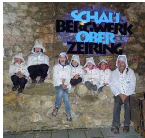
Lange Nacht der Museen 2017

Am 1. Oktober war es wieder soweit und die lange Nacht der Museen begann. Auch das Schaubergwerk öffnete heuer wieder seine Pforten um allen Interessierten eine speziell an diesem Tag zusammengestellte Führung untertage zu bieten.