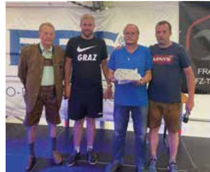
ges. Im Zelt und Disco wurde bis früh in den Morgen gefeiert.