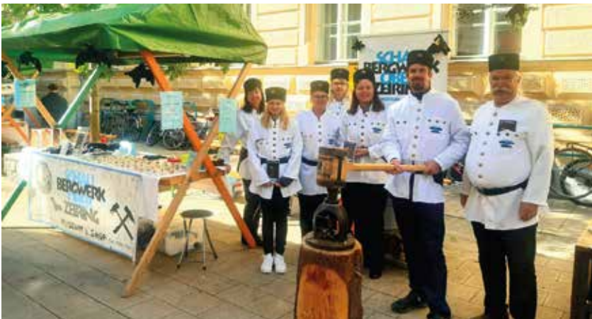
Das Prägen des Zeiringer Pfnings war unter anderem eines der Highlights in der Grazer Innenstadt

vertreten. Neben den wunderschönen Mineralien (welche es auch bei uns im Shop Oberzeiring zu erwerben gibt) konnte man natürlich auch den Zeiringer Pfenning prägen und erwerben. Auch unser Landeshauptmann stattete uns einen Besuch ab.