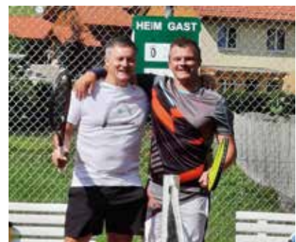
Finalspiel Herren Hobby B