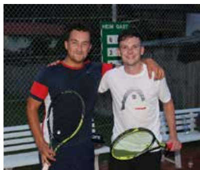
Finalspiel Herren Hobby A