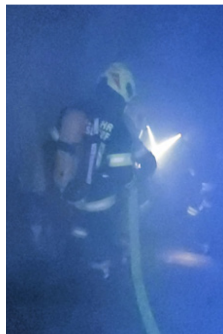
Übung im Kellergewölbe