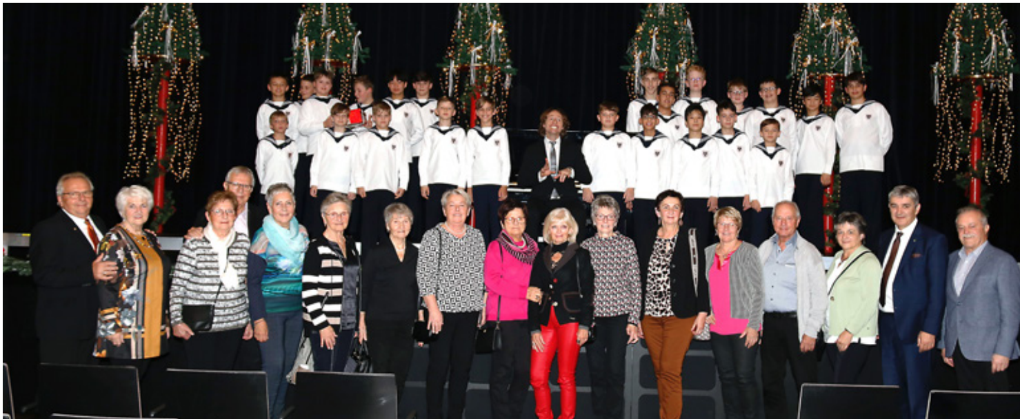
Mitglieder des Seniorenbundes besuchten das Festkonzert der Wiener Sängerknaben in Mattersburg.