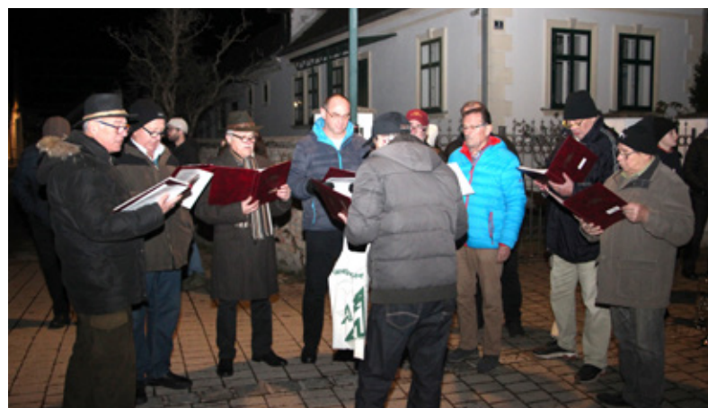
Weihnachtslieder vom Männergesangsverein