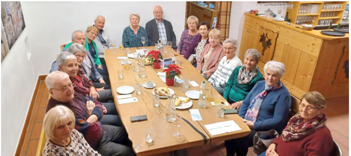
Die Mitglieder des Seniorenbundes verbrachten die diesjährige Weihnachtsfeier in gemütlicher Runde beim Heurigenrestaurant Stegschandl.