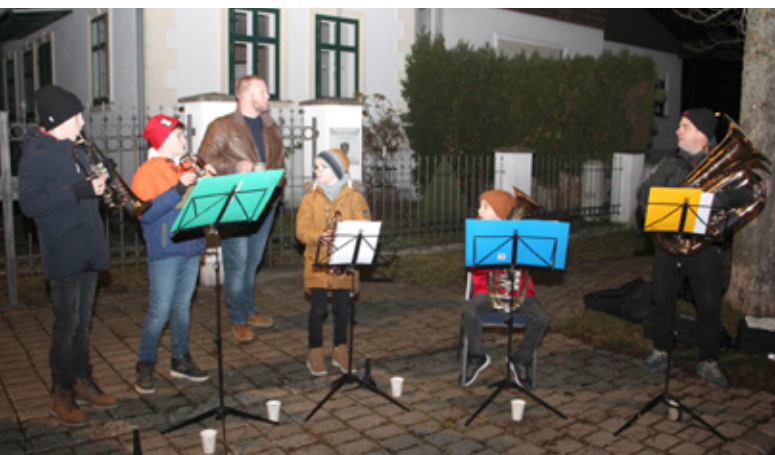
Die Jugendbläsergruppe aus Walbersdorf