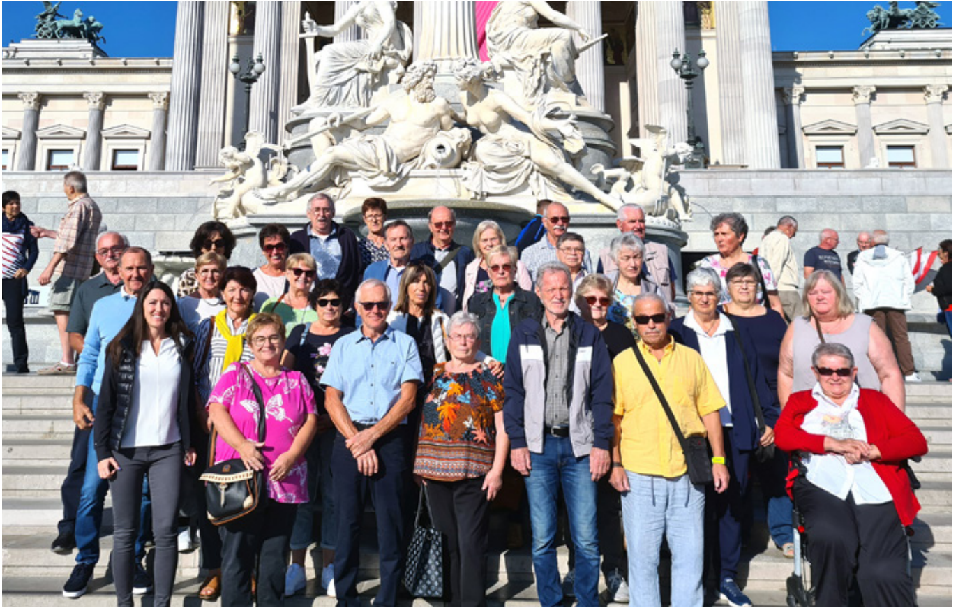
Gruppenbild vor dem neu renovierten Parlamentsgebäude in Wien

Insgesamt 63 Pensionistinnen und Pensionisten der Ortsgruppen Pöteltsdorf, Zemendorf und Stöttera besuchten die Bundeshauptstadt Wien.