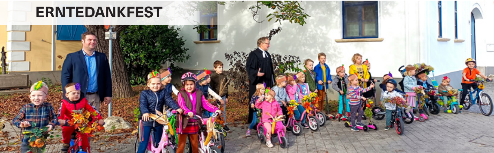
Die Kinder präsentieren stolz ihre geschmückten Fahrzeuge.