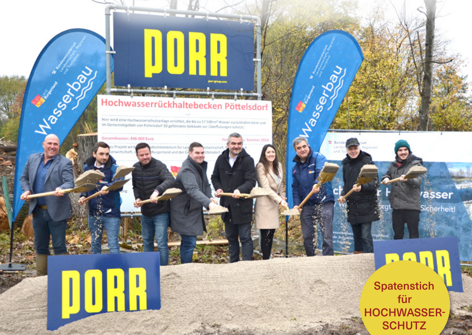
Spatenstich für das Projekt Hochwasserschutz in Pöttelsdorf