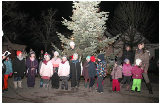
Die Kindergartenkinder sangen mit Begeisterung Weihnachtslieder

eingebunden. Die Ortsbewohner sangen selbstverständlich auch wieder gemeinsam einige Weihnachtslieder. Danach begab man sich wieder in die warme Stube des Dorfsaales, um das Vereinsjubiläum noch gebührend zu feiern. So dauerte das diesjährige „Christbaumsingen“ bis in die Mitternachtsstunden. Die Damen des Verschönerungsvereines waren sich einig, „es war eine gelungene Veranstaltung und gute Stimmung unter den Gästen“. Herzlichen Dank allen für die langjährige Treue und Mithilfe für eine lebenswerte Ortschaft.