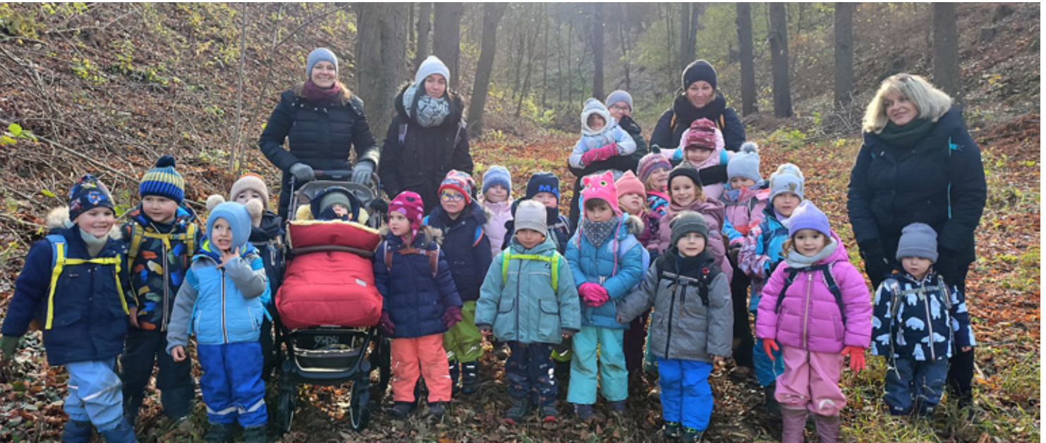
Die Kinder waren vom Ausflug in den Wald sehr begeistert.

In diesem Kindergartenjahr haben sich die Mädchen und Buben zur Aufgabe gemacht, Pöttelsdorf und seine Umgebung näher kennenzulernen. Einmal im Monat packen sie