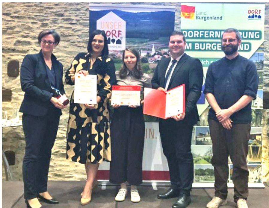
Verleihung des burgenländischen Dorferneuerungspreises 2023 in Stadt Schläining

Auch der Zubau des FW-Hauses ist bereits weit fortgeschritten. Neben der Fertigstellung des Innenausbaus der Hallenerweiterung wurde auch die PV-Anlage inklusive des Stromspeichers bereits in Betrieb genommen. Da diese Anlage im