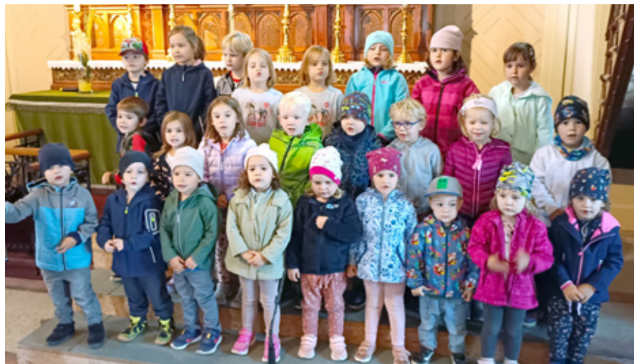
Beim Gottesdienst in der Kirche

Das Erntedankfest mit Gottesdienst ist ein Fixpunkt für den Kindergarten in Pöttelsdorf. Jedes Jahr wird der Gottesdienst von den Kindern mit Gedichten und Liedern mitgestaltet. Heuer stand neben der Ernte von Früchten und Gemüse auch das Wohl der Tiere im Mittelpunkt. Ein Höhepunkt des Festes war der traditionelle Umzug der geschmückten Fahrzeuge mit den Kindern. Die Fahrzeuge wurden von den Kindern und Eltern liebevoll gestaltet. Mit großem Stolz wurden die bunten Dekorationen präsentiert.