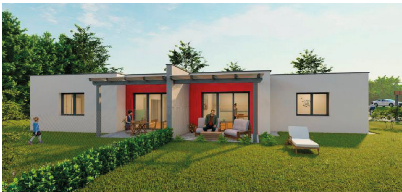
OSG Bungalows in Limbach