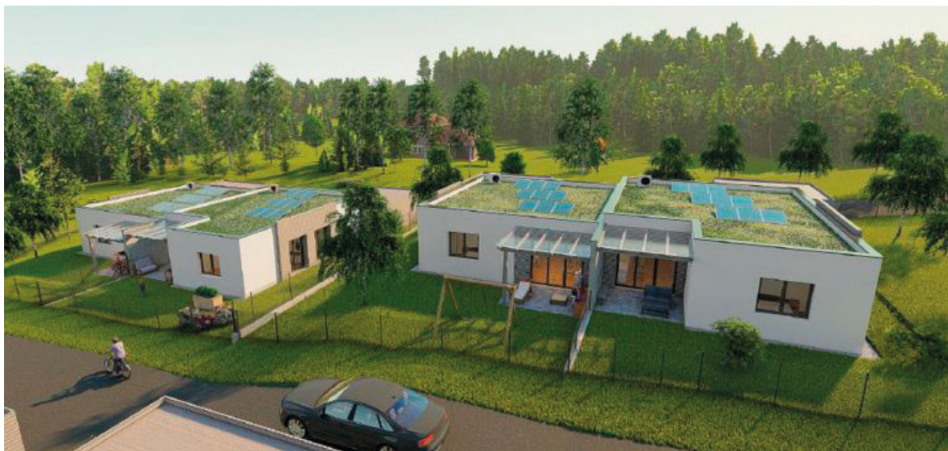
OSG Bungalows in Kukmirn

Es entstehen lichtdurchflutete Wohnräume, großzügige Wohn-Essbereiche und sonnige Terrassen samt Eigen-gärten. Informationen zum Projekt gibt es im OSG-Büro Oberwart unter 03352-404 DW 51 oder 52.