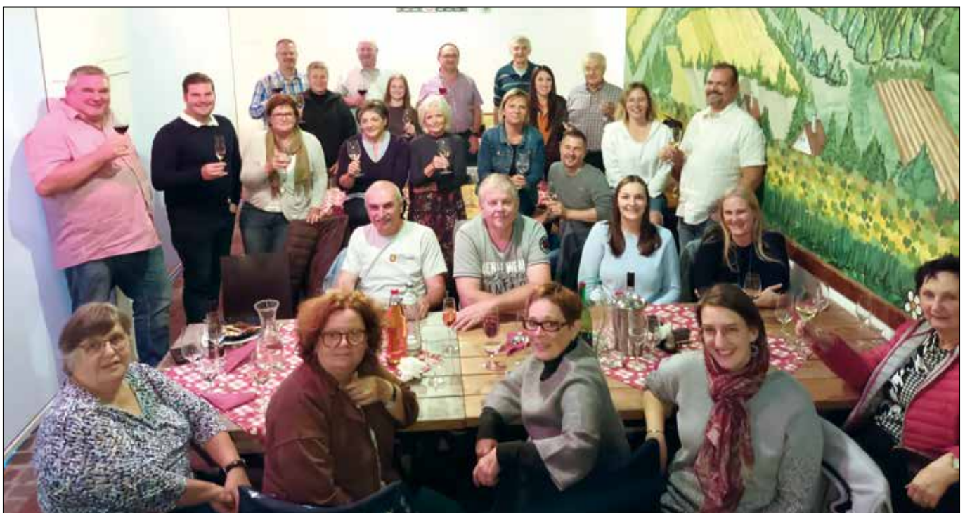
Verabschiedung in den Ruhestand im Kreise ihrer Kolleginnen und Kollegen (2022)