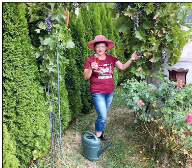
Start frei für neue Herausforderungen