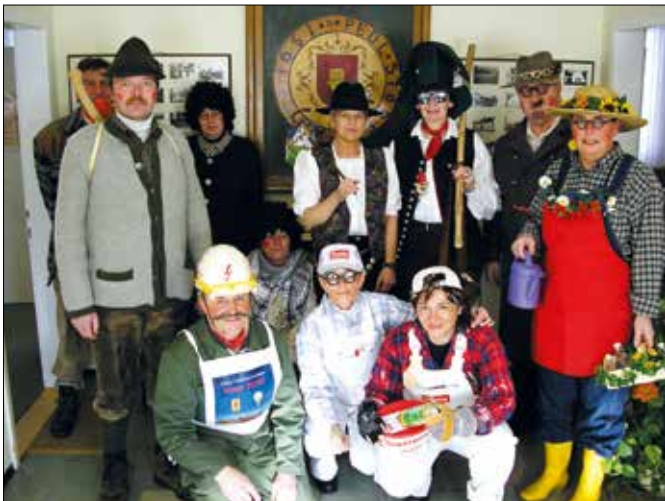
einer von vielen Faschingdienstagen (2005)