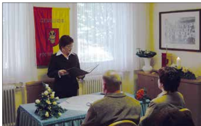
als Standesbeamtin im Einsatz (2003)