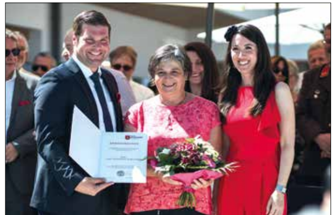
Verleihung der Ehrenbürgerschaft (2022)