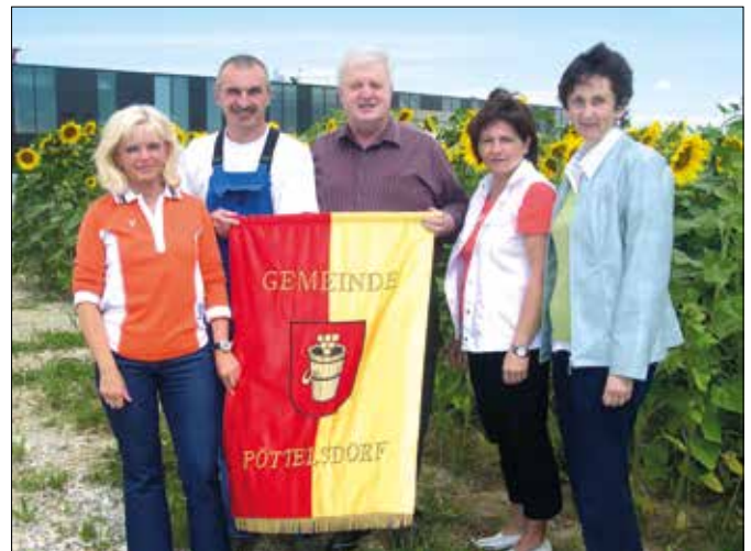
das Gemeindeteam im Jahr 2005