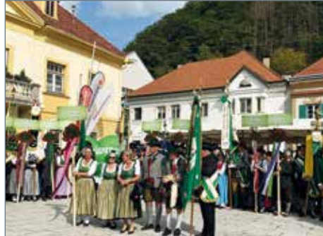
110 Jahre TV Floninger

Abordnungen unseres Vereines besuchten die Jubiläumsfeste „90 Jahre TV St. Michael“ am 24.9 und