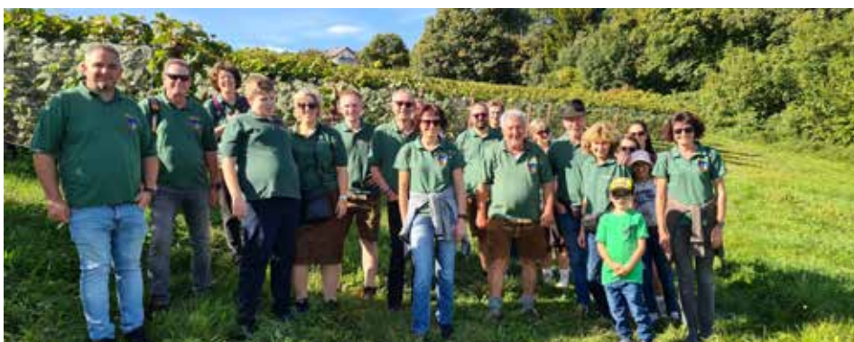
Ausflug nach Graz, mit Brunch und Führung im Flughafen Thalerhof

Der Spätherbst war wieder geprägt von den regelmäßig wiederkehrenden Ausrückungen wie z.B. zum Fitmarsch am Nationalfeiertag, dem Totengedenken in St. Peter und der Gefallenenehrung sowie der Barbara-Feier in Vordernberg.