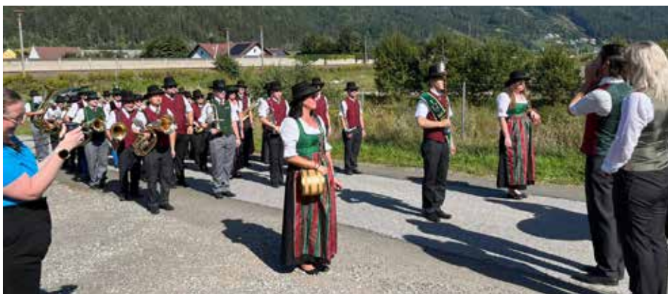
Einmarsch in Traboch

Mit den schon traditionellen Ausrückungen wie der Teilnahme beim Bezirksmusiktreffen, diesmal in Niklasdorf, oder der musikalischen Umrahmung des Marktfestes in St. Peter-Freienstein starteten wir in den Sommer. Beim diesjährigen Umschneiden des Maibaumes in Vordernberg gestalteten wir einen Frühschoppen und hatten wie auch alle anderen Anwesenden bei der Verlosung der Maibaumstücke großen Spaß.